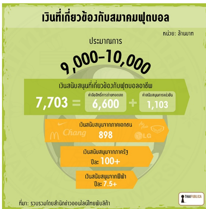
รูปภาพที่ 3.2 การแสดงจำนวนเงินที่เกี่ยวข้องกับสมาคมฟุตบอล 6