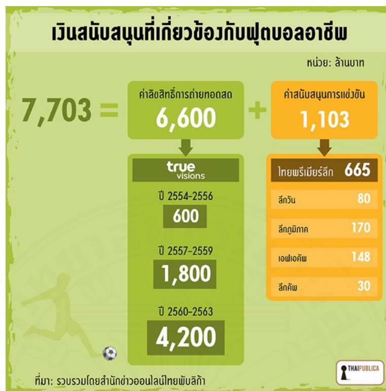
รูปภาพที่ 3.3 การแสดงเงินสนับสนุนที่เกี่ยวข้องกับฟุตบอลอาชีพ 7

เงินที่เกี่ยวข้องกับการแข่งขันฟุตบอลอาชีพในประเทศ หลังถูก AFC บังคับให้ต้องจัดตั้งนิติบุคคลเข้ามาทำหน้าที่บริหารจัดการฟุตบอลลีกภายในประเทศ นำไปสู่การจดทะเบียนจัดตั้งบริษัทไทยพรีเมียร์ลีกฯ ในปี 2551 (ที่มีนายวรวิร์เป็นผู้ถือหุ้นใหญ่ 45%) วงการฟุตบอลไทยก็เข้าสู่ยุคการทำธุรกิจลูกหนังอย่างจริงจัง และเติบโตอย่างก้าวกระโดด กระทั่งมีมูลค่าราว 3,500 ล้านบาท/ปี ในปัจจุบัน จากการประเมินโดยนายองอาจ ก่อสินค้า ประธานบริษัทไทยพรีเมียร์ลีกฯ คนปัจจุบัน ผลประโยชน์ในส่วนนี้เป็น “ก้อนใหญ่ที่สุด” ซึ่งสมาคมฟุตบอลฯ เข้าไปเกี่ยวข้อง โดยมีการทำสัญญาจ้างบริษัทเอกชน ได้แก่ บริษัท สยามสปอร์ต ซินดิเคท จำกัด (มหาชน) เป็นผู้บริหารจัดการสิทธิประโยชน์