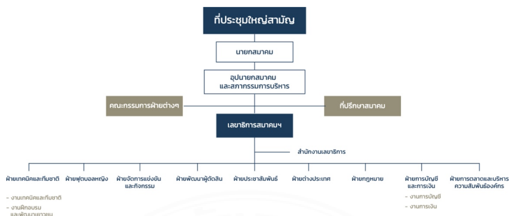
รูปภาพที่ 3.1 โครงสร้างของสมาคมกีฬาฟุตบอลแห่งประเทศไทย 2

จากรูปภาพที่ 3.1 ทำให้ได้ทราบว่า โครงสร้างของสมาคมกีฬาฟุตบอลแห่งประเทศไทยฯ ประกอบด้วยดังนี้