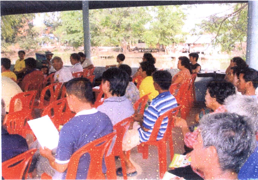
ภาพ 7 คณะกรรมการและสมาชิกกลุ่มออมทรัพย์เพื่อการผลิตบ้านสิงห์ได้ร่วมการจัดเวทีแลกเปลี่ยนเรียนรู้