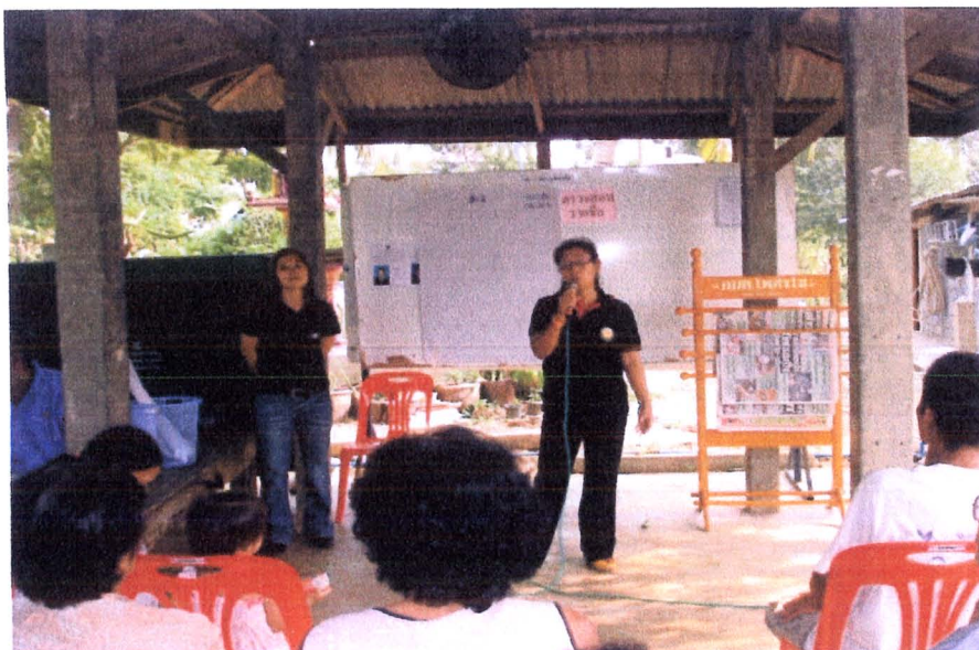
ภาพ 5 การจัดเวทีแลกเปลี่ยนเรียนรู้