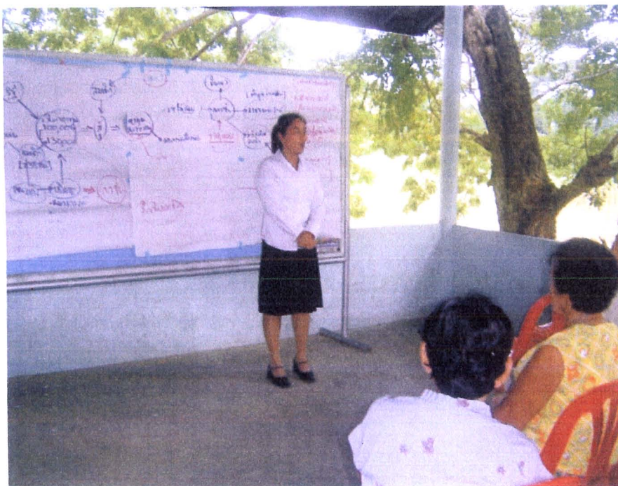
ภาพ 9 ผู้วิจัยได้ดำเนินการชี้แจงวัตถุประสงค์ของการจัดเวทีแลกเปลี่ยนการเรียนรู้ของกลุ่มออมทรัพย์เพื่อการผลิต