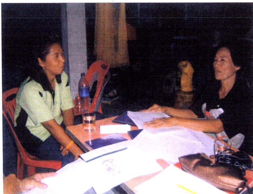
ภาพ 10 ผู้วิจัยได้สัมภาษณ์ประธานกลุ่มออมทรัพย์ เพื่อการผลิต บ้านสิงห์ใต้