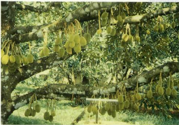
Fig. 2 Number of Duian (ev. Chanee) fruits per tree คุณภาพ

ช่วยผสมเกสร (Hand-cross pollination) จะทำให้เปอร์เซ็นต์การติดผลดีขึ้น (ทรงพล 2530) (Fig.2) หรือดำเนินการควบคู่กับการใช้เทคโนโลยีอย่างอื่น เพื่อช่วยในการติดผลต่อไป