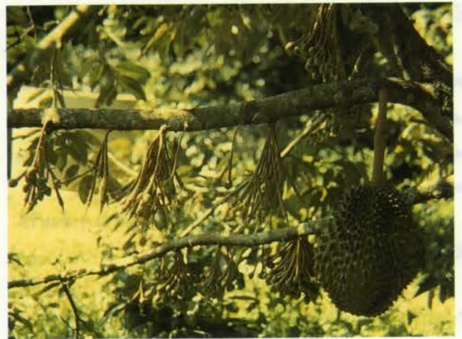
Fig. 3 Early fruit production after Paclobutrazol application and flowering in normal season.

และเมื่อเปรียบเทียบกับวันออกดอก และ เปอร์เซ็นต์ต้นที่ออกดอกก่อนฤดูของต้นที่สมบูรณ์และต้นไม่สมบูรณ์ พบว่า ต้นที่สมบูรณ์จะออกดอกเร็วกว่าต้นที่ไม่สมบูรณ์เพียง 6 วัน (Table 2) และมีเปอร์เซ็นต์ต้นที่ออกดอกก่อนฤดูมากกว่าด้วย เปอร์เซ็นต์ของต้นที่ออกดอกก่อนฤดูจะสูงขึ้นตามอัตราความเข้มข้น ดังแสดงไว้ใน Table 3