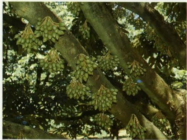
Fig.1 Durian (cv. Chanee) flower setting after thinning and Pachobutrazol application

การฉีดพ่นสารพาคโลบิวทราโซล ความเข้มข้น 750 1,000 และ 1,500 ppm สามารถกระตุ้นการออกดอกของต้นทุเรียนได้เร็วกว่าต้นที่ไม่ได้ฉีดพ่นเป็นเวลา 32 39 และ 43 วัน ตามลำดับ และเมื่อคิดเป็นเปอร์เซ็นต์ของต้นที่ออกดอกก่อน พบว่าสารพาคโลบิวทราโซล ความเข้มข้น 750 1,000 และ 1,500 ppm สามารถทำให้ทุเรียนออกดอกก่อนฤดูคิดเป็น 66.7 83.4 และ 91.7% ตามลำดับ นอกจากนี้การใช้สารพาคโลบิวทราโซลยังทำให้ต้นทุเรียนมีจำนวนดอก/ต้น เพิ่มขึ้น 29 - 64% (Fig.1)