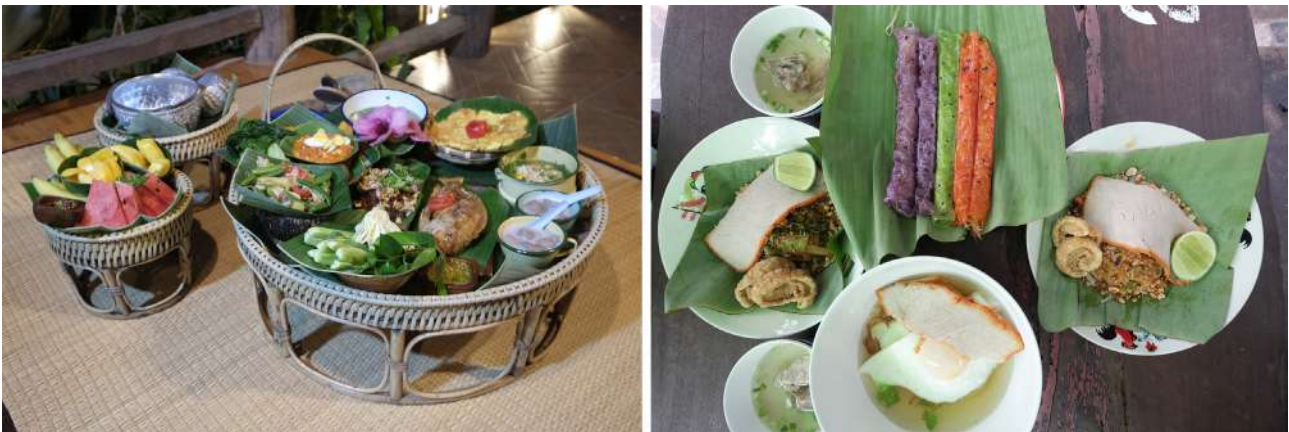
หมายเหตุ บันทึกภาพถ่ายเมื่อวันที่ 20 มีนาคม พ.ศ. 2567

ประเด็นที่ 2 การเชื่อมต่อทางจิตวิญญาณกับธรรมชาติ ชุมชนบ้านนาต้นจั่นส่งเสริมการเชื่อมต่อทางจิตวิญญาณระหว่างมนุษย์กับธรรมชาติผ่านการใช้พื้นที่ทำกินและธรรมชาติรอบตัว เพื่อสร้างความสมดุลและความกลมกลืนระหว่างคนกับสิ่งแวดล้อม กิจกรรมที่สนับสนุนความสัมพันธ์นี้ เช่น การเดินป่า การเก็บสมุนไพร และการทำสมาธิในธรรมชาติ ช่วยสร้างความรู้สึกลงบ ลดความเครียด และส่งเสริมสุขภาพจิต การเชื่อมโยงนี้ยังช่วยพัฒนาบุคลิกภาพ ความมั่นใจ และความรู้สึกเป็นส่วนหนึ่งของโลกที่กว้างใหญ่ ทำให้คนในชุมชนมีชีวิตที่สมดุลและมีพลังในการดำเนินชีวิตประจำวัน แนวคิดนี้ไม่เพียงช่วยให้คนใกล้ชิดกับธรรมชาติ แต่ยังส่งเสริมวิถีชีวิตที่ยั่งยืนและสุขภาวะที่ดีในระยะยาว