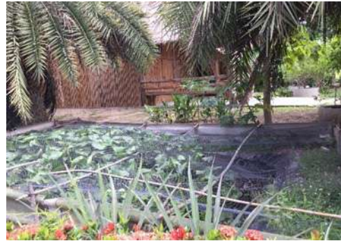
ภาพที่ 1 อาคารเรียนรู้ (ซ้าย) และป่อสาธิตการเลี้ยงกบ (ขวา)

ตัวอย่างกิจกรรมการท่องเที่ยว การเรียนรู้ และเส้นทาง การท่องเที่ยวโครงการศูนย์ศึกษาการพัฒนาห้วยทราย อันเนื่องมาจากพระราชดำริ ดั่งภาพที่ 2