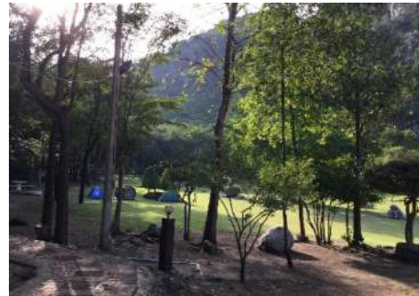
ภาพที่ 4 อาคารศูนย์บริการนักท่องเที่ยว (ซ้าย) และจุดกางเต็นท์พักแรม (ขวา)

ดังภาพที่ 4 และตัวอย่างกิจกรรมการท่องเที่ยว การเรียนรู้ และเส้นทางท่องเที่ยวโครงการซึ่งห้วมันตามพระราชดำริ ดังภาพที่ 5