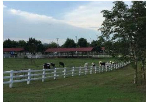
ภาพที่ 5 จุดชมวิวและถ่ายภาพ (ซ้าย) และฟาร์มวัว (ขวา)

2. ผลการเชื่อมโยงและเสนอเส้นทางท่องเที่ยวเพื่อการ เรียนรู้อย่างสร้างสรรค์ในโครงการอันเนื่องมาจากพระราชดำริ ในจังหวัดเพชรบุรี พบว่า สามารถเชื่อมโยงเส้นทางท่องเที่ยว ได้ 2 เส้นทาง คือ