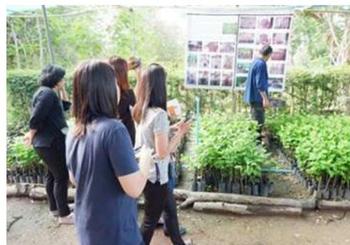
ภาพที่ 2 การสาธิตการทำถ่านชีวภาพ (ซ้าย) และการสาธิตแปลงเพาะปลูกพืช (ขวา)