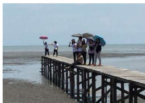
ภาพที่ 3 บริเวณอาคารด้านหน้าโครงการ (ซ้าย) และปลายเส้นทางเดินชมป่าชายเลน (ขวา)