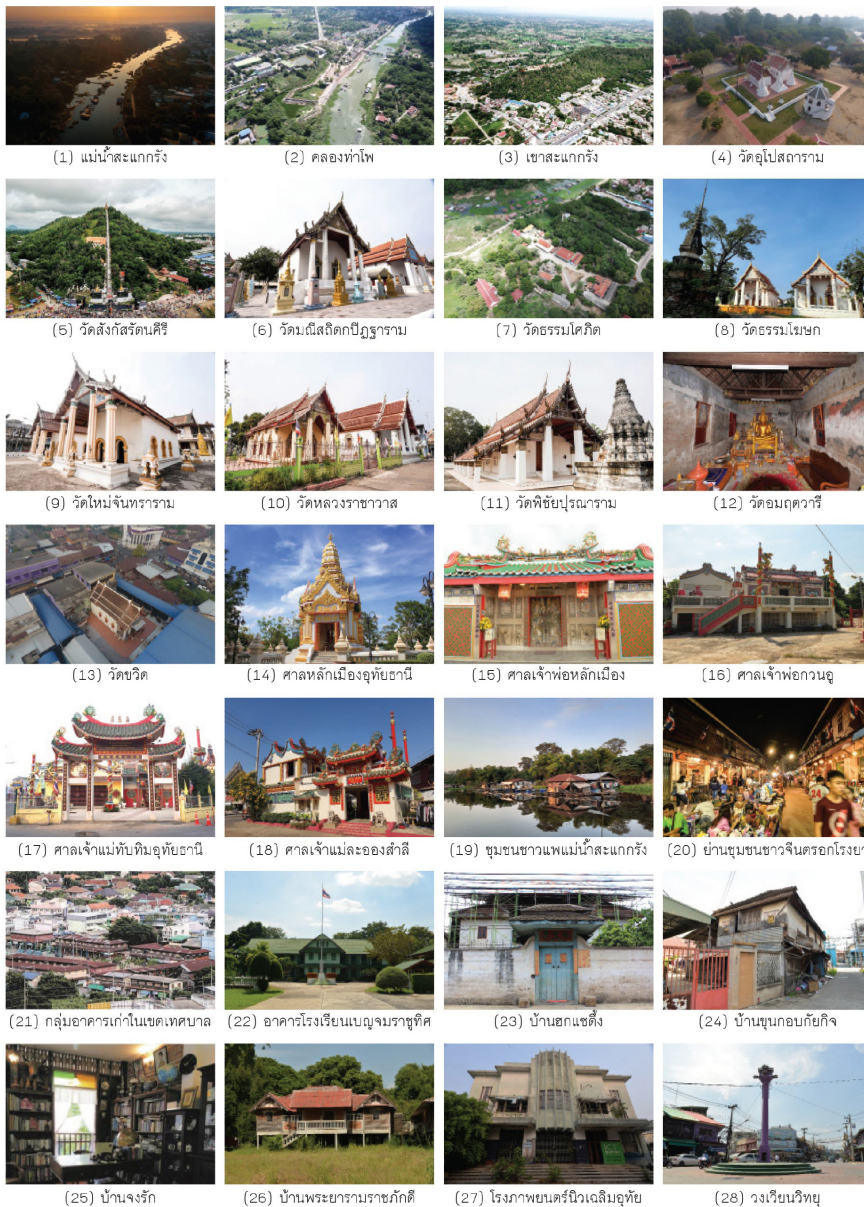
ภาพที่ 2 องค์กรประกอบของเมืองเก่า (ที่มา : Kreangkrai Kirdsiri)

ราษฎร์จำนงโคง” ตามชื่อหม่องโคง ชาวพม่า ชาวอุทัยธานี นิยมเรียกว่า “วัดโคง” ต่อมาในปี พ.ศ. 2482 จึงได้เปลี่ยนชื่อเป็น “วัดธรรมโศภิต” (8) “วัดธรรมโฆษก” เดิมชื่อ “วัดโรงโค” สร้างในสมัยรัตนโกสินทร์ตอนต้น เมื่อปี พ.ศ. 2325 มีประวัติศาสตร์ว่าเคยเป็นสถานที่ประกอบพิธีกรรมสำคัญของเมืองอุทัยธานี ผังพุทธาวาสมีวิหารวางตัวอยู่กับอุโบสถ หน้าวัดมีเจดีย์รายย่อมุมไม้สิบสอง และเจดีย์ทรงปราสาท ยอดปรางค์ ศิลปะรัตนโกสินทร์ (9) “วัดใหม่จันทาราม” เดิมเป็นวัดร้าง ต่อมาได้รับการปฏิสังขรณ์ ผังพุทธาวาสมีวิหารวางตัวอยู่กับอุโบสถ ลักษณะเป็นสถาปัตยกรรมไทย ประเพณี ตกแต่งด้วยศิลปะแบบไทย จีน และตะวันตก