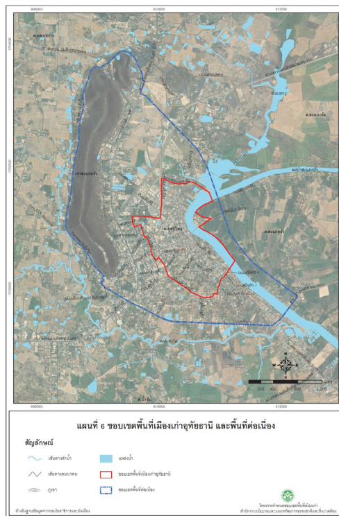
ภาพที่ 4 แผนที่แสดงขอบเขตพื้นที่เมืองเก่าอุทัยธานี และพื้นที่ต่อเนื่อง (Kirdsiri et al., 2021: 55)