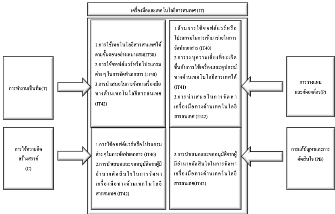
รูปที่ 2 แผนภาพแสดงการใช้เทคโนโลยีสารสนเทศที่จำเป็นต่อสมรรถนะการทำงานของ บริษัท อุตสาหกรรมเครื่องหอมไทย-จีน จำกัด

สมมติฐานที่ได้จากงานวิจัยนี้ ผู้วิจัยได้สร้างแผนภาพเพื่อที่จะให้เห็นว่าการใช้เทคโนโลยีสารสนเทศได้บ้างที่มีอิทธิพลต่อสมรรถนะในการทำงานด้านการทำงานเป็นทีม การวางแผนและจัดองค์กร การใช้ความคิดสร้างสรรค์ การแก้ปัญหาและการตัดสินใจ ดังแสดงไว้ในรูปที่ 2