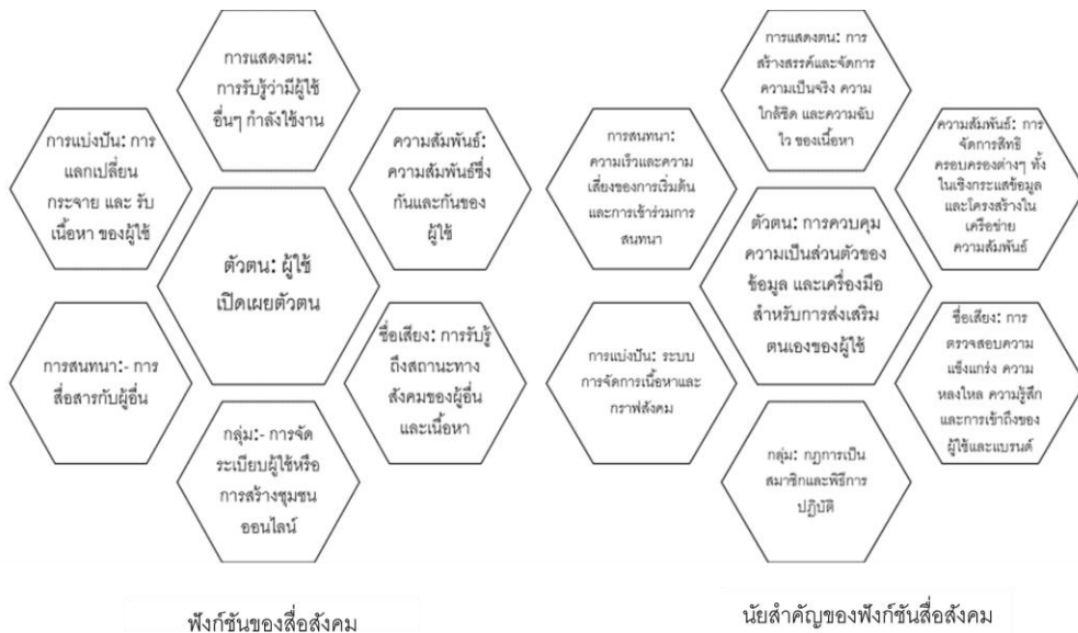
รูปที่ 1 ฟังก์ชันของสื่อสังคมและนัยสำคัญของฟังก์ชันสื่อสังคม (Kietzmann, Hermkens, McCarthy, & Silvestre, 2011)

จากรูปที่ 1 แสดงหน่วยการทำงานของสื่อสังคมจำนวน 7 หน่วย คือ ตัวตน การสนทนา การแบ่งปัน การแสดงตัวตน ความสัมพันธ์ ชื่อเสียง และกลุ่ม แต่ละหน่วยจะทำให้สามารถแกะรอยและตรวจสอบมุมมองเฉพาะของผู้ใช้ และนัยต่างๆ หน่วยการเหล่านี้เป็นกรอบแนวคิดที่จะช่วยให้เข้าใจถึงความแตกต่างของระดับความสามารถในการจัดโครงสร้างสื่อสังคมได้