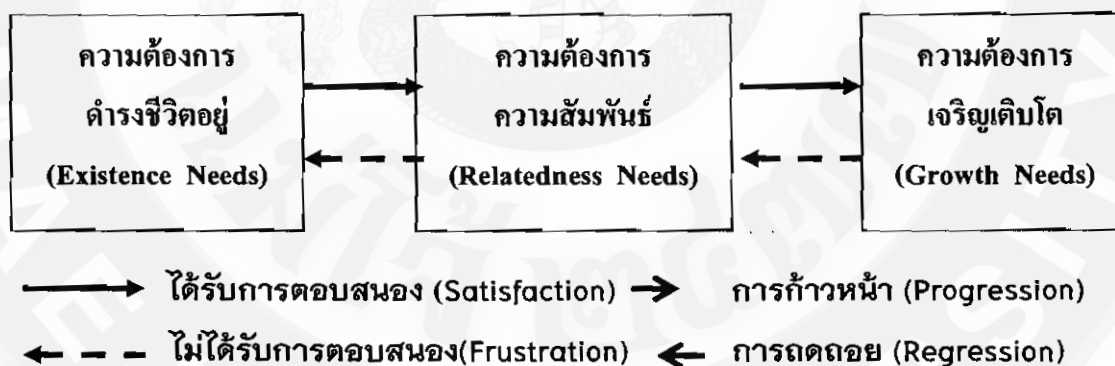
ภาพ 2 แสดงระดับความต้องการของมนุษย์ตามแนวคิดของเคลย์ตัน

เคลย์ตัน แอลเดอร์เฟอร์ (Claton Elderfer) แห่งมหาวิทยาลัยเยล ได้รับปรับปรุงลำดับความต้องการตามแนวคิดของมาสโลว์เสียใหม่ เหลือความต้องการเพียง 3 ระดับ คือ