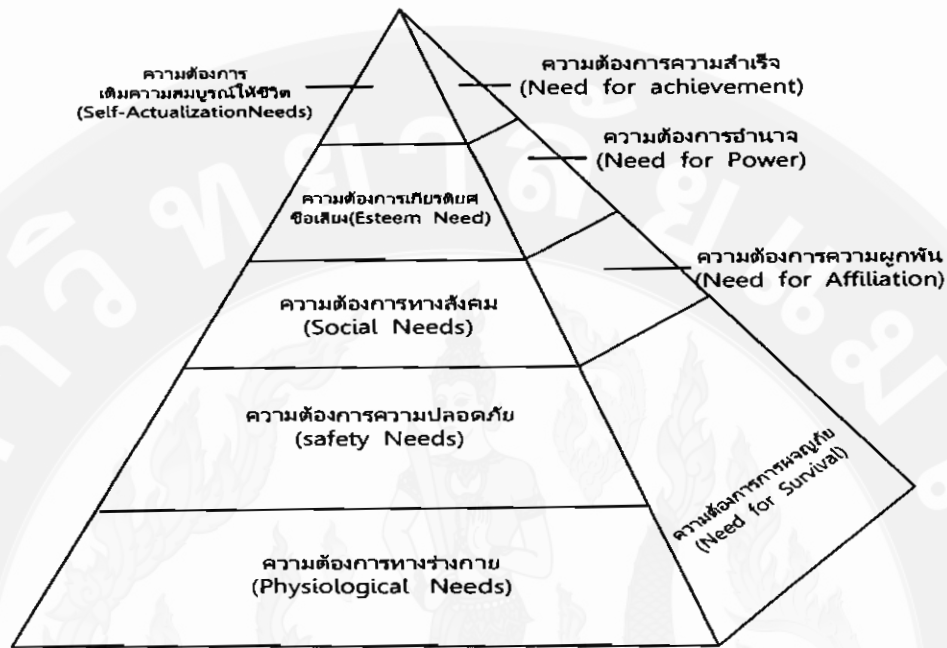
ภาพ 3 แสดงระดับทฤษฎีความต้องการจากการเรียนรู้ตามแนวคิดของเดวิด ซี แมคเคิลแลนด์ ที่มา: เดวิด ซี แมคเคิลแลนด์ (1998: ระบบออนไลน์)

1.4.1 ความต้องการความสำเร็จ (Need for Achievement) เป็นความต้องการที่จะทำงานได้ดีขึ้น มีประสิทธิภาพมากขึ้น มีมาตรฐานสูงขึ้นในชีวิต ซึ่งผู้ที่มีความต้องการความสำเร็จสูงนั้น จะมีลักษณะพฤติกรรม ดังนี้