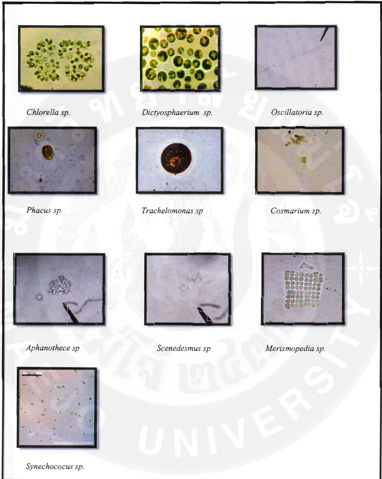
ภาพที่ ๑ ชนิดแพลงก์ตอนที่พบมากในบ่อทั้ง 3 หน่วยการทดลอง