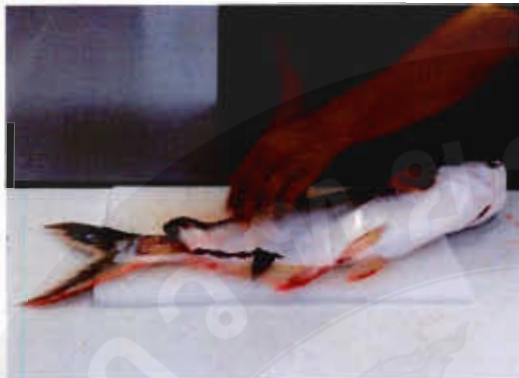
แล่นเนื้อ