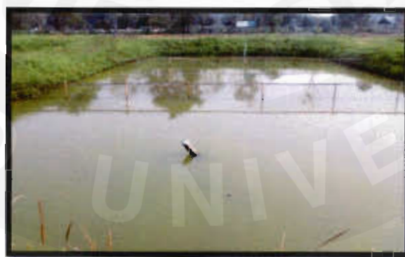
ภาพที่ ข บ่อของการทดลองที่ 2 ใส่ปุ๋ยซีไค่ 50% ให้ อาหารเม็ดจม 1.5% / น้ำหนักตัว