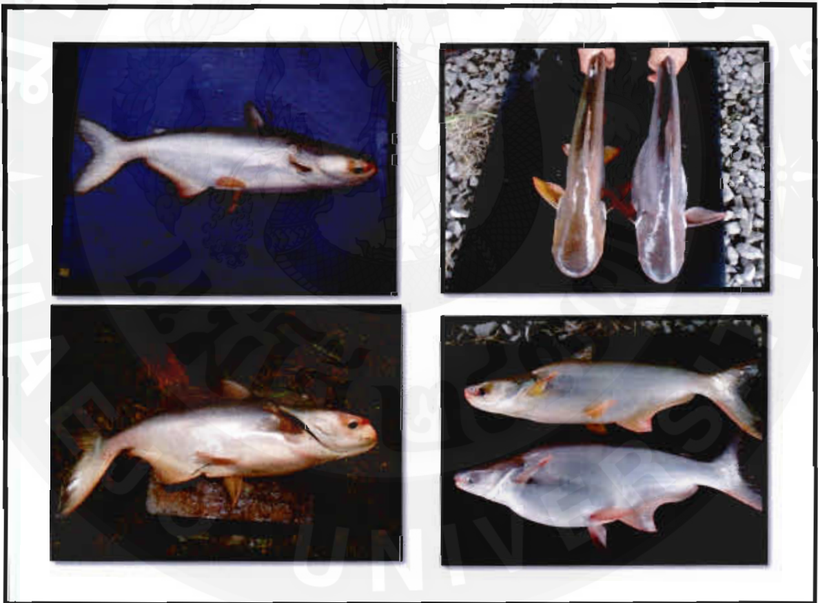
ภาพที่ ง การชั่งน้ำหนักปลาบึก และปลาอุกผสมตัวผู้และตัวเมีย