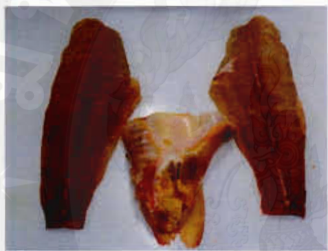
เนื้อปลาบีก