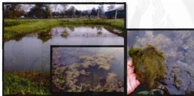
ภาพที่ ก บ่อทดลองที่ 1. ใส่ปุ๋ยซีไค่ 100% อาหารเม็ดจม 0.75%/น้ำหนักตัวและพบสาหร่ายไค