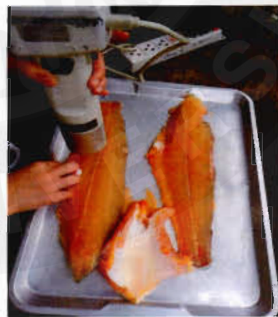
ภาพที่ ๑ การชำแหละเนื้อเพื่อศึกษาคุณภาพเนื้อการวัดสีเนื้อปลาและค่า pH