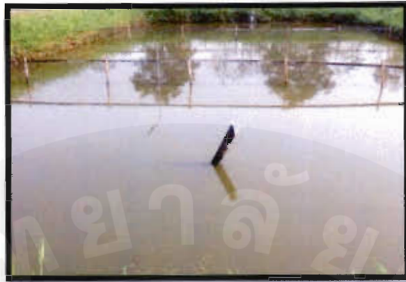
ภาพที่ ค บ่อของการทดลองที่ 3 ให้อาหารอย่างเดียว 3 % ของน้ำหนักตัว