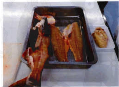
เนื้อปลาลูกผสม