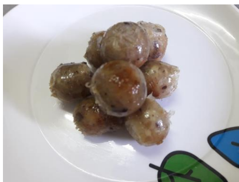
ภาพที่ ข-24 ไส้กรอกไก่เสริมข้าวไรซ์เบอร์รี่ (ฮาลาล)