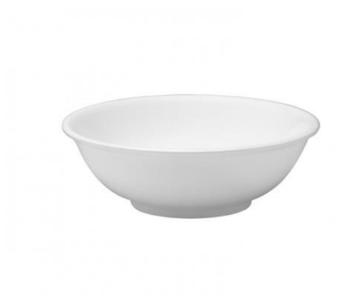
ภาพที่ ข-3 ชามขนาด 7.5 นิ้ว