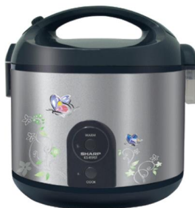
ภาพที่ ข-2 หม้อหุงข้าวไฟฟ้า