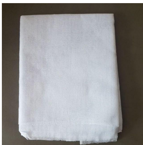
ภาพที่ ข-11 ผ้าขาวบาง