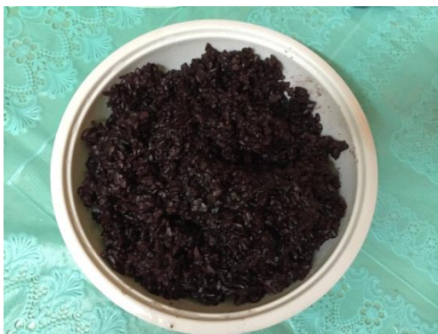
ภาพที่ ข- 18 ข้าวไรซ์เบอร์รี่หุงสุก