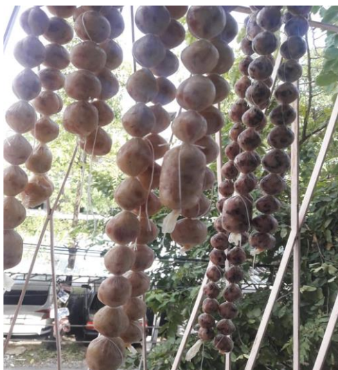
ภาพที่ ข-21 นำไปตากแดด