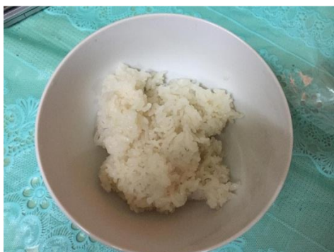
ภาพที่ ข-17 ข้าวเหนียวหุงสุก