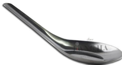
ภาพที่ ข-9 ช้อน