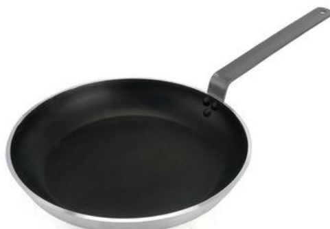
ภาพที่ ข-13 กระทะเทฟลอน