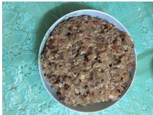
ภาพที่ ข-20 นำส่วนผสมทั้งหมดคลุกเคล้ารวมกัน