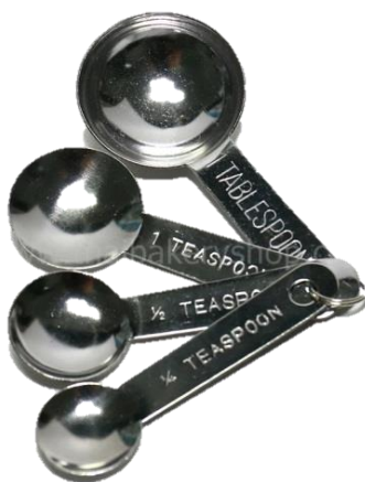
ภาพที่ ข-5 ช้อนตวง