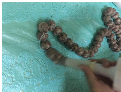
ภาพที่ ข-21 บรรจุในไส้คอลลาเจน เส้นผ่านศูนย์กลางประมาณ 2 เซนติเมตร