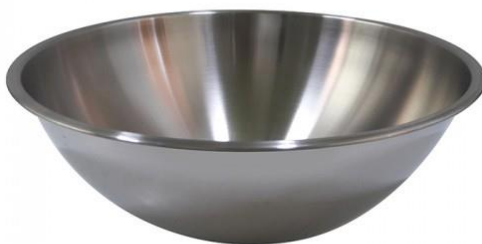
ภาพที่ ข-8 อ่างผสมขนาด 12 นิ้ว