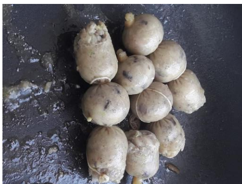
ภาพที่ ข-23 ทอดไส้กรอกอีสานไก่เสริมข้าวไรซ์เบอร์รี่ในกระทะ