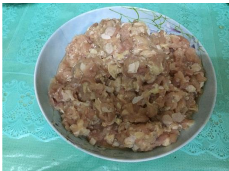
ภาพที่ ข-16 ล้างเนื้อไก่และสับเนื้อให้ละเอียด