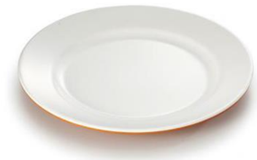
ภาพที่ ข-4 จาน 6 นิ้ว