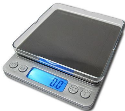
ภาพที่ ข-1 เครื่องชั่งไฟฟ้า

ตัวอย่างอุปกรณ์การทำให้กรอกอีสานไกเสริมข้าวไรซ์เบอร์รี่