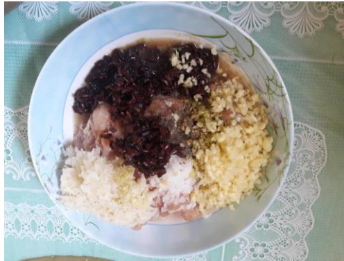
ภาพที่ ข-19 สับรากผักชี กระเทียมให้ละเอียด