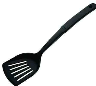
ภาพที่ ข-14 ตะหลิวเทฟลอน