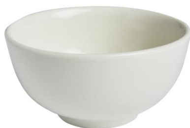
ภาพที่ ข-10 ชามเล็กขนาด 3 นิ้ว