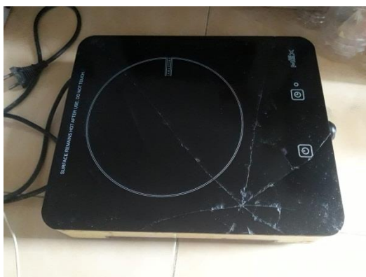
ภาพที่ ข-15 กระทะไฟฟ้า