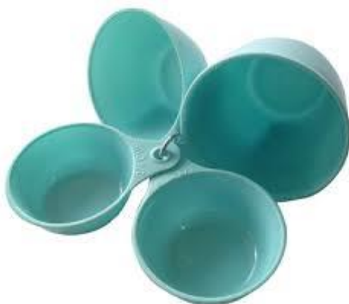
ภาพที่ ข-6 ถ้วยตวง