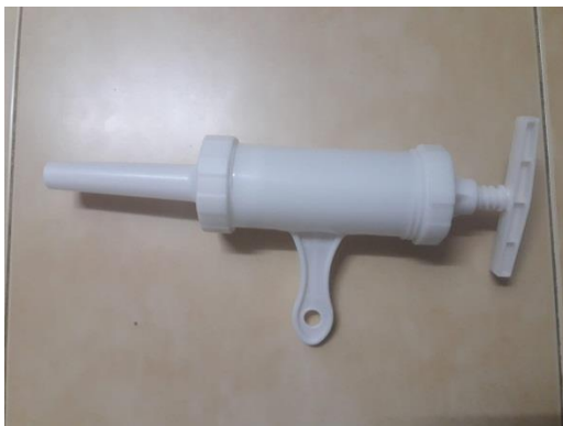
ภาพที่ ข-7 เครื่องมือการทำไส้กรอก