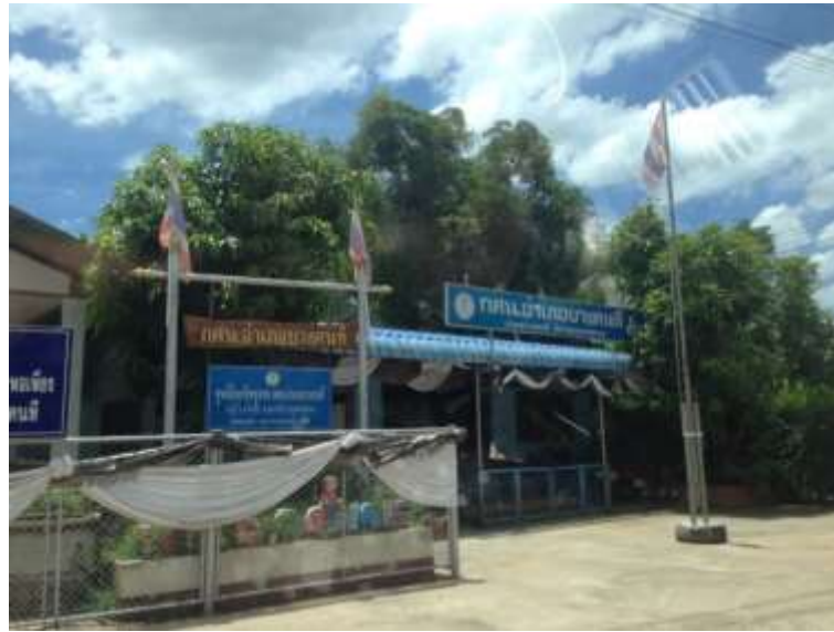
ภาพที่ ก.1 สำนักงานการศึกษาออกโรงเรียน อำเภอบางคนที จังหวัดสมุทรสงคราม หน่วยงานสนับสนุนการอบรมถ่ายทอดองค์ความรู้