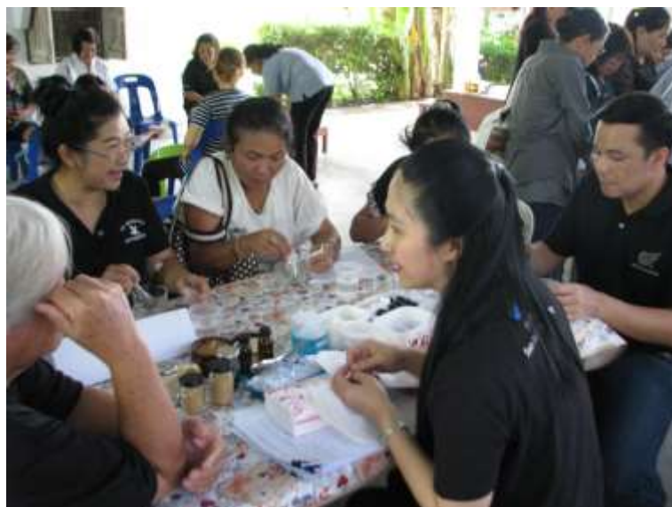
ภาพที่ ก.5 บรรยายภาคการอบรมทำเจลนวดผิวกายเพิ่มความขาว ที่มีส่วนผสมของดาหลาและวิตามิน บี3