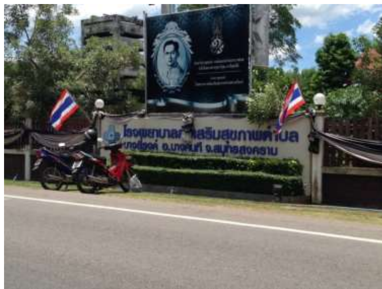
ภาพที่ ก.2 โรงพยาบาลส่งเสริมสุขภาพตำบล ตำบลบางยี่รงค์ อำเภอบางคนที จังหวัดสมุทรสงคราม สถานที่อบรมถ่ายทอดองค์ความรู้