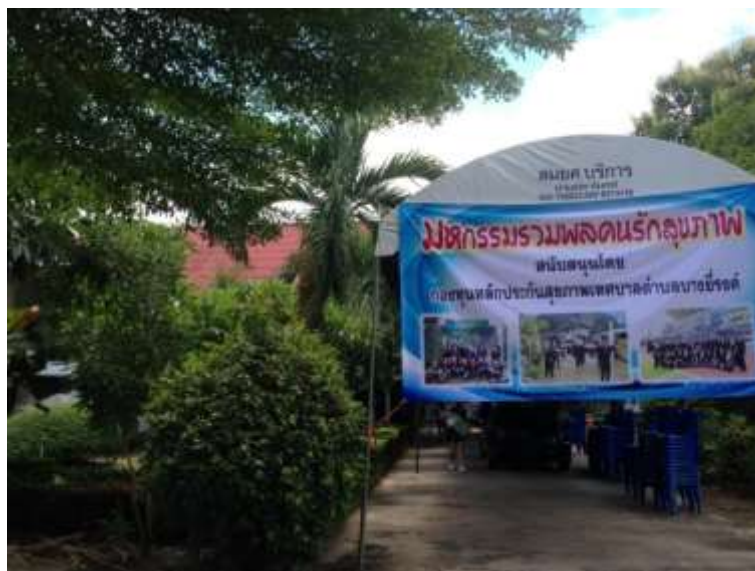
ภาพที่ ก.3 งานมหกรรมรวมพลคนรักสุขภาพ โรงพยาบาลส่งเสริมสุขภาพตำบล ตำบลบางยี่รงค์ อำเภอบางคนที จังหวัดสมุทรสงคราม สถานที่อบรมถ่ายทอดองค์ความรู้