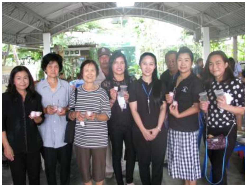
ภาพที่ ก.6 ผู้เข้ารับอบรมการทำเจลนวดผิวกายเพิ่มความขาว ที่มีส่วนผสมของดาหลาและวิตามิน บี3