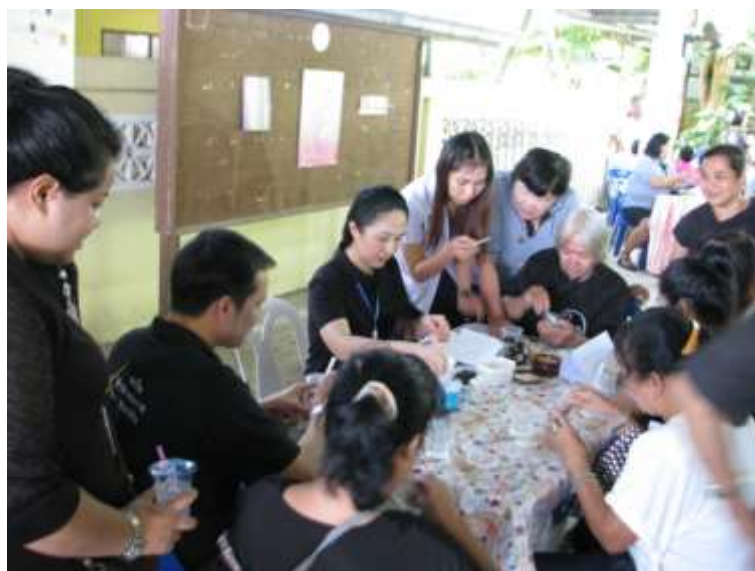
ภาพที่ ก.4 บรรยายการอบรมทำเจลนวดผิวกายเพิ่มความขาว ที่มีส่วนผสมของดาหลาและวิตามิน บี3