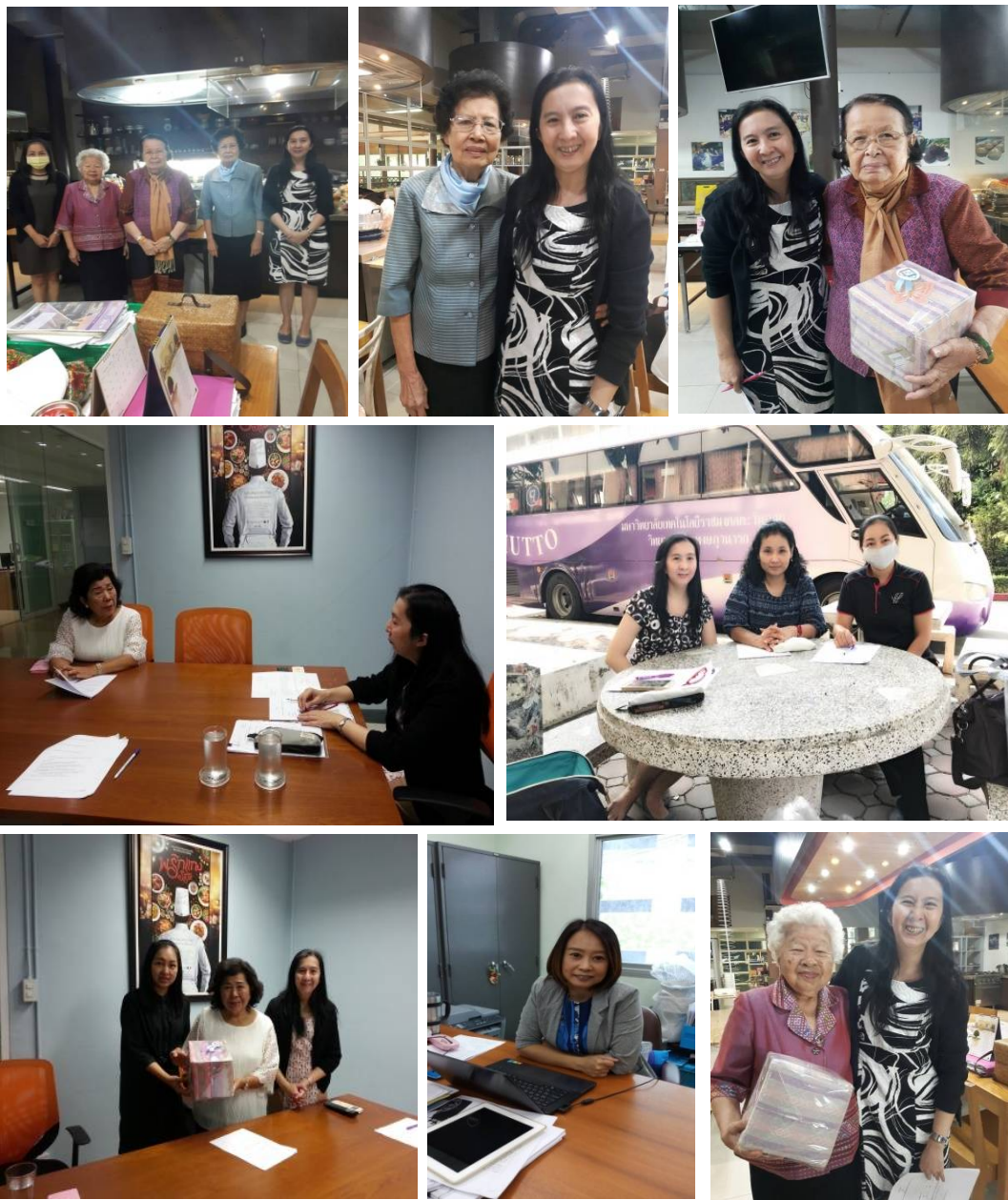
ภาพที่ ค-1 สัมภาษณ์ผู้เชี่ยวชาญ