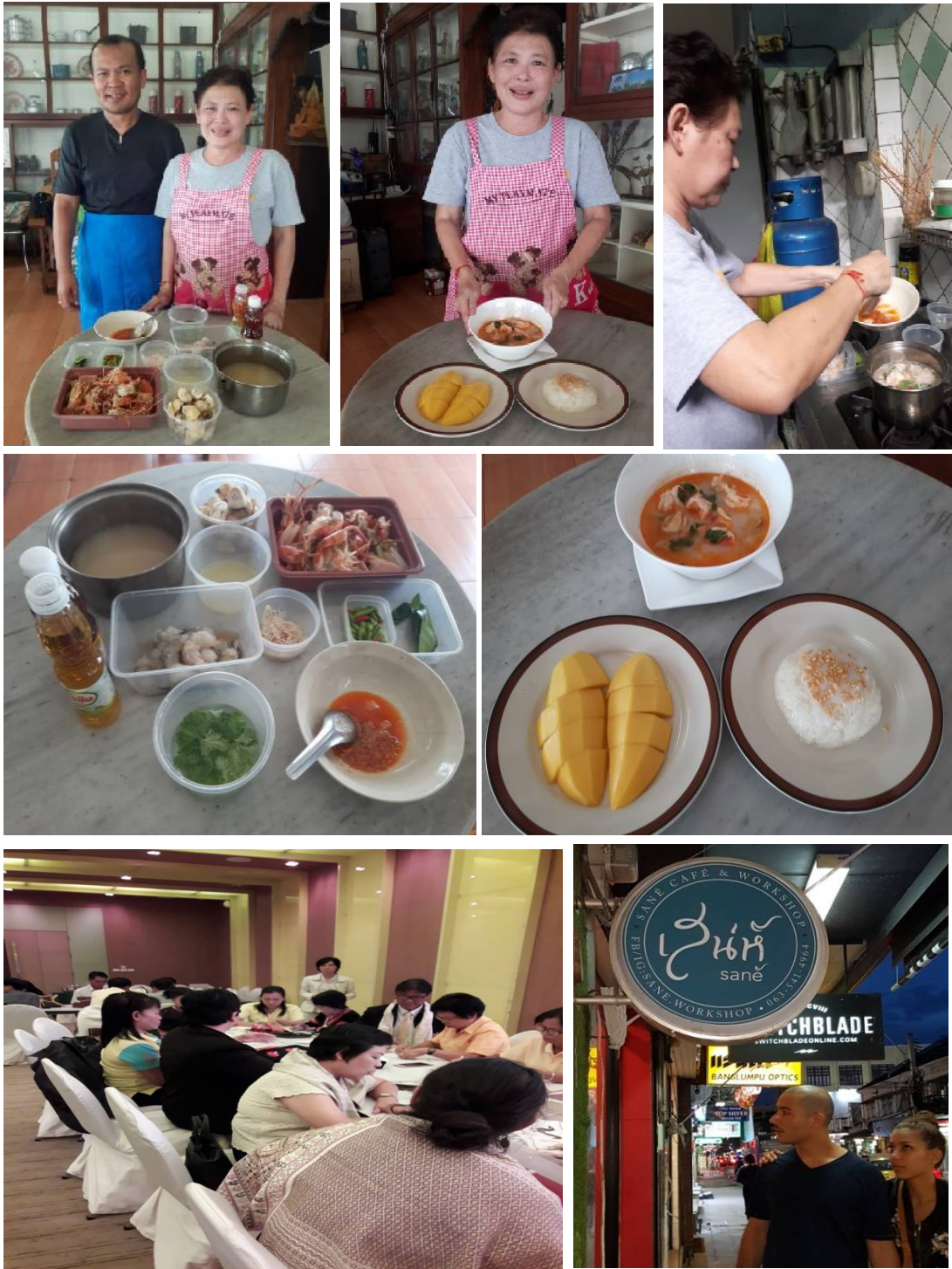
ภาพที่ ค-2 กิจกรรมการเรียนรู้การสอน