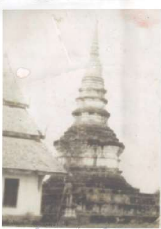
พระธาตุจอมปิง พ.ศ. ๒๕๐๐ ก่อนบูรณะบริเวณวัดสุภานุรักษ์