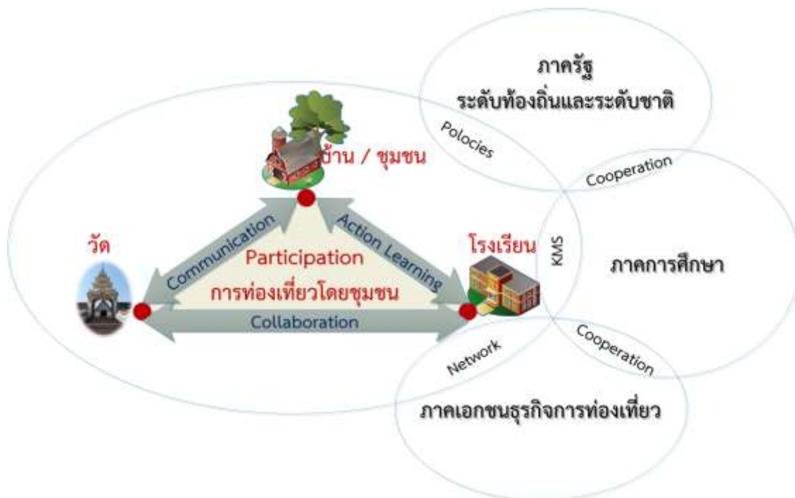
ภาพที่ 4.1 แบบจำลองแนวทางการพัฒนาวัดพระธาตุจอมปิงให้เป็นแหล่งท่องเที่ยวเชิงวัฒนธรรม

จากภาพที่ 4.1 สามารถสรุปประเด็นสำคัญที่ต้องเร่งปรับปรุง ประกอบไปด้วย