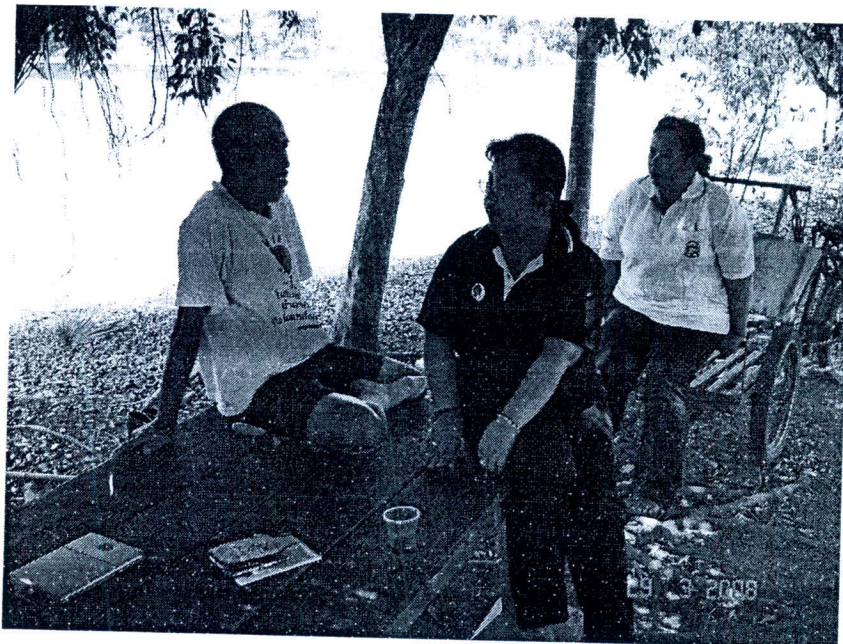
ภาพที่ 2.5 การเก็บข้อมูลด้วยการสนทนากลุ่ม