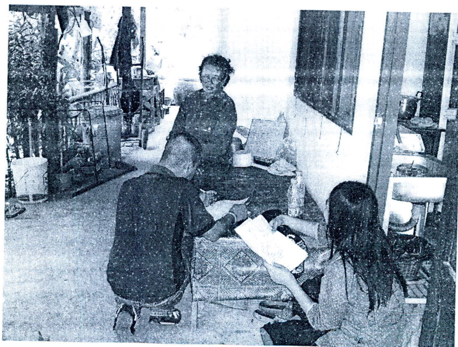
ภาพที่ 2.3 การเก็บข้อมูลด้วยแบบสอบถามและการสัมภาษณ์เชิงลึก

การเก็บข้อมูลเป็นไปตามเครื่องมือในการเก็บรวบรวมข้อมูล โดยในการเก็บข้อมูลด้วย แบบสอบถาม ได้อาศัยวิธีการสุ่มตัวอย่างที่เป็นระบบกับครัวเรือนของแต่ละชุมชน ส่วนการเก็บ ข้อมูลด้วยวิธีการสัมภาษณ์เชิงลึกและการจัดเวทีชุมชนหรือการสนทนากลุ่มใช้วิธีการแบบเจาะจง กลุ่มตัวอย่างเช่น พระสงฆ์ ปราชญ์ชาวบ้าน เป็นต้น