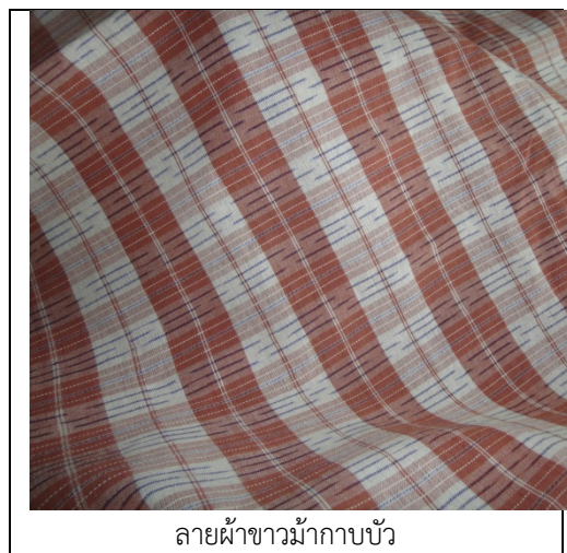
รูปที่ 4.61 ผลิตภัณฑ์ต้นแบบ ผ้าขาม้าลายใหม่ ครั้งที่ 1

การให้คำแนะนำปรึกษาในพื้นที่ ครั้งที่ 5 เป็นการติดตามผลการทอผ้าขาม้าลายกาบบัวจากสี่ธรรมชาติ พบว่า ผืนผ้ามีความสวยงาม ลายผ้าสามารถแปรรูปผลิตภัณฑ์ได้หลากหลายรูปแบบ แต่ยังมีปัญหาเกี่ยวกับหน้าผ้าที่ยังไม่เหมาะสม คือ หน้ากว้าง 85 เซนติเมตร ดังนั้น จึงแนะนำให้จัดหาพืมน้ำกว้าง 100 เซนติเมตรมาใช้ในการผลิตผ้าผืน นอกจากนี้หากมีสมาชิกที่มีทักษะในการเก็บขิดควรมีการแทรกลายขิดสลับเล็กน้อยจะทำให้ผ้ามีมูลค่าสูงขึ้น