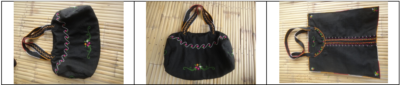
รูปที่ 4.54 การพัฒนาผลิตภัณฑ์ของกลุ่มผู้ผลิต หลังการติดตามผลและแนะนำในการแก้ไขปรับปรุงแล้ว

การให้คำแนะนำปรึกษาในพื้นที่ ครั้งที่ 6 เป็นการติดตามผลการแปรรูปผลิตภัณฑ์ เพื่อสร้างรูปแบบกระเป๋าให้มีความหลากหลายรูปแบบยิ่งขึ้น พบว่า กลุ่มผู้ผลิตได้ผลิตกระเป๋ารูปแบบใหม่เพิ่มเติม ซึ่งเป็นการปฏิบัติตามแนวคิดของผู้ผลิต ในการนี้ได้มีการแนะนำเพิ่มเติมเกี่ยวกับการตัดเย็บเพื่อให้กระเป๋ามีโครงสร้างที่แข็งแรง ส่วนรูปแบบการปกอาจมีการสร้างความหลากหลายตามความเหมาะสม ทั้งนี้ควรมีการเก็บข้อมูลจากลูกค้าเพื่อนำมาใช้ในการพัฒนาด้วย