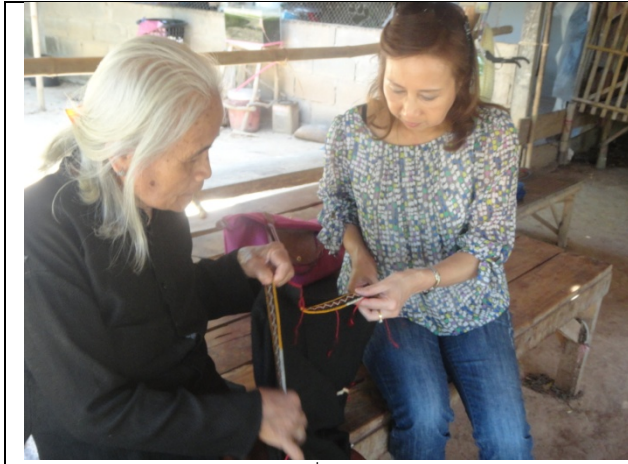
การให้คำแนะนำปรึกษาเกี่ยวกับการแปรรูปผลิตภัณฑ์

กลุ่มทอผ้าไหม (เสื้อเก็บ) บ้านเมืองน้อย เลือกลงมาทดลองผลิตต้นแบบ คือ แบบกระเป่าถือสตรี จากการติดตามในพื้นที่พบว่า กลุ่มผู้ผลิตกำลังดำเนินการอยู่ในขั้นตอนของการทอผ้าไหมและเตรียมลูกมะเกลือสำหรับนำมาย้อม ในครั้งนี้ได้แนะนำถึงการเลือกสายปักที่เป็นเอกลักษณ์มาใช้ในการปักลงบนกระเป่า โดยเน้นให้เลือกสายที่มีความหมาย เช่น ลายตะขาบ มาปักตกแต่ง