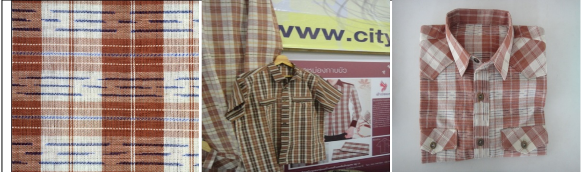
รูปที่ 4.62 การแปรรูปผลิตภัณฑ์จากผ้าตาหม่องลายกาบบัว เป็นเสื้อเชิ้ตสำหรับบุรุษ

การให้คำแนะนำปรึกษาในพื้นที่ ครั้งที่ 7 เป็นการลงพื้นที่เพื่อนำผ้าที่พัฒนาใหม่ไปทดลองแปรรูปเป็นเสื้อบุรุษ ซึ่งการแปรรูปได้มีการออกแบบจัดวางลายเสื้อให้น่าสนใจยิ่งขึ้น ในครั้งนี้ทางกลุ่มจะได้นำไปพัฒนาเป็นสินค้าต่อไป