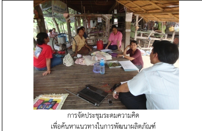
การจัดประชุมระดมความคิด เพื่อค้นหาแนวทางในการพัฒนาผลิตภัณฑ์