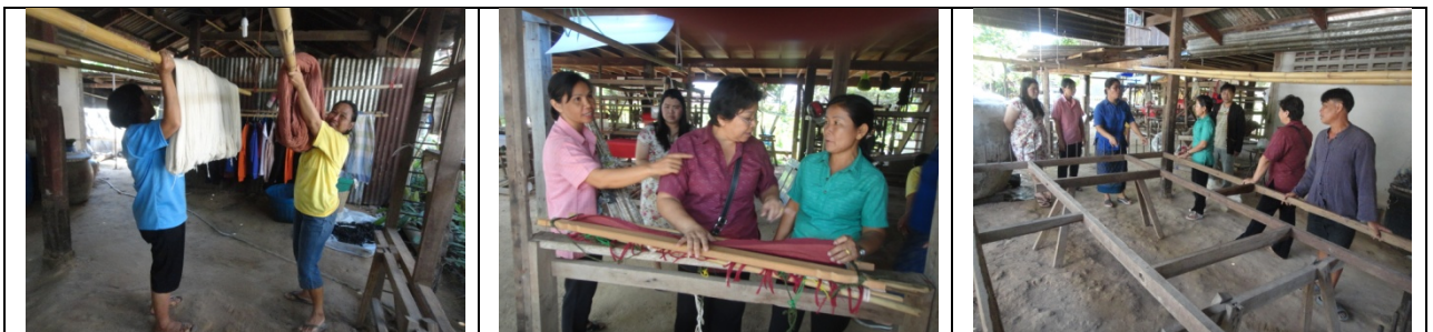
รูปที่ 4.58 การเตรียมเส้นฝ้ายเพื่อฝึกปฏิบัติการทอผ้าลายกบับ

การให้คำแนะนำปรึกษาในพื้นที่ ครั้งที่ 3 เป็นการฝึกปฏิบัติการ ทอผ้ากบับ ในการฝึกภาคปฏิบัติครั้งนี้ได้เชิญ ประธานกลุ่มทอผ้ากบับบ้านคำขวาง อำเภอวารินชำราบ จังหวัดอุบลราชธานีพร้อมสมาชิกกลุ่มจำนวน 4 คนมาช่วยในการฝึกภาคปฏิบัตินับตั้งแต่ขั้นตอนการสีบิ้นหูกจนถึงขั้นตอนการทอ เนื่องจากกรรมวิธีการทอผ้ากบับไม่สามารถใช้ที่กระตุกตั้งที่เคยใช้ได้ ซึ่งต้องใช้ที่พื้นเมืองในการทอ หลังการฝึกภาคปฏิบัติได้มีการติดตามให้คำแนะนำซ้ำอีก 2 ครั้งจึงสามารถทอผ้ากบับได้