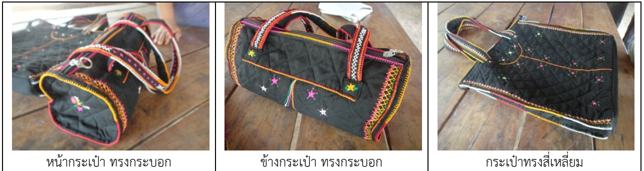
รูปที่ 4.52 ผลิตภัณฑ์ต้นแบบที่ได้รับการปรับปรุงแล้ว

กำหนดในแบบ ทั้งนี้ปัญหาดังกล่าวเกิดจากความไม่เข้าใจในแบบของช่างปัก ส่งผลให้ลายปักบนกระเป๋าไม่สะท้อนให้เห็นถึงแบบเสื้อที่มีอัตลักษณ์เฉพาะ ดังนั้นจึงได้มีการให้คำแนะนำในการผลิตซ้ำอีกครั้ง