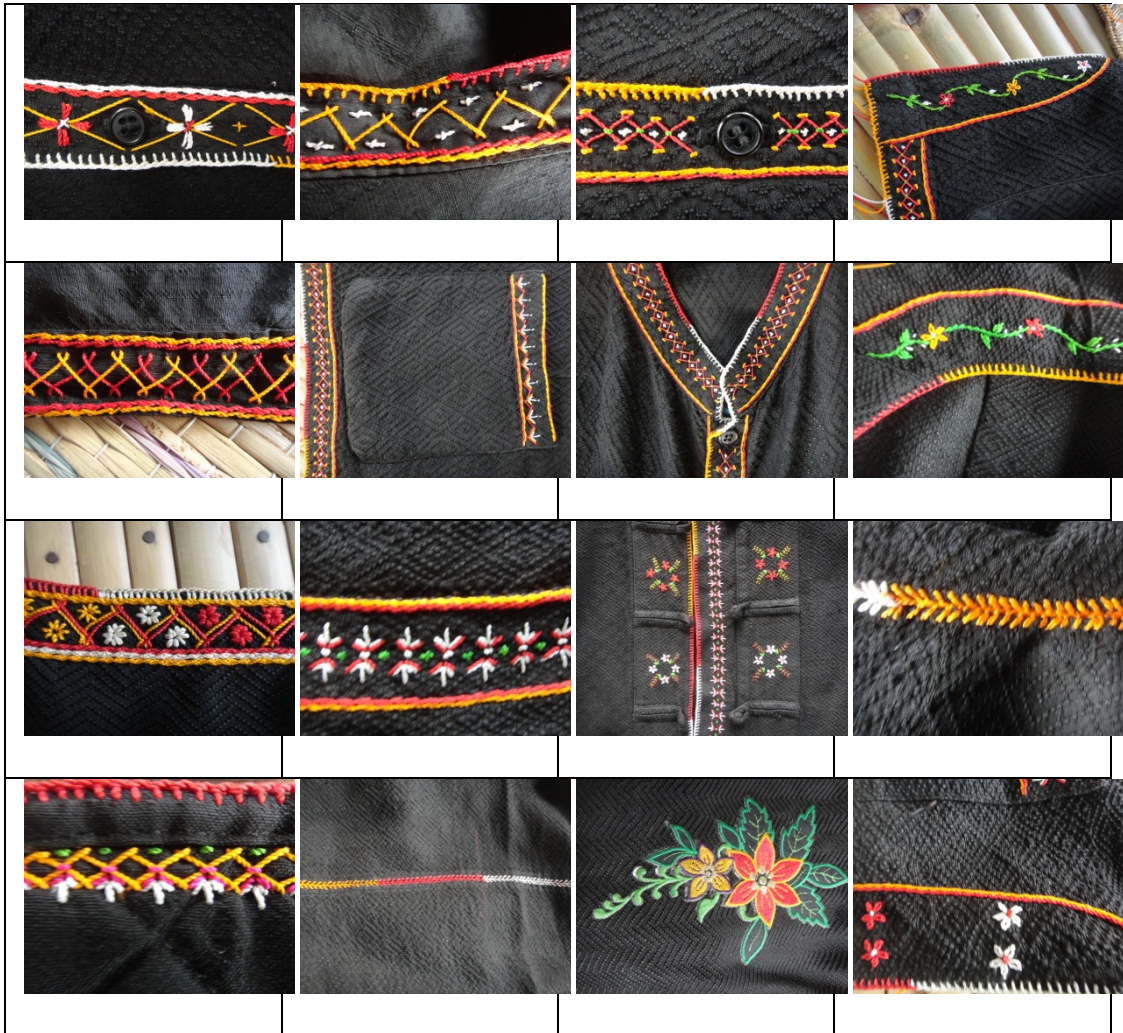
รูปที่ 4.51 ลายปักแนวที่กลุ่มผู้ผลิตถนัดและผลิตมานาน

การให้คำแนะนำปรึกษาในพื้นที่ ครั้งที่ 3 เป็นการติดตามผลการกระเป่า พบว่า การปักไม่ถูกต้องตามแบบที่กำหนดใน 2 ประการ คือ 1) วางตำแหน่งลายปักผิดตำแหน่ง 2) ไม่ใช่ลายตามที่