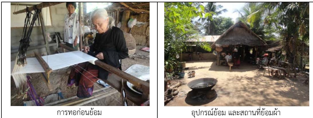
การทอก่อนย้อม

เป็นกลุ่มผู้ผลิตผ้าไหมย้อมมะเกลือ วิสาหกิจชุมชนกลุ่มทอผ้าไหม(เสื่อเก็บ) บ้านเมืองน้อย บ้านเลขที่ 91 หมู่ 6 บ้านเมืองน้อย ตำบลเมืองหลวง อำเภอห้วยทับทัน จังหวัดศรีสะเกษ ถือเป็นกลุ่มผู้ผลิตที่สืบทอดทักษะฝีมือจากภูมิปัญญาท้องถิ่นมาอย่างยาวนาน ซึ่งมีวิธีการย้อม โดยสังเขป คือ 1) เก็บลูกมะเกลือจากต้นโดยใช้มะเกลือแก่ ( สีเขียวเข้ม ) 2) จัดหาผ้าไหม ประมาณ 1 พับ 3) ต้มมะเกลือด้วยครกกระต๋อง ( ครกมอญ ) แบบใช้คนเหยียบ 2) ย้อมโดยหมักน้ำที่ได้จากการต้มมะเกลือในถังหมัก ซึ่งเป็นถังขนาดใหญ่ ร่วมกับเปลือกไม้ซึ่งเป็นชนิดเดียวกับที่ใช้ย้อมอวนผสมเกลือและน้ำ ใช้เวลา 1 วัน จะได้สีดำ ใช้ครูดักากใหญ่ๆ ขึ้น แขนผ้าทั้งพับลงในถังหมัก 1 คืน 4) ซัก โดยใช้ไม้ทุบกองผ้าที่วางกับพื้นที่สะอาด เพื่อเอาสิ่งสกปรกออก (กาก) และสีส่วนที่เกินออก จากนั้นยกขึ้นตาก โดยไม่ต้องบิด 4) ตาก ใช้คลี่ตากกับพื้น โดยต้องกลับผ้าทุกชั่วโมง ทั้งนี้ในการย้อมผ้าแต่ละผืนต้องย้อม 4 – 5 ครั้ง (ทำซ้ำทุกขบวนการตั้งแต่ ย้อม ซัก ตาก) เมื่อได้ผืนผ้าแล้วจึงนำไปใช้ในการตัดเย็บเป็นเสื่อ แล้วจึงนำไปปักเป็นขั้นตอนสุดท้ายของการผลิตเสื่อเก็บ สำหรับการติดตามเพื่อทดลองพัฒนาผลิตภัณฑ์ในพื้นที่ มีดังนี้