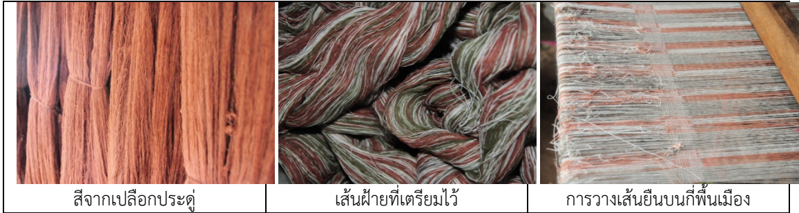
รูปที่ 4.60 เส้นฝ้ายสำหรับทอผ้าขาม้าร่วมกับลายกาบบัว

ได้ฝึกทอผ้ากาบบัวได้หลายเมตร ส่วนการเตรียมเส้นฝ้ายได้มีการย้อมสีไว้แล้ว โดยสีที่ย้อมไว้ เช่น สีแสด จากดอกคำแสด(ภาษาถิ่นเรียกว่า หมากชาตรี) สีแดงออกน้ำตาลจากเปลือกประตู สีนํ้าตาลจากเปลือก กระจับปี่ สีดำจากลูกมะเกลือ และสีโอรสหรือแสดอ่อนจากเปลือกจั่วป่า ทั้งนี้ได้ให้คำแนะนำเกี่ยวกับ วิธีการทอ วิธีการวางลายผ้ากาบบัวสลับกับลายผ้าขาม้า ซึ่งกลุ่มจะได้ทดลองเลือกเส้นฝ้ายที่ย้อมไว้ แล้วมาใช้ในการทอ