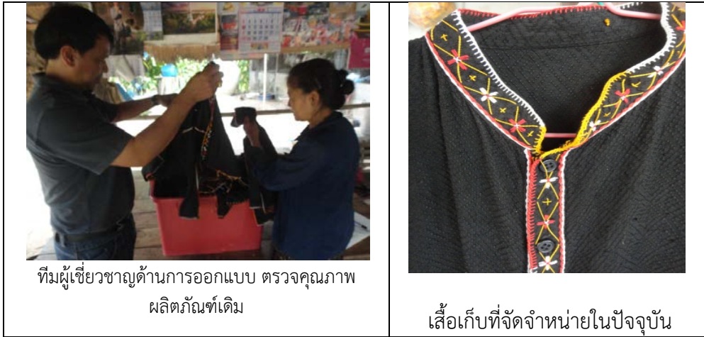
รูปที่ 4.47 การให้คำแนะนำเกี่ยวกับผลิตภัณฑ์เดิม