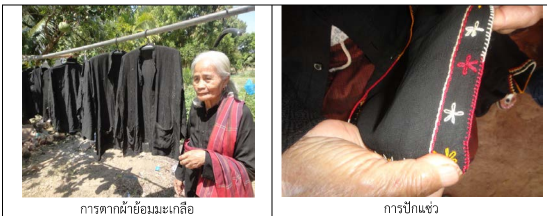
การตากผ้าย้อมมะเกลือ