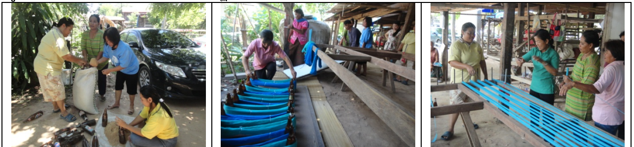
รูปที่ 4.59 การเตรียมเส้นฝ้ายเพื่อฝึกปฏิบัติการทอผ้าลายกบับ (ต่อ)

การให้คำแนะนำปรึกษาในพื้นที่ ครั้งที่ 4 เป็นการติดตามผลการฝึกทอผ้ากบับ และจัดเตรียมเส้นฝ้ายย้อมสีธรรมชาติสำหรับการทอ โดยพบว่า ผู้ผลิตสามารถทอผ้ากบับได้หลายคน โดย