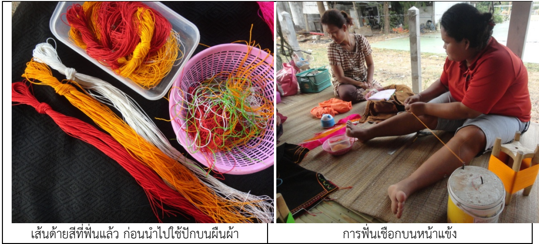
เส้นด้ายสีที่ปั่นแล้ว ก่อนนำไปใช้ปักบนผืนผ้า