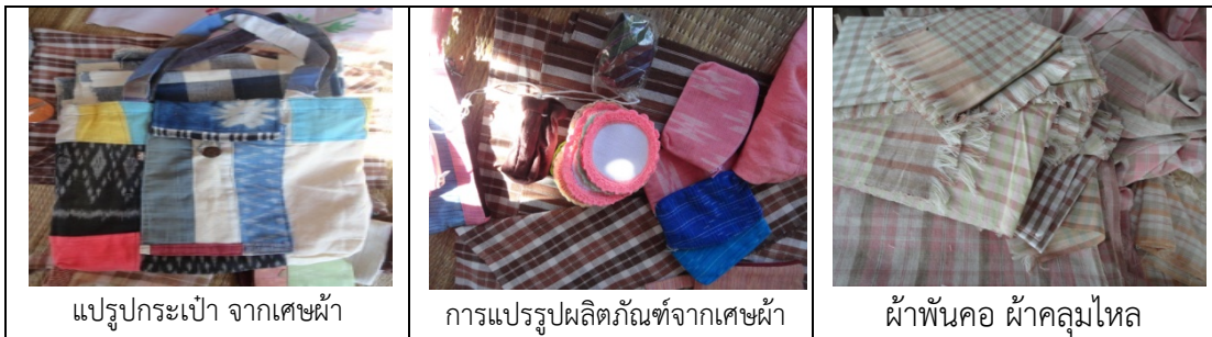
แปรรูปกระเป๋า จากเศษผ้า

การให้คำแนะนำปรึกษาในพื้นที่ ครั้งที่ 1 เป็นการลงพื้นที่เพื่อศึกษาแนวทางในการพัฒนาผลิตภัณฑ์ จากเดิมที่กลุ่มผู้ผลิตเคยผลิตผ้าขาวม้าย้อมสีธรรมชาติ และเคยส่งร่วมคัดสรรผลิตภัณฑ์ จนได้ระดับ 5 ดาวในปี พ.ศ. 2555 ดังนั้นในการแนะนำเบื้องต้น จึงได้แนะนำในการนำผ้าเศษที่มีมากภายในกลุ่มมาใช้ในการแปรรูปเป็นผลิตภัณฑ์ประเภทของใช้ ซึ่งในการติดตามในพื้นที่ พบว่ามีผลิตภัณฑ์จากเศษผ้าหลากหลายชนิดที่สามารถผลิตเพื่อการจำหน่ายเป็นของที่ระลึกได้