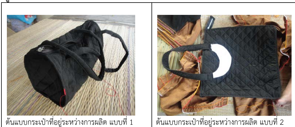
รูปที่ 4.49 การผลิตต้นแบบผลิตภัณฑ์เชิงนวัตกรรมจากผ้าย้อมมะเกลือ ชั้นที่ 1 เป็นกระเป๋าทรงกระบอก ชั้นที่ 2 เป็นกระเป๋าทรงสี่เหลี่ยม