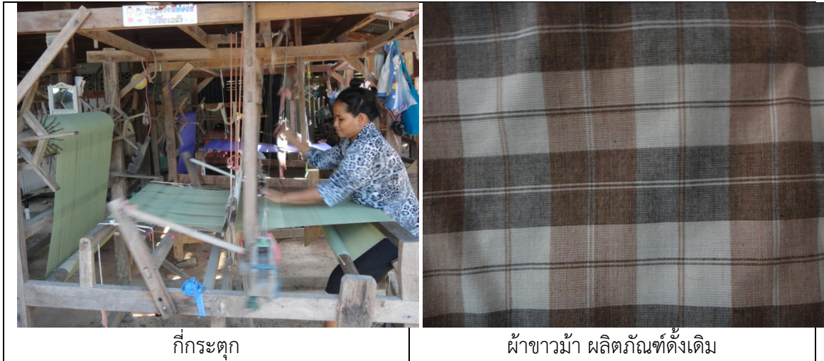
กี่กระตุก