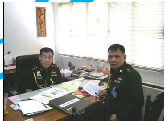
พันเอก กัณตภณ อัครานุรักษ์ ผู้อำนวยการกองยุทธการ กองทัพน้อยที่ 1