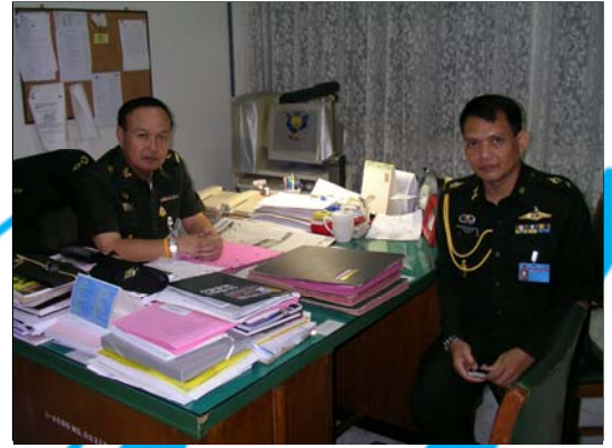
พลตรี บัญชา สิทธิวรยศ รองผู้บัญชาการสถาบันวิชาการทหารบกชั้นสูง