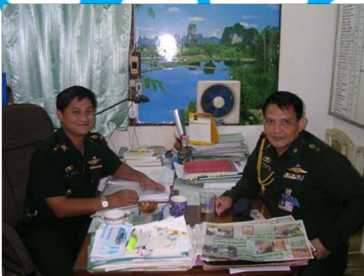
พันโท พรชัย งามสดใส หัวหน้าแผนก กรมสวัสดิการทหารบก