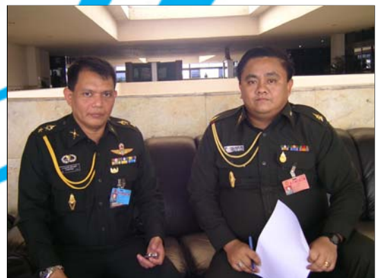
พันตรี อภิชาติ ภิญโญชีพ ประจำสำนักงานเลขานุการกองทัพบก