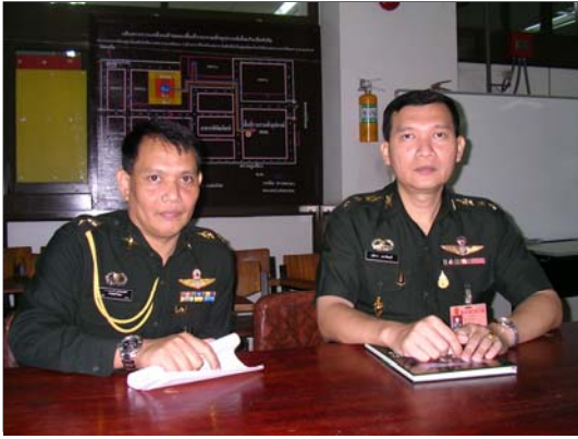
พันเอก อธิกร เอกชัยฤดี ฝ่ายเสนาธิการประจำ ศูนย์เทคโนโลยีทางทหาร