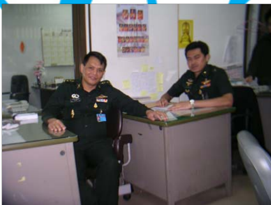
ร้อยตรี สุชาย คงสง่า ประจำกรมยุทธการทหารบก