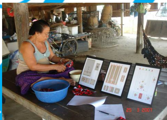
ภาพบรรยากาศการประเมินความคิดเห็นของผู้ผลิต ณ ตำบลดอนมะเกลือ อำเภออู่ทอง จังหวัดสุพรรณบุรี