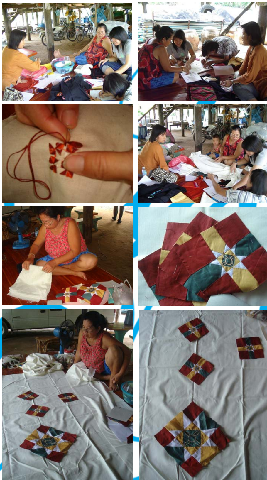
ขั้นตอนการผลิต ต้นแบบผลิตภัณฑ์ของตกแต่งบ้าน( ผ้าปูโต๊ะ ผ้าปูโต๊ะ และหมอนอิง)โดยแนวคิด วัฒนธรรมชาวไทยทรงดำ