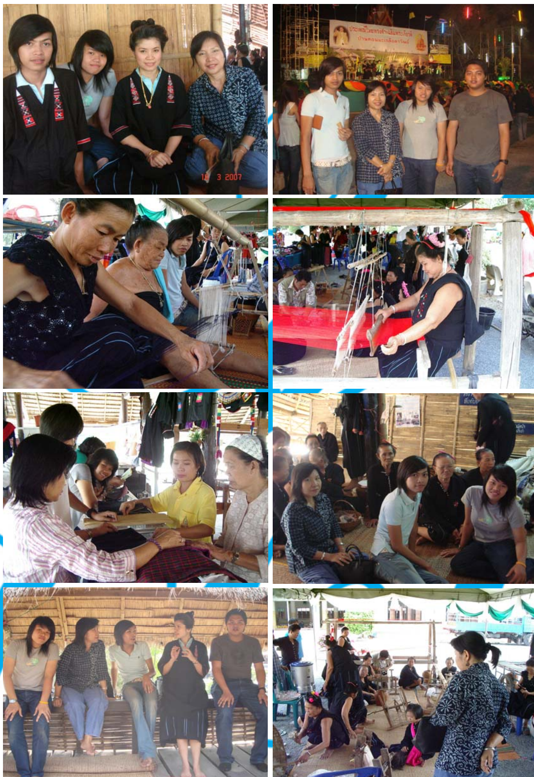
การศึกษาข้อมูล ณ ศูนย์วัฒนธรรมชาวไทยทรงดำ จังหวัดเพชรบุรีและวัดดอนมะเกลือ อำเภออุททอง จังหวัดสุพรรณบุรี