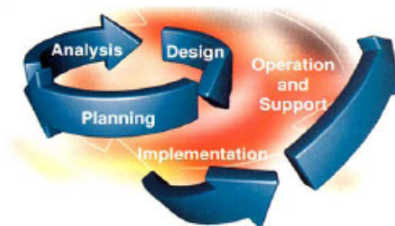
Figure 1: Summary of development stages followed in the SDIB project.