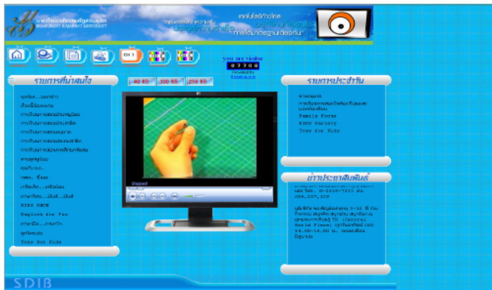
Figure 3: SDIB Channel 1: "Toys for children" program

many 'live' programs such as 'Kindergarten Fantasia' which broadcast children's activities to their classrooms; parents will also be able to watch these program 'live' from the Internet. Figure 3 shows an example of a typical transmission on Channel 1, a "toys for children" program.