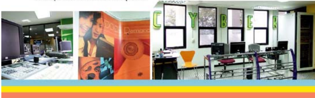
ศูนย์เทคโนโลยีโดย มหาวิทยาลัยราชภัฏสวนคู่มือ

นี่เป็นเพียงส่วนหนึ่งของการพัฒนางานทางด้านเทคโนโลยีสารสนเทศของมหาวิทยาลัยราชภัฏสวนคู่มือ ที่ส่งเสริมการเรียนรู้ของคนในชุมชนในยุค "สังคมฐานความรู้" ในปัจจุบัน