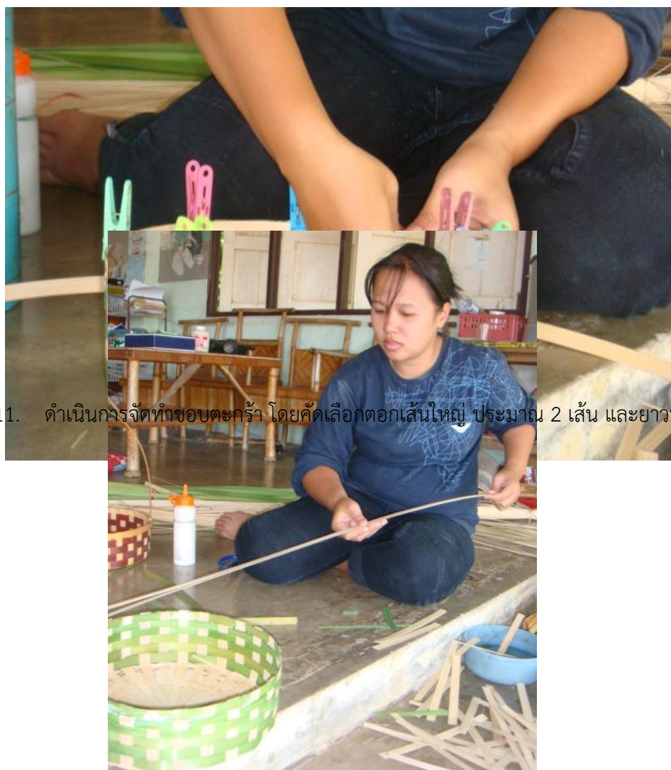
11. ดำเนินการจัดทำขอบตะกร้า โดยคัดเลือกตอกเส้นใหญ่ ประมาณ 2 เส้น และยาวพอที่จะทำขอบตะกร้า