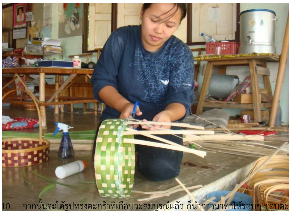
10. จากนั้นจะได้รูปทรงตะกร้าที่เกือบจะสมบูรณ์แล้ว ก็นำกาวมาทาให้รอบๆ ขอบตะกร้า เพื่อให้ตอกติดทน