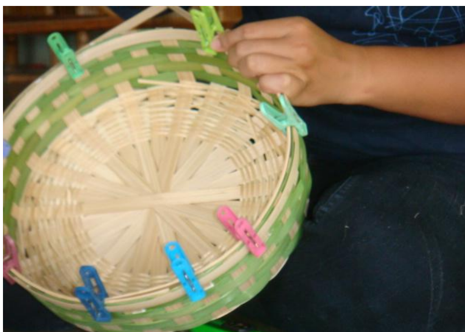
14. เมื่อทากาวรอบๆ ขอบตะกร้าจนเสร็จสิ้นแล้ว ปล่อยให้วางไว้อีกหนึ่งวันให้กาวแห้งจึงค่อยดำเนินการสานหูหว้าตะกร้า