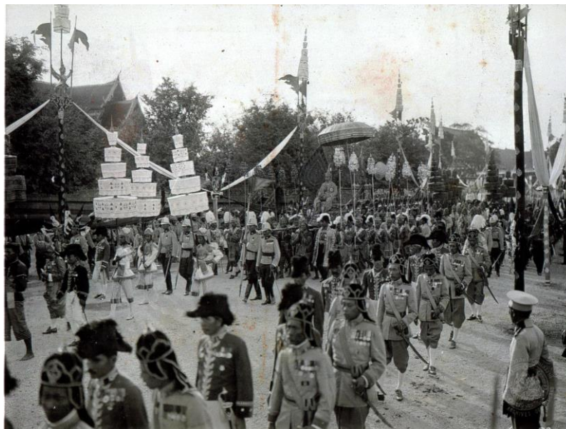
ภาพที่ 2.3 พระบาทสมเด็จพระมงกุฎเกล้าเจ้าอยู่หัวเสด็จเลียบพระนครในพระราชพิธีบรมราชาภิเษก

การที่ทรงกระทำเป็น 2 ครั้งเช่นนี้เพราะทรงถือคติตามแบบตะวันตกที่ว่างานพระราชพิธีบรมราชาภิเษกสำหรับพระเจ้าแผ่นดินควรเป็นงานรื่นเริงสำหรับประเทศ เป็นโอกาสให้นานาประเทศที่มีสัมพันธไมตรีได้มาช่วยงาน ในพระราชพิธีบรมราชาภิเษกครั้งที่สองนี้ พระองค์ทรงอัญเชิญผู้แทนพระเจ้าแผ่นดินและประมุขของชาติต่างๆ มาร่วมเป็นเกียรติในพระราชพิธีเป็นอันมากเช่น อังกฤษ สวีเดน เดนมาร์ก รัสเซีย ญี่ปุ่น ฯลฯ พระองค์ทรงภาคภูมิใจพระทัยและทรงตรัสในงานเฉลิมพระชนมพรรษาว่า พิธีบรมราชาภิเษกของพระองค์ในครั้งนี้ เป็นการร่วมชุมนุมของผู้แทนประมุขและบุคคลสำคัญ ๆ จากนานาประเทศได้มากกว่าครั้งใด ๆ ในบูรพาทิศ (หจข.ร.6บ.1.3/3) ทั้งนี้ค่าใช้จ่ายในการจัดพระราชพิธีบรมราชาภิเษกครั้งที่ 2 นี้ราว 2 ล้านดอลลาร์หรือ 8% ของงบประมาณแผ่นดิน พ.ศ. 2454 และมีเสียงเล่าลือว่าเป็นการใช้เงินที่สูญเปล่า แต่พระองค์ทรงยืนยันว่าพระราชพิธีครั้งนี้เป็นส่วนหนึ่งของการนำพาชาติไทยไปสู่เส้นทางที่ยิ่งใหญ่กว่าในระดับนานาชาติ (Vella, 1978, p. 25)