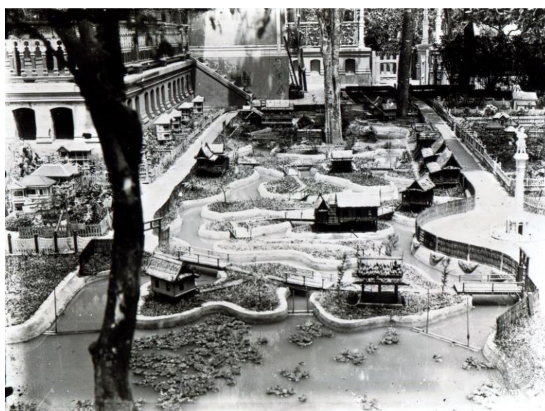
ภาพที่ 2.5 บางส่วนของเมืองจำลองดุสิตธานี ที่เคยตั้งอยู่ในพระราชวังพญาไท

ปกครองระบอบประชาธิปไตยเท่าใดนัก เนื่องจากมีข้อจำกัดที่เห็นได้ชัดคือ ดุสิตธานีเป็นเพียงเมืองสมมติ การดำเนินงานต่าง ๆ เช่น การเลือกตั้งนคราภิบาลเชษฐบุรุษ การประชุมวิพากษ์วิจารณ์อภิปรายของคณะเชษฐบุรุษไม่ได้ตั้งอยู่บนพื้นฐานของความเป็นจริง (มีทนา เกษกมล, 2517, น. 125 – 129) ดังนั้น กล่าวได้ว่ากิจการของเมืองทดลองต่าง ๆ ที่ทรงตั้งขึ้นนี้ไม่ว่าจะเป็นเมืองมั่งหรือเมืองดุสิตธานี ถ้ามองอย่างผิวเผินจะเห็นว่าทรงสนพระทัยในรูปแบบการปกครองแบบประชาธิปไตย แต่เมื่อพิจารณาโดยละเอียดจะพบว่ากิจกรรมเหล่านั้นไม่ได้กว้างขวางแต่จำกัดอยู่ในวงข้าราชการบริพาร อีกทั้งผู้ที่เข้าร่วมกิจกรรมไม่มีสิทธิและเสรีภาพโดยทำหน้าที่เพียงปฏิบัติตามพระราชประสงค์ (กรรกริรมย์ สุวรรณนนท์, 2524, น. 50 – 51)