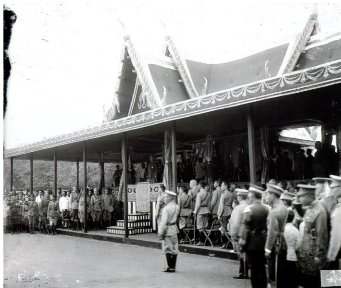
ภาพที่ 2.4 พระบาทสมเด็จพระมงกุฎเกล้าเจ้าอยู่หัวทรงส่งทหารเข้าร่วมรบในสงครามโลกครั้งที่ 1

สัมพันธมิตร ในวันที่ 14 กรกฎาคม พ.ศ. 2461 ซึ่งเป็นวันชาติของฝรั่งเศส (นับตามปฏิทินโบราณโดยวันขึ้นปีใหม่คือวันที่ 1 เมษายน) ได้มีพิธีสวนสนามฉลองชัยชนะของประเทศสัมพันธมิตร ณ กรุงปารีส ไทยได้รับเชิญให้ส่งกองทหารเกียรติยศไปร่วมในการเดินสวนสนามทำให้ธงไตรรงค์ของชาติไทยโบกสะบัดท่ามกลางธงชาติต่าง ๆ ที่เป็นฝ่ายชนะสงครามนับเป็นการประกาศชื่อเสียงของชาติไทยให้เป็นที่รู้จักในบรรดาชนชาติต่าง ๆ