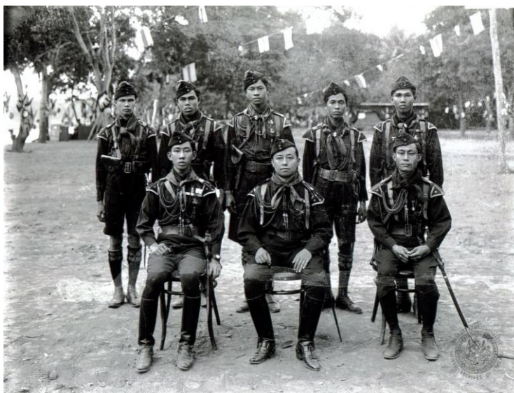
ภาพที่ 2.6 พระบาทสมเด็จพระมงกุฎเกล้าเจ้าอยู่หัวทรงฉลองพระองค์เสือป่า

ในการปลูกฝังความคิดเรื่องชาตินิยมนี้ พระบาทสมเด็จพระมงกุฎเกล้าเจ้าอยู่หัวทรงใช้วิธีการทั้งทางตรงและทางอ้อม ทางตรงคือการออกกฎหมายบังคับใช้ ทางอ้อม เช่น การเผยแพร่งานเขียนและการสร้างสัญลักษณ์แทนตัวพระองค์ การจัดตั้งกองเสือป่า การแจกพระบรมรูปและธงชาติ ฯลฯ ในการเผยแพร่แนวคิดชาตินิยมทางอ้อม พระบาทสมเด็จพระมงกุฎเกล้าเจ้าอยู่หัวทรงใช้บทความที่พระองค์แต่งขึ้นเพื่อชักจูงให้ราษฎรเกิดความสำนึกในความเป็นชาติไทยโดยใช้ประวัติศาสตร์เป็นเครื่องนำทาง อีกทั้งทรงสร้างสัญลักษณ์แทนตัวพระองค์ผ่านการจัดตั้งกองเสือป่าขึ้นในเดือนพฤษภาคม พ.ศ. 2454 โดยมีจุดประสงค์ให้สมาชิกมีความจงรักภักดีต่อพระมหากษัตริย์ กล้าต่อสู้เพื่อปกป้องชาติบ้านเมือง และพระพุทธศาสนา (ภาพที่ 2.6) นอกจากนี้ยังมีการจัดตั้งกองลูกเสือผ่านโรงเรียนแบบสมัยใหม่เพื่อฝึกเด็กผู้ชายให้เป็นผู้มีระเบียบวินัยและประพฤติให้เป็นประโยชน์แก่ชาติบ้านเมือง ปลูกฝังให้มีความจงรักภักดีต่อชาติ ศาสนา และพระมหากษัตริย์