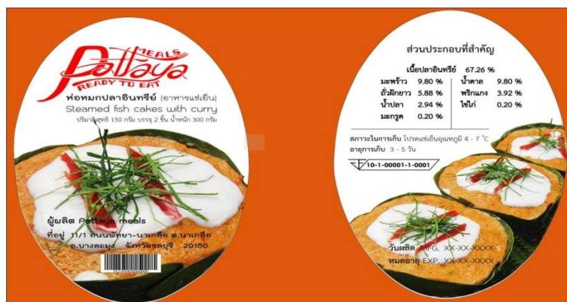
ภาพที่ 4.33 บรรจุภัณฑ์ห่อหมกต้นแบบ