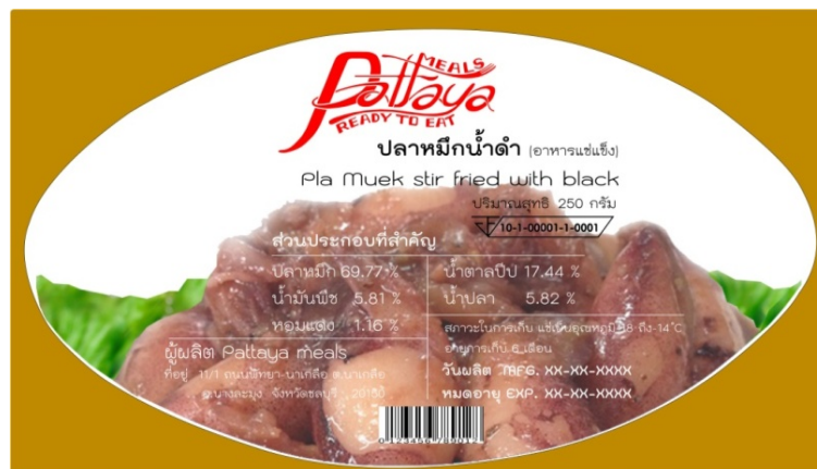
ภาพที่ 4.31 บรรจุกฎเกณฑ์ปลาหมึกน้ำดำต้นแบบ