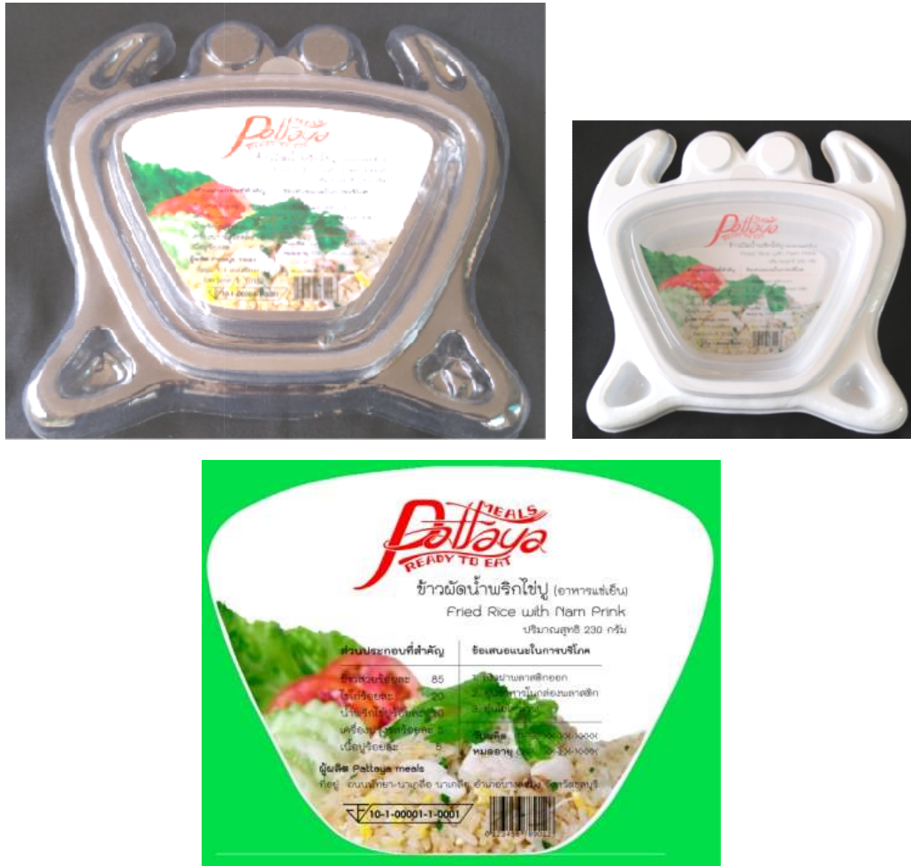
ภาพที่ 4.34 บรรจุภัณฑ์ข้าวผัดน้ำพริกไข่ปูต้นแบบ

2) บรรจุภัณฑ์ข้าวผัดน้ำพริกไข่ปู บรรจุภัณฑ์เป็นรูปปู ใช้พลาสติก 2 ลักษณะ คือ พลาสติกใส และพลาสติกขุ่น ฝาด้านขึ้นมาประมาณ 1 เซนติเมตร