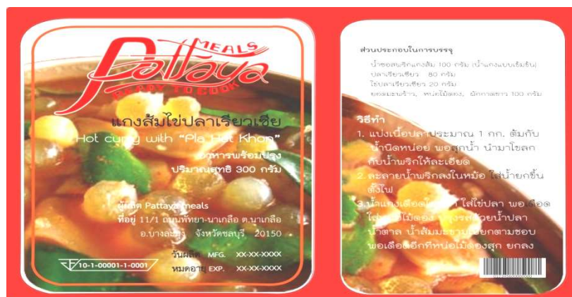
ภาพที่ 4.36 บรรจุกัญจน์แกงส้มไข่ปลาเรียวเขียวต้นแบบ

จากการสนทนากลุ่ม ได้มีข้อเสนอบรรจุกัญจน์ควรมีสีใส หรือสีขาว เพื่อให้มีผลต่อความรู้สึกที่ดูสะอาด ปลอดภัยมากกว่าการใช้สีฟ้าหรือสีแดง โดยเฉพาะการใช้สีใสจะสามารถมองเห็นอาหารด้านในซึ่งจะเป็นสิ่งที่จะช่วยในการตัดสินใจว่าอาหารน่ารับประทานหรือไม่ การใช้ฝาปิดซึ่งมี 2 แบบคือ ฝาปิดแบบเรียบ และฝาแบบนูน ผู้เชี่ยวชาญอาหารให้ความเห็นว่าฝาแบบนูนมีความน่าสนใจมากกว่า ฝาปิดแบบเรียบ