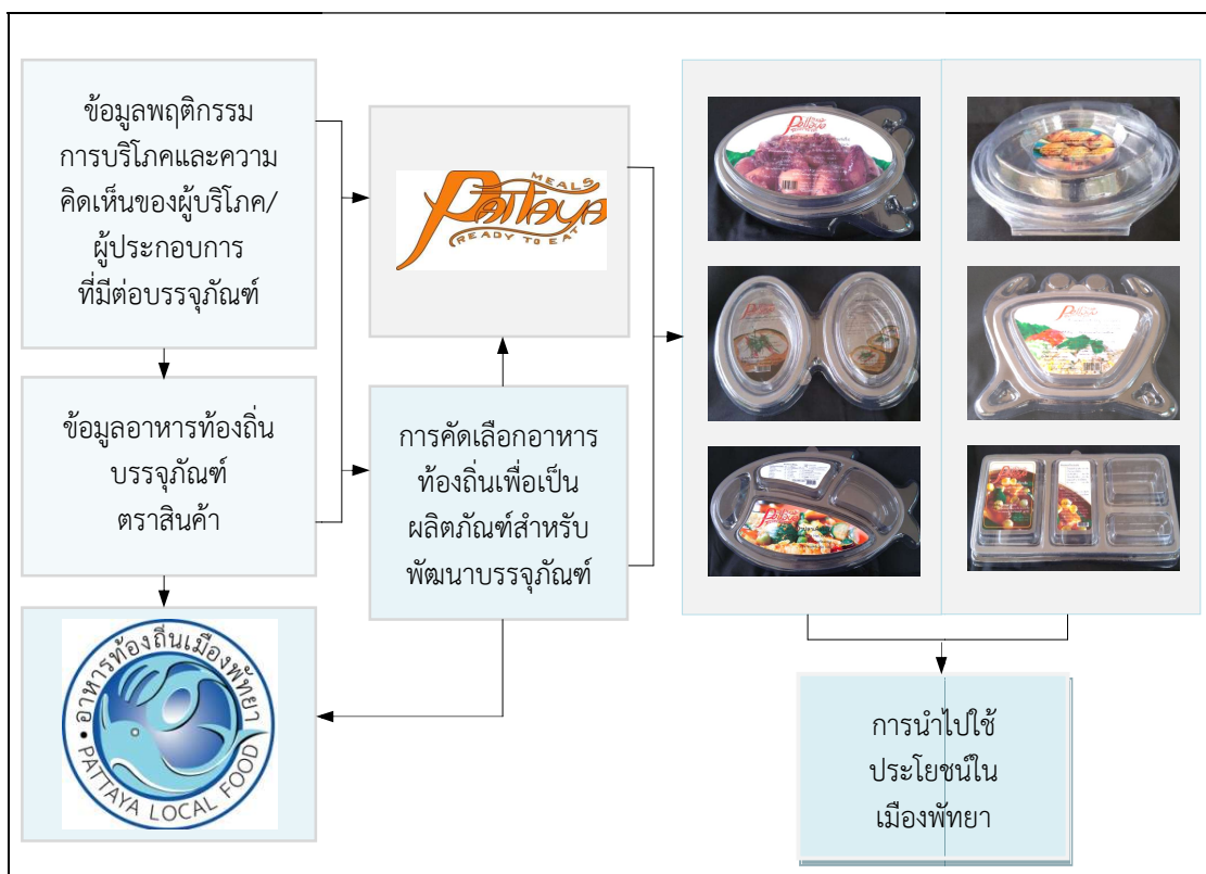
ภาพที่ 4.37 แนวทางการสร้างกลยุทธ์ในการพัฒนาบรรจุภัณฑ์อาหารท้องถิ่นในเมืองพัทยา

จากการศึกษาแต่ละขั้นตอนสามารถนำมาเป็นแนวทางการสร้างกลยุทธ์ในการพัฒนาบรรจุภัณฑ์อาหารท้องถิ่นในเมืองพัทยา ได้ดังนี้