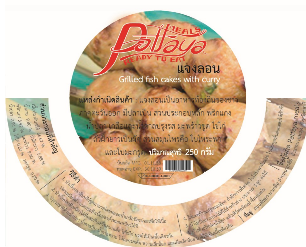
ภาพที่ 4.32 บรรจุภัณฑ์แฉงลอนต้นแบบ