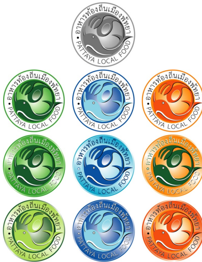
ภาพที่ 4.13 ตรารับรองแบบที่ 4

4) ตรารับรองแบบที่ 4 แนวความคิดใช้สัญลักษณ์วงกลม ปลาโลมา และช้อนและส้อม การใช้สัญลักษณ์เพื่อสื่อความหมายดังนี้ วงกลมเพื่อกำหนดพื้นที่ให้ตรารับรองมีจุดเด่นและมีขอบเขต ปลาโลมาเป็นตัวมาสคอต ใช้เป็นสัญลักษณ์นำโชคแห่งการท่องเที่ยวของเมืองพัทยา การใช้ช้อนสื่อถึงความเป็นอาหารที่มีคุณภาพอาหารในด้านรสชาติ ความอร่อย ความสะอาด และปลอดภัย ตัวอักษรที่ใช้นั้นความเรียบง่ายให้สอดคล้องกับความเป็นท้องถิ่น อีกทั้งยังมีความชัดเจน อ่านได้ง่าย เพื่อให้ผู้พบเห็นได้รับรู้ถึงตรารับรองนี้เป็นอาหารท้องถิ่นของเมืองพัทยา