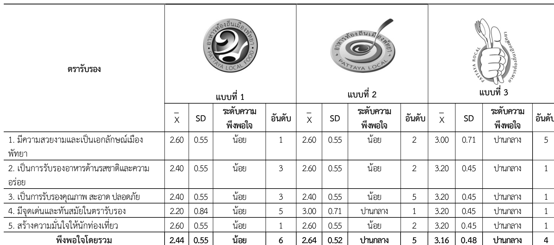
ตารางที่ 4.6 การประเมินความพึงพอใจของผู้เชี่ยวชาญที่มีต่อรูปแบบตรารับรองแบบที่ 1-3