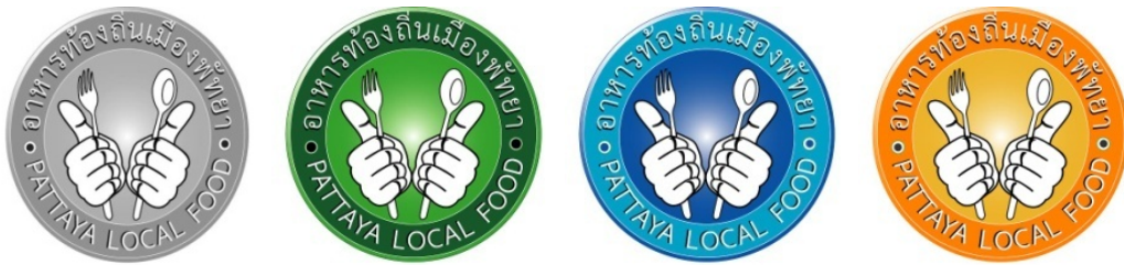
ภาพที่ 4.14 ตรารับรองแบบที่ 5

5) ตรารับรองแบบที่ 5 แนวความคิดใช้สัญลักษณ์มือข้างหนึ่งจับช้อนและยกนิ้วโป้ง และมือข้างหนึ่งจับส้อมและยกนิ้วโป้ง การใช้สัญลักษณ์เพื่อสื่อความหมายดังนี้ วงกลมเพื่อกำหนดพื้นที่ให้ตรารับรองมีจุดเด่นและมีขอบเขต การใช้มือจับช้อนและส้อมคนละข้างแล้วยกนิ้วโป้งนั้นสื่อถึงอาหารที่มีคุณภาพอาหารดีที่สุดในด้านรสชาติ ความอร่อย ความสะอาด และปลอดภัย และตัวอักษรที่ใช้เน้นความเรียบง่ายให้สอดคล้องกับความเป็นท้องถิ่น อีกทั้งยังมีความชัดเจน อ่านได้ง่าย เพื่อให้ผู้พบเห็นได้รับรู้ถึงตรารับรองนี้เป็นอาหารท้องถิ่นของเมืองพัทยา