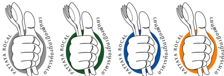
ภาพที่ 4.12 ตรารับรองแบบที่ 3

3) ตรารับรองแบบที่ 3 แนวความคิดใช้สัญลักษณ์ช้อนและส้อม และมียกนิ้วโป้ง การใช้สัญลักษณ์เพื่อสื่อความหมายดังนี้ ช้อนและส้อมสื่อถึงความเป็นอาหาร มือยกนิ้วโป้งเพื่อสื่อถึงอาหารมีความยอดเยี่ยมในด้านรสชาติ ความอร่อย ความสะอาด ปลอดภัย รวมถึงคุณภาพอาหารที่ดีที่สุด ตัวอักษรวางไว้ที่ตำแหน่งด้านข้างด้านหนึ่งใช้ภาษาไทย และอีกด้านหนึ่งใช้ภาษาอังกฤษที่เน้นความเรียบง่ายให้สอดคล้องกับความเป็นอาหารท้องถิ่นที่สื่อสารไปยังนักท่องเที่ยวชาวไทยและชาวต่างชาติ อีกทั้งยังมีความชัดเจน อ่านได้ง่ายเพื่อให้ผู้พบเห็นได้รับรู้ถึงตรารับรองนี้เป็นอาหารท้องถิ่นของเมืองพัทยา แต่ละตรารับรองจะใช้น้ำหนักสีอ่อน-แก่ในสีเดียวกันเพื่อให้สัญลักษณ์และอักษรมีความชัดเจน