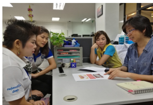
ขอความร่วมมือและนำเสนอผลงานในการจัดประชุมกลุ่มย่อย 15 กรกฎาคม 2559