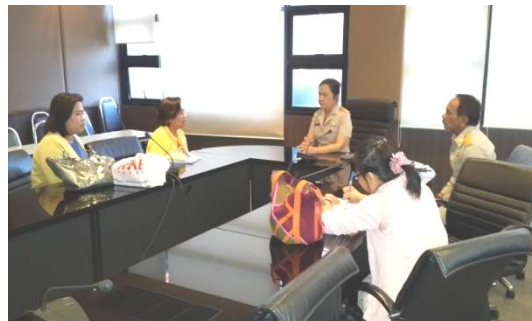
ติดต่อและลงพื้นที่แนะนำโครงการ 22 ธันวาคม 2557