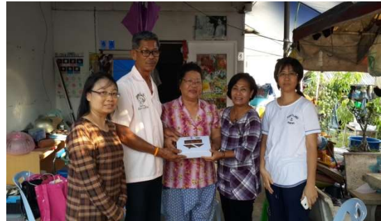
สัมภาษณ์ผู้ประกอบการ 7 มีนาคม 2558