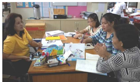
สัมภาษณ์นักวิชาการ 9 มีนาคม 2558