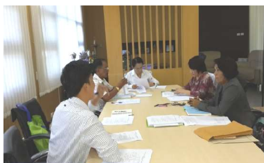
นำเสนอการขอลงพื้นที่เก็บข้อมูล 22 ธันวาคม 2557