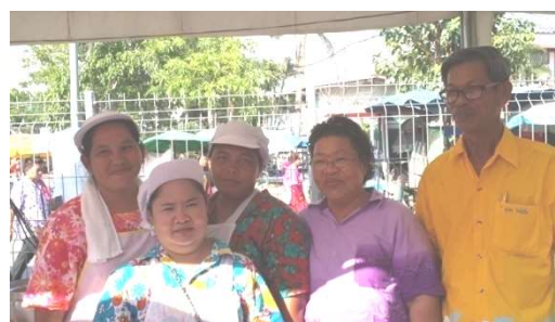
คณะวิจัยมีส่วนร่วมในงานวันกองข้าว 18 เมษายน 2558