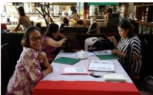
สัมภาษณ์ผู้ประกอบการร้านอาหารและผู้เชี่ยวชาญด้านอาหาร 7-9 มิถุนายน 2558