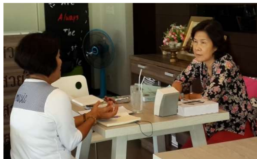
สัมภาษณ์ผู้นำชุมชนและผู้ประกอบการ 17 มีนาคม 2558