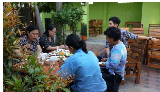
สัมภาษณ์ผู้นำชุมชนและผู้ประกอบการ 8 มีนาคม 2558