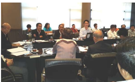
เข้าร่วมและแนะนำโครงการในที่ประชุมต่อคณะกรรมการเมืองพัทยา 5 มีนาคม 2557