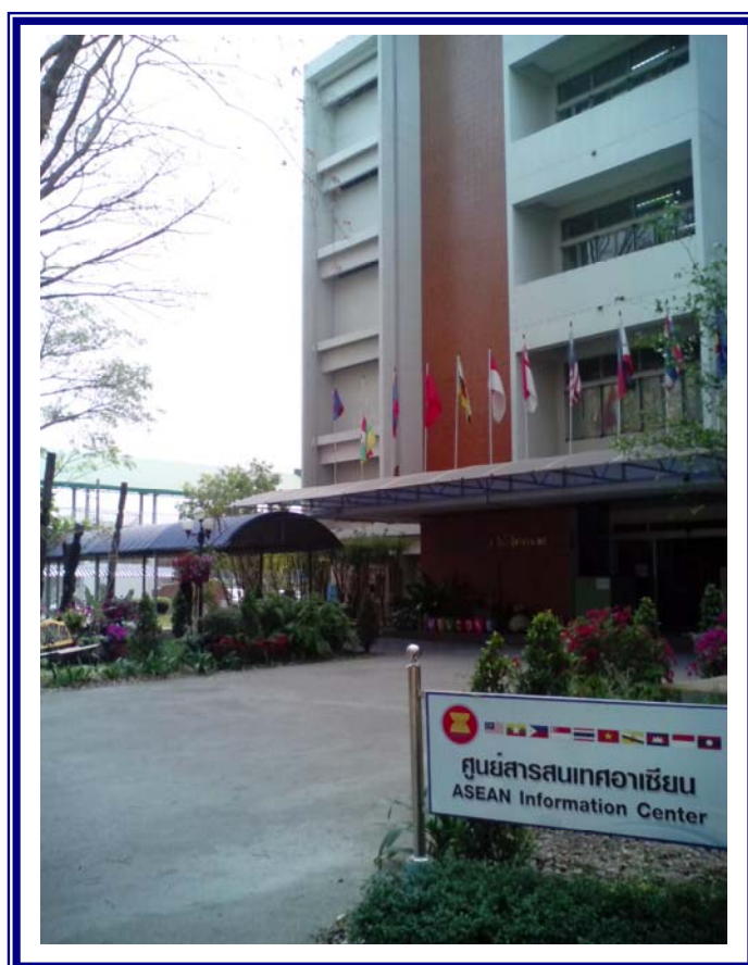
ภาพที่ 4.1 การดำเนินงานศูนย์สารสนเทศอาเซียนเพื่อเตรียมความพร้อมสู่ประชาคมอาเซียน

ในประเด็นความร่วมมือระหว่างห้องสมุดในระดับภูมิภาคอาเซียนยังมีน้อย ส่วนใหญ่เป็นความร่วมมือภายในประเทศมากกว่า ยกเว้นห้องสมุดมหาวิทยาลัยในภูมิภาคบางแห่งสภาพปัจจุบันมีการทำ MOU กับมหาวิทยาลัยในประเทศพม่า ลาว แต่เน้นการดำเนินกิจกรรม/โครงการร่วมกัน เท่านั้น ไม่ได้ทำการพัฒนาทรัพยากรสารสนเทศร่วมกันหรือแลกเปลี่ยนบุคลากรระหว่างสถาบัน แต่ในอนาคตเมื่อเข้าสู่ประชาคมอาเซียนเต็มตัว ก็จะดำเนินการเรื่องความร่วมมือให้มากขึ้น