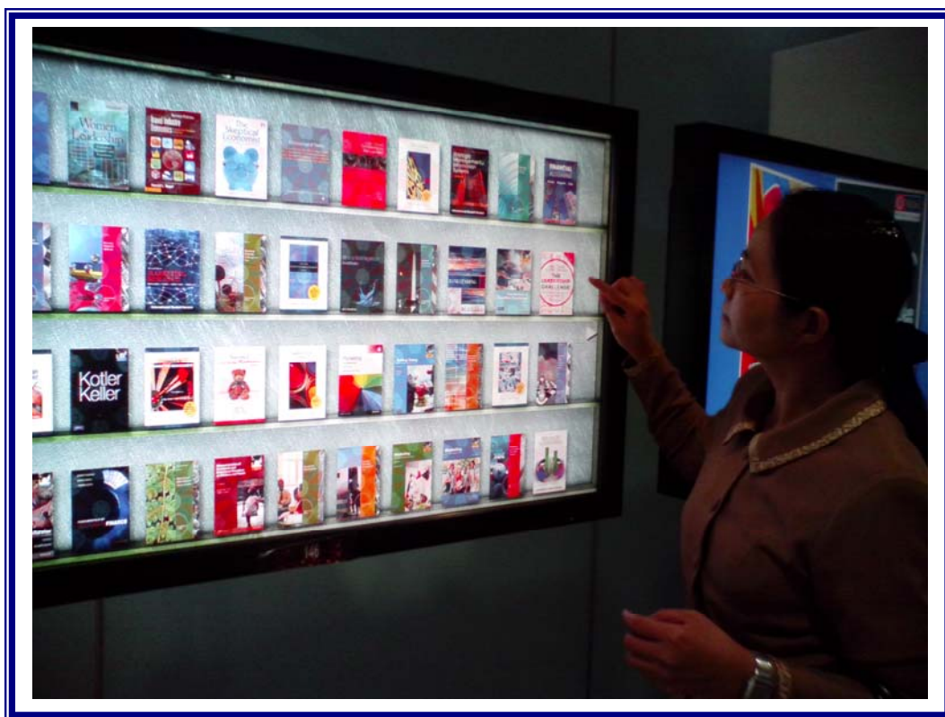
ภาพที่ 4.4 ทรัพยากรสารสนเทศอิเล็กทรอนิกส์เพื่อการเข้าถึงทางออนไลน์