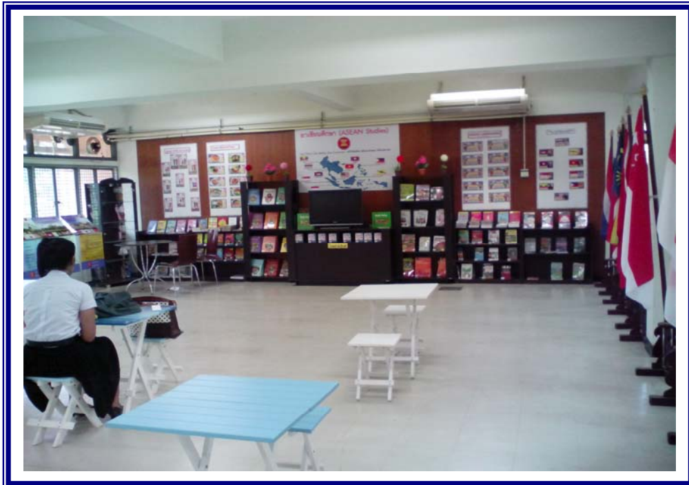
ภาพที่ 4.2 จัดสภาพแวดล้อมมุมอาเซียนเพื่อสร้างบรรยากาศอาเซียน