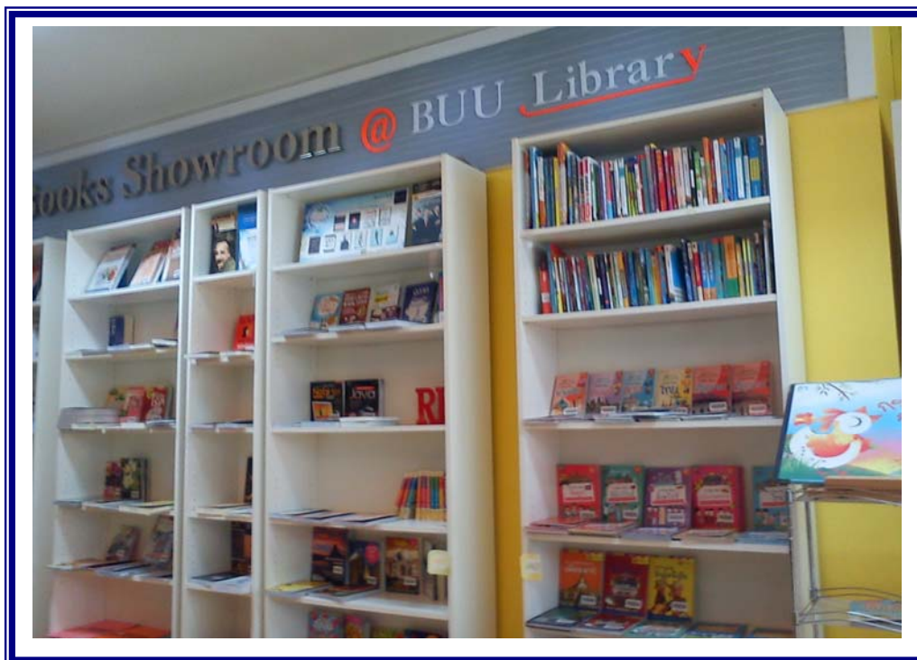
ภาพที่ 4.3 ทรัพยากรสารสนเทศเนื้อหาด้านอาเซียนในมุมหนังสืออาเซียน