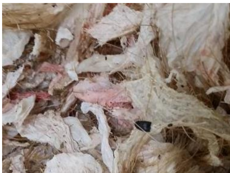
ภาพที่ 4.1 แสดงของเหลือทิ้งจากกระบวนการทำหมูหัน

ส่วนที่ 5 ด้านของเสีย ขนหมูเป็นของเสียชนิดเดียวที่เหลือทิ้งจากอุตสาหกรรมหมูหัน โดยของเสียขนหมูที่ได้ มีลักษณะที่ปนมากับชั้นหนังและเลือด เนื่องจากขั้นตอนการเอาขนหมูออกจะใช้การลวกน้ำร้อนที่ตัวหมูและชุดขนและหนังติดออกมาด้วย ซึ่งเป็นส่วนเดียวของหมูที่ต้องทิ้งต่อสิ่งแวดล้อม ไม่สามารถนำไปขายได้ ทำให้เกิดปัญหาสิ่งแวดล้อม เป็นขยะของเสีย โดยทั่วไปจะปล่อยให้เน่า หรือปล่อยให้แห้งไม่สามารถทำการเผาได้ เนื่องจากไม่ติดไฟทั้งในกรณีปล่อยให้แห้งแล้ว ซึ่งลักษณะตัวอย่างของเสียขนหมูที่ได้และกรรมวิธีในการลอกหนังขนหมูจะเหมือนกัน เนื่องจากใช้กรรมวิธีในการลอกขนหมูเดียวกัน ดังภาพที่ 4.1