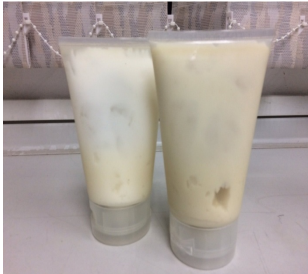
ครีมขวดผสม