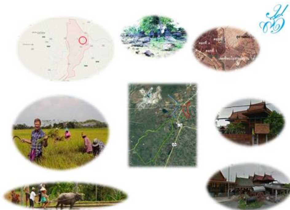
ภาพที่ 2 ทรัพยากรแหล่งท่องเที่ยวของชุมชน

ในความต้องการพัฒนาสถานที่ท่องเที่ยวพบว่า ประชาชนต้องการที่จะพัฒนาชุมชนให้เป็นแหล่งท่องเที่ยว เพื่อเป็นการเพิ่มรายได้ให้กับชุมชน ทำให้ประชาชนมีรายได้เพิ่มมากขึ้น รวมทั้งสอดคล้องกับงานวิจัยของ สมหมาย แจ่มกระจ่าง ศรีวรรณ มีคุณ และ พิระพงษ์ สุตประเสริฐ (2551) ซึ่งพบว่าสภาพปัญหาและความต้องการทั่วไปของ ชุมชน ซึ่งเป็นชุมชนเมืองและชุมชนกึ่งเมือง สภาพโครงสร้างและสังคมค่อนข้างดีมีปัญหาและความต้องการด้าน โครงสร้างชุมชนและด้านสังคมเพิ่มขึ้นจากเดิมที่มีอยู่ ประชาชนมีระดับความต้องการพัฒนา วัดโพธาราม เป็น อันดับแรก รองลงมาคือ คอกข้างดิน แหล่งชูดักหุ้ผึ้งศพ แหล่งอารยธรรมมนุษย์ก่อนประวัติศาสตร์ ทางเสด็จ พระราชดำเนิน ร.6 ถนนท้าวอุ๋ทอง และ สระอโนดาต ตามลำดับ โดยมีความต้องการที่จะพัฒนาสถานที่เหล่านั้น เป็นแหล่งท่องเที่ยวโดยผ่านกิจกรรมต่างๆ เช่น กิจกรรมวันสารท การขี่จักรยาน การท่องเที่ยวในเขต เป็นต้น