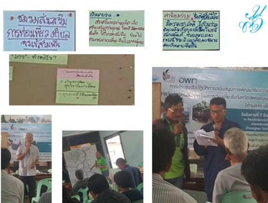
ภาพที่ 5 กิจกรรมการประชุมเชิงปฏิบัติการ

และมีกิจกรรมร่วมกับคนในชุมชน มีการสร้างรายได้ด้วยการขายของที่ระลึกของชุมชนในพื้นที่ด้วยวัฒนธรรมของผู้อาศัยในชุมชน เป็นการท่องเที่ยวที่ครบวงจรระหว่างการท่องเที่ยวทางประวัติศาสตร์ ท่องเที่ยวแหล่งเรียนรู้ทางวัฒนธรรม และแหล่งท่องเที่ยวเชิงนันทนาการ เช่น การชม พิพิธภัณฑสถานพื้นบ้าน สถานที่ต่างๆทั้งโบราณสถาน ประเพณี วิถีชีวิตวัฒนธรรมที่ยาวนาน