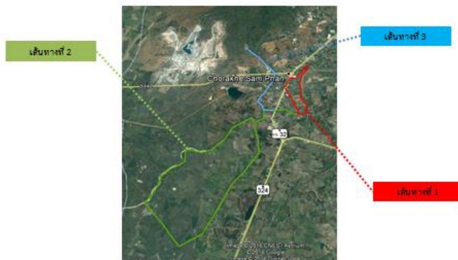
ภาพที่ 6 เส้นทางสำหรับการพัฒนาแหล่งท่องเที่ยวของชุมชน