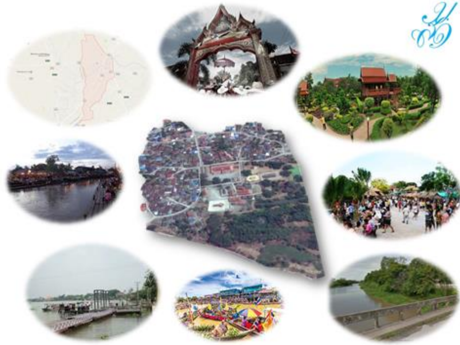
ภาพที่ 3 โครงการพัฒนาแหล่งท่องเที่ยวของชุมชน