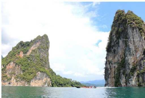
ภาพที่ 2.4 ภูเขาหินปูนโผล่พ้นน้ำ สูงเด่นตระหง่านตา ที่มา ASTVผู้จัดการออนไลน์, 2557

อำเภอบ้านตาขุน ขับตรงไปอีกประมาณ 67 กิโลเมตร จะมีทางแยกขวาเข้าเขื่อนรัชชประภา มีป้ายเขื่อนรัชชประภาบอกชัดเจน เลี้ยวขวาไปตามป้ายอีก 12 กิโลเมตร ขับตามที่ป้ายบอก จนกระทั่งถึงสันเขื่อน ก็จะถึงจุดชมวิว