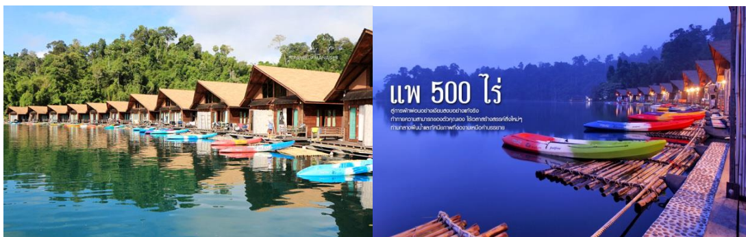
ภาพที่ 2.6 บรรยากาศที่พักของ แพ 500 ไร่

ส่วนความสะดวกสบายในการนั่งเรือชมความสวยงามนั้นจะมีเรือของชาวบ้านให้บริการอยู่มากมาย สามารถติดต่อเช่าเรือไปเที่ยวอ่างเก็บน้ำกันได้แบบสบายๆ โดยเรือที่จะพาเราไปทัวร์อ่างเก็บน้ำนี้ เป็นเรือหางยาวที่มีที่นั่งแบบสบายๆ มีหลังคาบังแดด และขณะนั่งอยู่บนเรือเราก็ต้องใส่เสื้อชูชีพไว้ด้วยเพื่อความปลอดภัย ระหว่างที่ท่านนั่งชม ทัศนียภาพภายในอ่างเก็บน้ำของเขื่อนรัชชประภาไม่ว่าจะมองไปทางไหนก็เห็นแต่ภาพของภูเขาหินและภูเขาหินปูนรูปร่างแปลกแตกต่างกันไป โผล่พ้นน้ำสีเขียวใส ตั้งเรียงรายสลับซับซ้อนไปมาให้ชมแบบจำเริญใจ โดยมีภูเขาหินปูนที่เป็นไฮไลต์ที่ต้องไม่พลาดไปชมนั่นก็คือ เขาสามเกลอ เป็นยอดเขาเล็กๆ 3 ยอดโผล่พ้นน้ำขึ้นมา ถือว่าเป็นจุดยอดนิยมที่นักท่องเที่ยวต้องมาถ่ายภาพคู่กัน และก็ยังยังมีภูเขาหินปูนขนาดใหญ่ที่เมื่อมองไปที่หน้าผาจะเห็นเป็นภาพหญิงสาว 2 คน อยู่บนหน้าผา (อันนี้ก็ต้องใช้จินตนาการกันของแต่ละคนในการมอง)