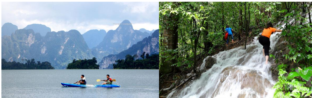
ภาพที่ 2.7 กิจกรรมพายเรือแคนูที่ทางแพ 500 ไร่ และ กิจกรรมการเที่ยวชมน้ำตกแปดเซียน

ที่ทางเคที่ซีจัดขึ้น โดยได้รางวัลประเภทเขตแม่น้ำ / ทะเลสาบ (River / Lake) อนุรักษ์ธรรมชาติและสิ่งแวดล้อม และที่นี่เป็นแพพักที่มีความเงียบสงบเป็นส่วนตัว ด้านหน้าแพพักเป็นเว็ງอ่าวอันกว้างใหญ่ มีทิวเขาหินปูนอันสวยงามอยู่เบื้องหน้าแบบพาโนรามา ห้องพักถูกสร้างเป็นหลังๆ มีให้เลือกพักตามใจชอบ