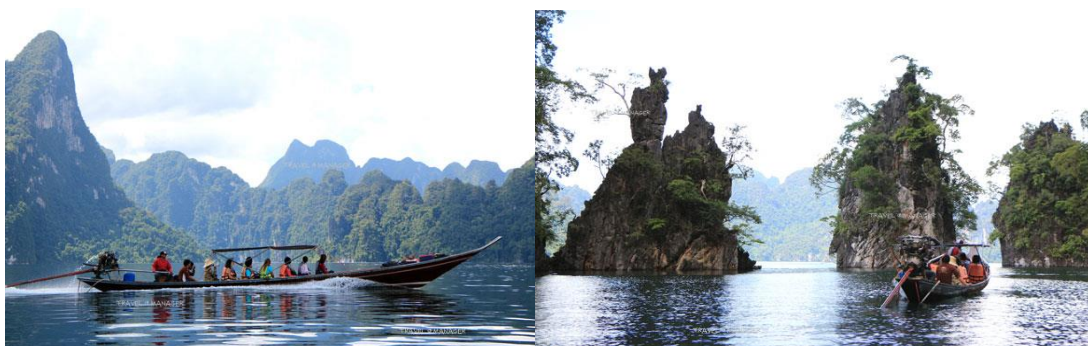
ภาพที่ 2.5 นั่งเรือหางยาวชมวิวกุเขาที่งดงาม และ เขาสามเกลอหนึ่งในไฮไลต์ของภูเขาที่อยู่ในอ่างเก็บน้ำ

การที่ “เขื่อนรัชชประภา” ถูกสร้างขึ้นมาถือว่าเป็นเขื่อนสารพัดประโยชน์ของคนในพื้นที่ภาคใต้ ไม่ว่าจะเป็น แหล่งผลิตพลังงานไฟฟ้า เป็นแหล่งกักเก็บน้ำการชลประทานเพื่อการเพาะปลูก ช่วยลดความรุนแรงของสภาวะน้ำท่วมในพื้นที่ตอนล่าง และก็ช่วยแก้ไขน้ำเสียและผลักดันน้ำเค็ม อีกทั้งอ่างเก็บน้ำของเขื่อนฯ ก็ยังเป็นแหล่งประมงน้ำจืดที่สำคัญ ซึ่งสร้างรายได้ให้กับชาวบ้านไม่น้อยเลย