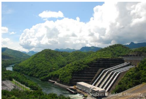
ภาพที่ 2.8 เขื่อนศรีนครินทร์