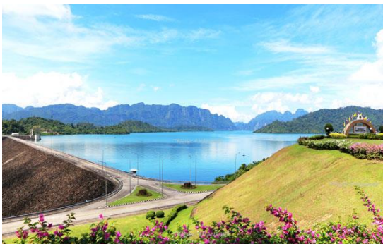
ภาพที่ 2.3 ทักษณภาพความงดงามของเขื่อนรัชชประภา

“เขื่อนรัชชประภา” แห่งนี้เมื่ออดีตมีชื่อเรียกว่า “เขื่อนเชี่ยวหลาน” และได้รับพระมหากรุณาธิคุณจากพระบาทสมเด็จพระเจ้าอยู่หัว พระราชทานนามให้ใหม่ว่า “เขื่อนรัชชประภา” มีความหมายว่า “แสงสว่างแห่งราชอาณาจักร” ซึ่งเขื่อนแห่งนี้ถูกสร้างขึ้นปิดกั้นลำน้ำคลองแสงที่บ้านเชี่ยวหลาน ต.เขาพัง อ.บ้านตาขุน จ.สุราษฎร์ธานี เป็นเขื่อนอเนกประสงค์แห่งที่สองของภาคใต้ เป็นเขื่อนหินถมแกนดินเหนียว มีความสูง 94 ม. มีความยาวสันเขื่อน 761 ม. และมีเขื่อนปิดกั้นช่องเขาขาดอีก 5 แห่ง มีความจุ 5,638.8 ล้านลูกบาศก์เมตร มีพื้นที่อ่างเก็บน้ำ 185 ตารางกิโลเมตร ปริมาณน้ำไหลเข้าอ่างเฉลี่ยปีละ 2,598 ล้านลูกบาศก์เมตร ติดตั้งเครื่องผลิตไฟฟ้า เครื่องละ 80,000 กิโลวัตต์ จำนวน 3 เครื่อง เป็นเขื่อนอเนกประสงค์ ใช้ประโยชน์ทั้งในด้านการชลประทาน และการผลิตกระแสไฟฟ้า สร้างปิดกั้นลำน้ำคลองแสงที่บ้านเชี่ยวหลาน ตำบลเขาพัง อำเภอบ้านตาขุน จังหวัดสุราษฎร์ธานี ชื่อเดิมเรียกว่า เขื่อนเชี่ยวหลาน เริ่มดำเนินการก่อสร้าง เมื่อวันที่ 9 กุมภาพันธ์ 2525 แล้วเสร็จในเดือนกันยายน 2530 เมื่อสร้างแล้วเสร็จได้รับพระมหากรุณาธิคุณจากพระบาทสมเด็จพระเจ้าอยู่หัว พระราชทานนามให้ใหม่ว่า “เขื่อนรัชชประภา” มีความหมายว่า “แสงสว่างแห่งราชอาณาจักร” พระบาทสมเด็จพระเจ้าอยู่หัวพร้อมด้วย สมเด็จพระเทพรัตนราชสุดาฯ สยามบรมราชกุมารี ได้เสด็จพระราชดำเนินเปิดเขื่อนรัชชประภา และโรงไฟฟ้าพลังน้ำ เมื่อวันที่ 30 กันยายน 2530