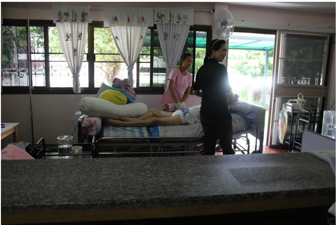
ภาพที่ ค-16 สถานที่บ้านพอใจ เนอร์ซิ่งโฮม