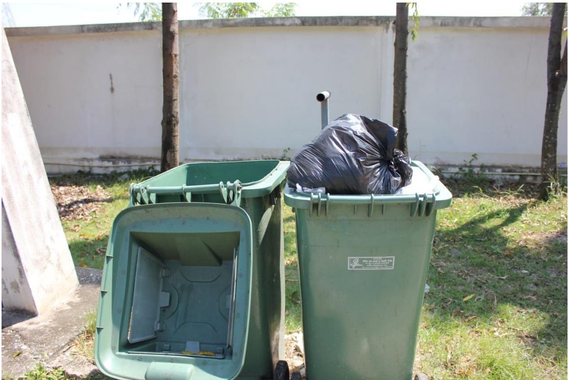
ภาพที่ ค-3 การเก็บรวบรวมขยะที่ใช้แล้ว