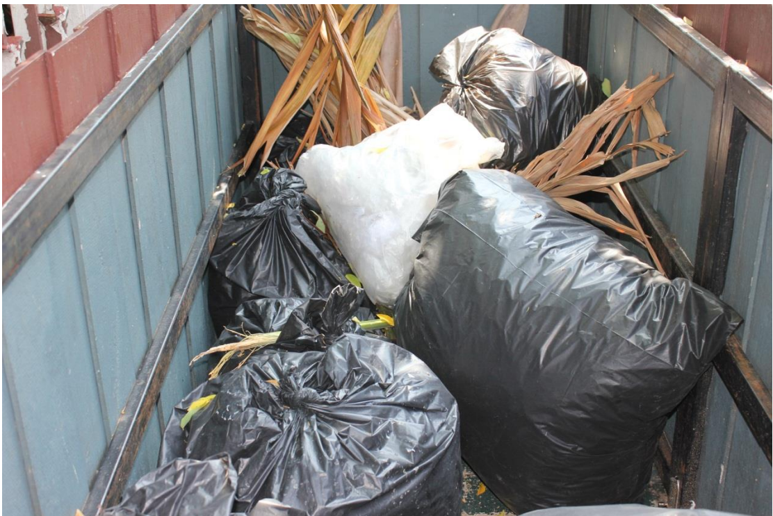
ภาพที่ ค-6 การเก็บรวบรวมขยะที่ใช้แล้ว