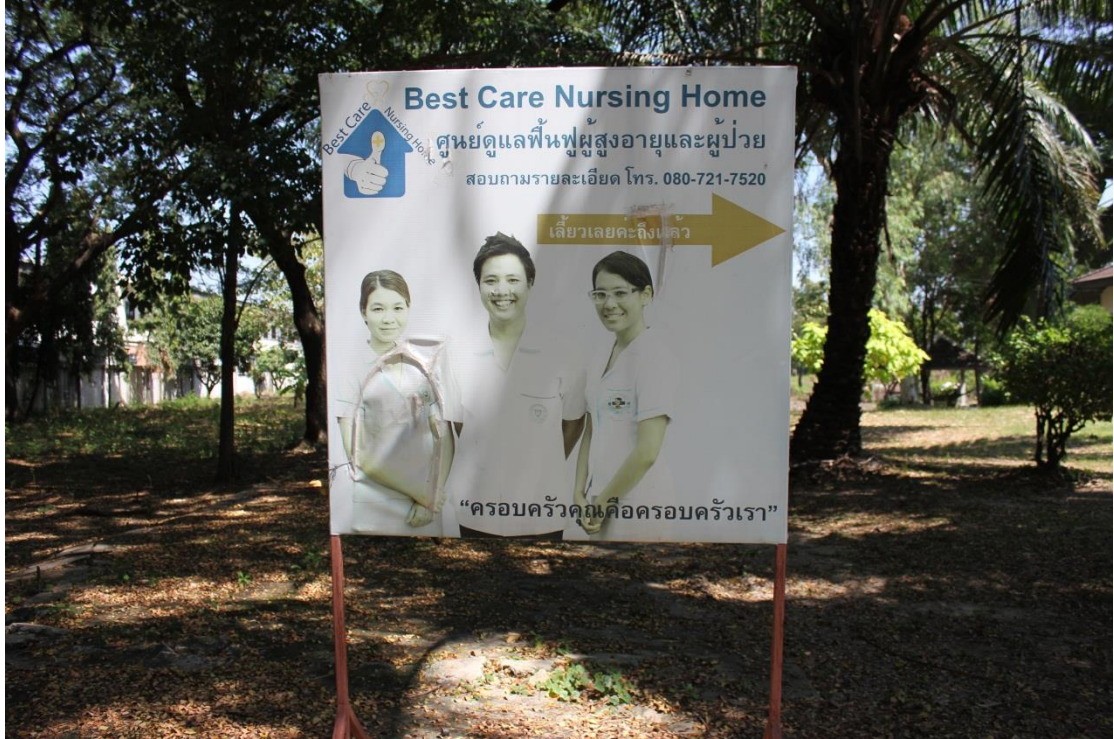
ภาพที่ ค-1 สถานที่ Best Care Nursing Home ศูนย์ดูแลฟื้นฟูผู้สูงอายุและผู้ป่วย