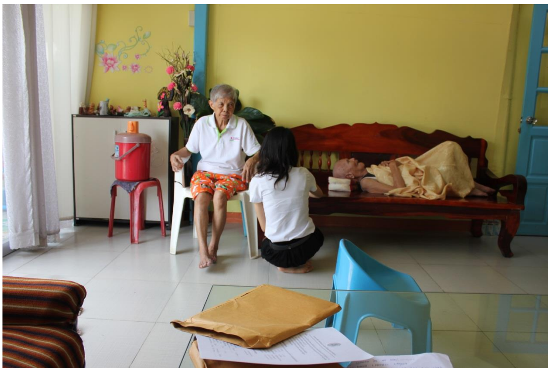
ภาพที่ ค-14 ผู้สูงอายุตอบแบบสอบถาม