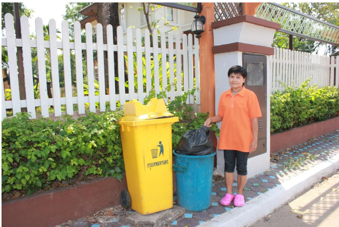
ภาพที่ ค-21 การเก็บรวบรวมขยะที่ใช้แล้ว