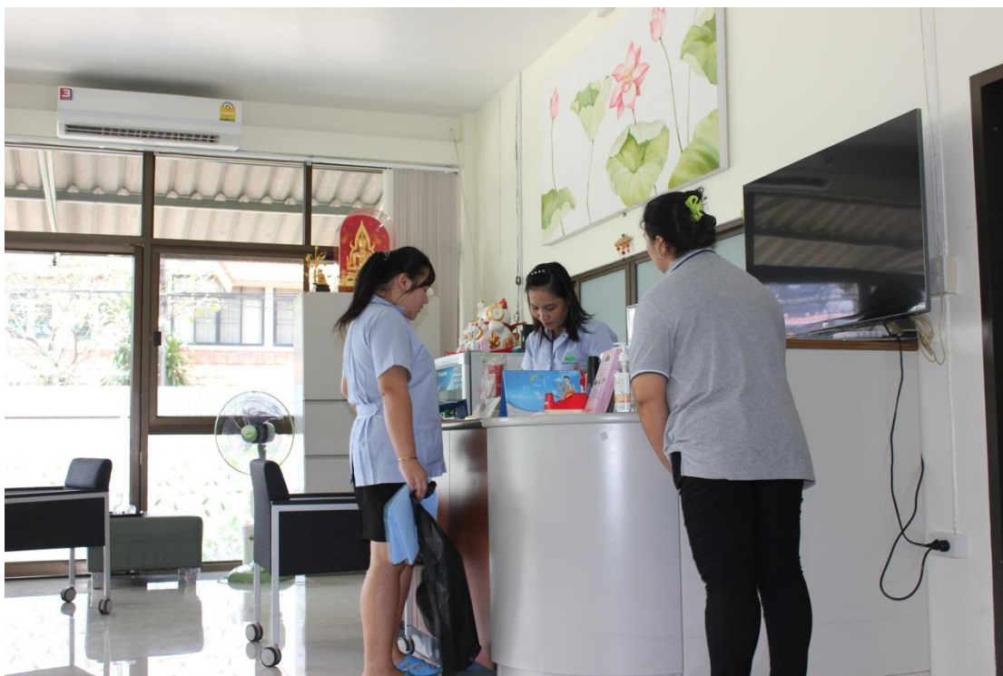
ภาพที่ ค-10 เจ้าหน้าที่ตอบแบบสอบถาม