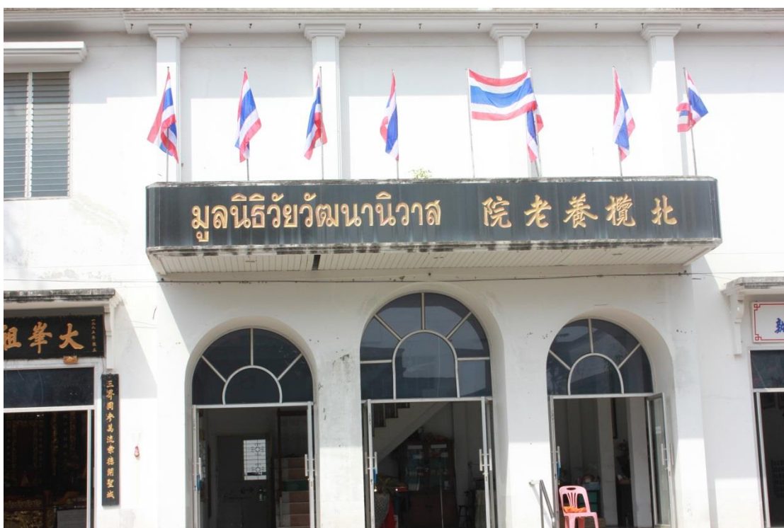
ภาพที่ ค-22 สถานที่มูลนิธิวิวัฒน์นิवास