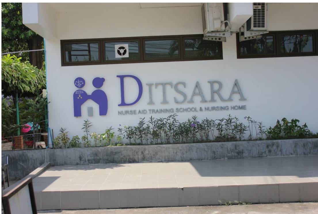
ภาพที่ ค-7 สถานที่ตั้งดิษฐาเนสซิ่งโฮม