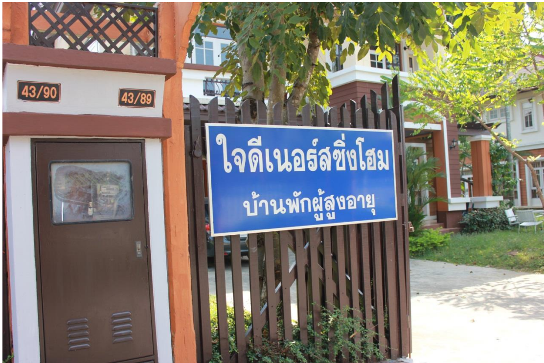
ภาพที่ ค-19 สถานที่ใจดีเนอร์ซิงโฮม บ้านพักผู้สูงอายุ