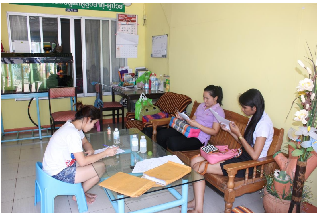
ภาพที่ ค-13 เจ้าหน้าที่ตอบแบบสอบถาม