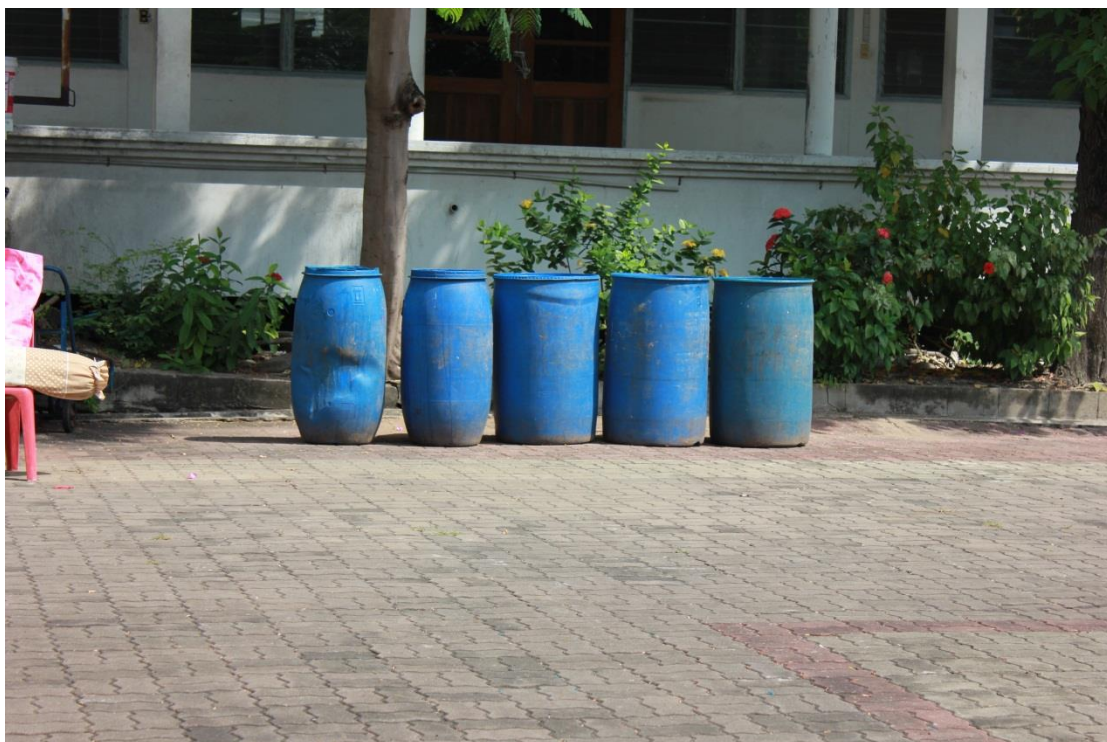
ภาพที่ ค-25 การเก็บรวบรวมขยะที่ใช้แล้ว