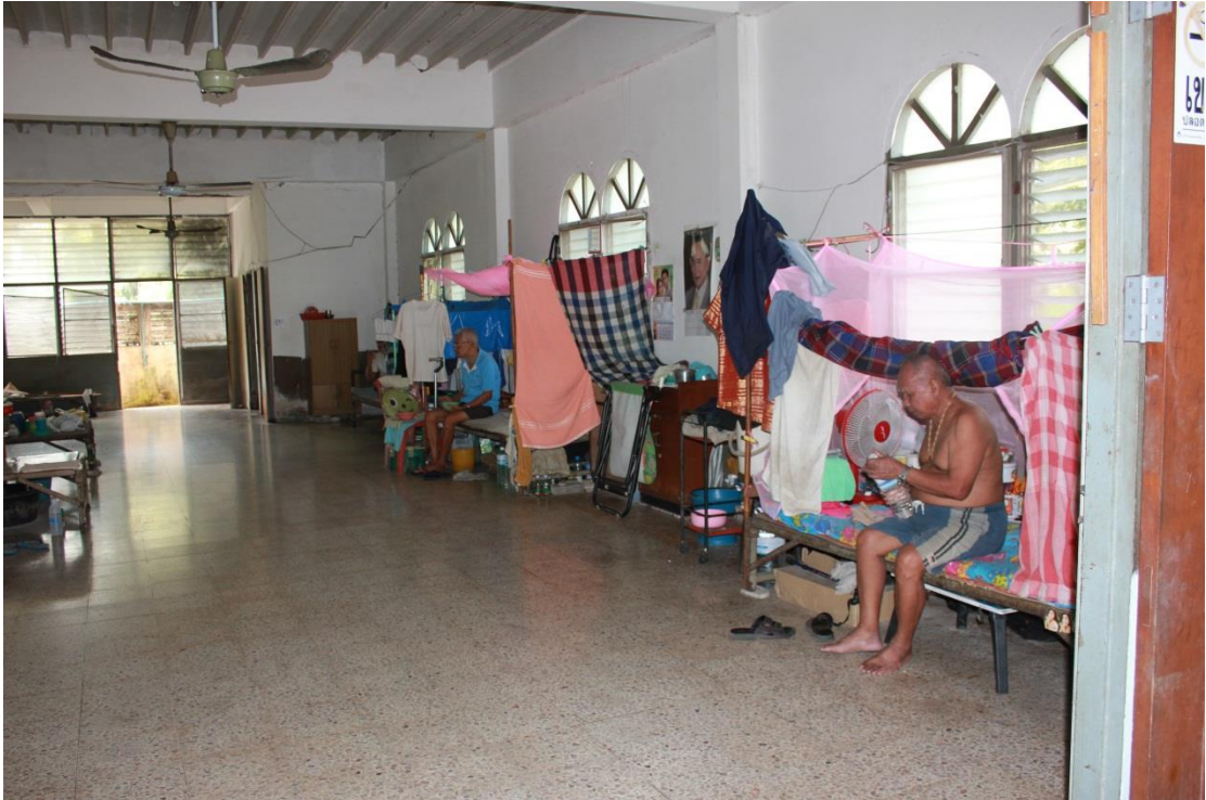
ภาพที่ ค-24 ความเป็นอยู่ของผู้สูงอายุ