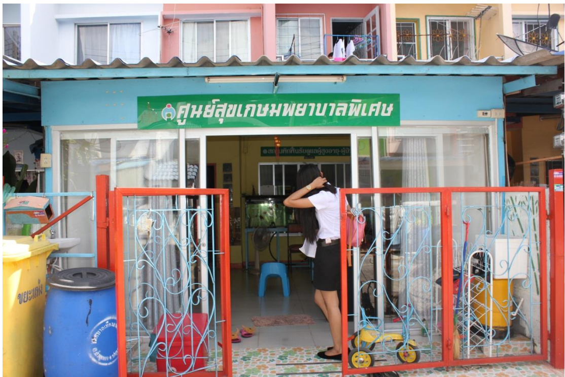
ภาพที่ ค-12 สถานที่ศูนย์สุขเกษมพยาบาลพิเศษ