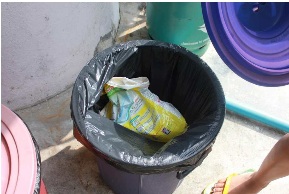
ภาพที่ ค-18 การแยกขยะของแต่ละประเภท