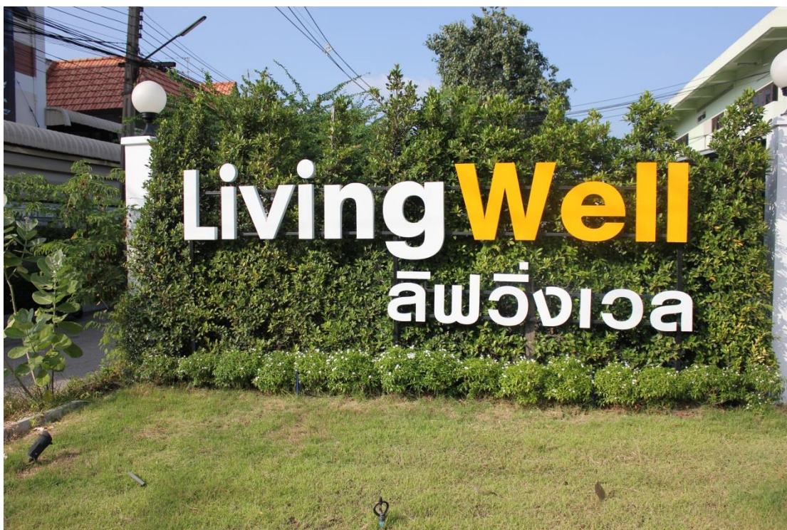
ภาพที่ ค-9 สถานที่ Living Well ศูนย์ดูแลผู้สูงอายุและผู้ป่วยพักฟื้น