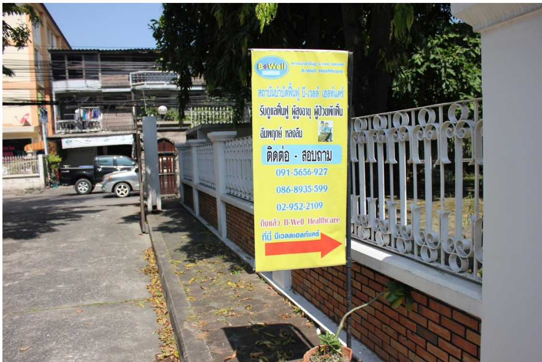
ภาพที่ ค-4 สถานที่ บี - เวลล์ เฮลท์แคร์ รับดูแลฟื้นฟู ผู้สูงอายุ ผู้ป่วยพักฟื้น