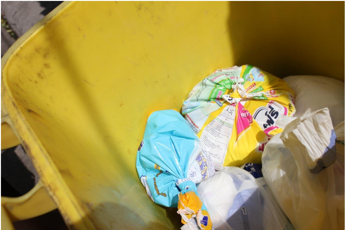
ภาพที่ ค-15 การเก็บรวบรวมขยะที่ใช้แล้ว