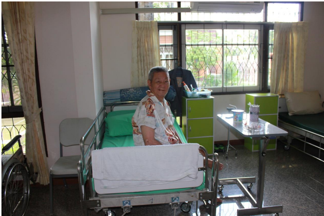
ภาพที่ ค-20 ผู้สูงอายุตอบแบบสอบถาม