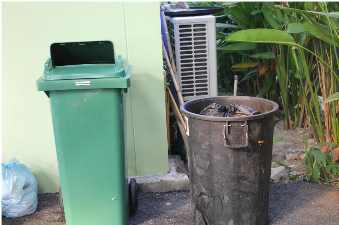
ภาพที่ ค-11 การเก็บรวบรวมขยะที่ใช้แล้ว