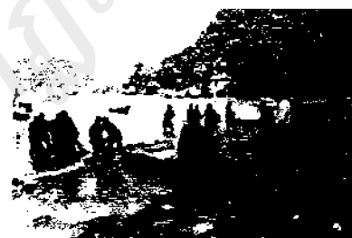
ร่วมกันพัฒนาอำวมะนาว