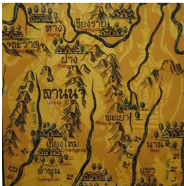
ภาพที่ 1.4 อาณาจักรล้านนา

คำว่า ล้านนา หมายถึง ดินแดนที่มีนาจำนวนล้าน โดยในตำนานพื้นเมืองเชียงใหม่ได้กล่าวถึงดินแดนของล้านนาว่ามีถึง 57 เมือง