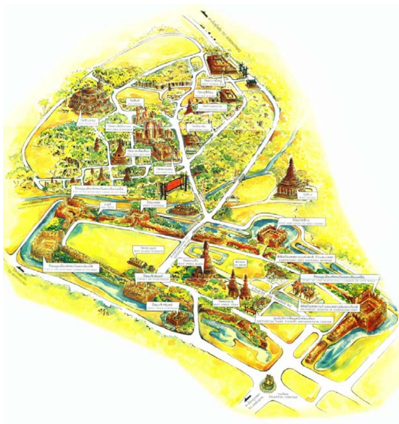
ภาพที่ 1.3 อุทยานประวัติศาสตร์กำแพงเพชร

จากการแบ่งภูมิภาคตามหลักเกณฑ์ของกรมการปกครอง กระทรวงมหาดไทย ที่การ ท่องเที่ยวแห่งประเทศไทยยึดถือเป็นเกณฑ์หลักนั้น สามารถแบ่งพื้นที่ภาคเหนือออกเป็น 2 ส่วน คือ ภาคเหนือตอนบน กับ ภาคเหนือตอนล่าง โดยภาคเหนือตอนบนนั้นจะมีประวัติศาสตร์และอัตลักษณ์ ทางวัฒนธรรมที่โดดเด่นและแตกต่างจากภาคเหนือตอนล่าง โดยภาคเหนือตอนบนจะมีชื่อเรียกอีกชื่อ หนึ่งว่า “ล้านนา”