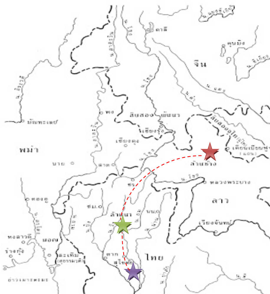
ภาพที่ 1.5 แผนที่แสดง ดินแดนรอบล้านนา