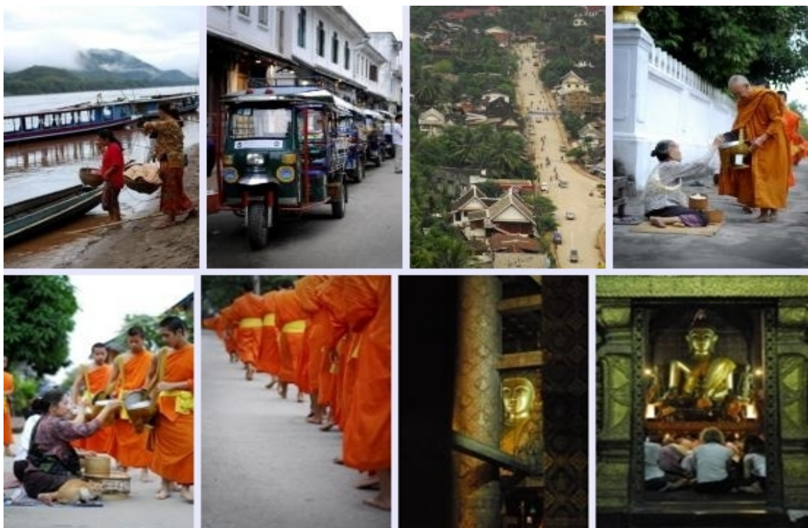
ภาพที่ 1.6 หลวงพระบาง

สองฝ่าย ต่อมาเมื่อพระเมืองเกษเกล้าแห่งล้านนาเสด็จสวรรคตในปี พ.ศ. 2088 อาณาจักรล้านนาก็เกิดความวุ่นวายจากการสรรหาผู้เหมาะสมที่จะเสด็จขึ้นครองราชย์ เหล่าขุนนางแห่งล้านนาจึงได้อัญเชิญพระเจ้าไชยเชษฐาธิราช พระราชโอรสของพระเจ้าโพธิสารและเจ้าหญิงเชื้อสายล้านนา ให้เสวยราชสมบัติปกครองอาณาจักรล้านนาในปี พ.ศ. 2089 เพื่ออาศัยอิทธิพลของอาณาจักรล้านช้างคานอำนาจกับอาณาจักรหงสาวดีที่นับวันจะกล้าแข็งขึ้นเรื่อยๆ ต่อมาในปี พ.ศ. 2091 พระเจ้าโพธิสารราชทรงตกข้างระหว่างเสด็จประพาสคล้องช้างป่าและเสด็จสวรรคต เจ้าศรีวรวงษาราชกุมาร (เจ้ามหาอุปราชศรีวรวงษา) และเจ้ากัจฉนวนราธิราช (เจ้าท่าเรือ) ผู้เป็นพระราชโอรสสองครองต่างพยายามจะขึ้นครองราชย์สมบัติเป็นกษัตริย์องค์ใหม่ ขุนนางล้านช้างจึงเชิญพระเจ้าไชยเชษฐาธิราชเสด็จกลับมานครหลวงพระบางเพื่อรับเถลิงถวัลยราชสมบัติระงับเหตุวุ่นวายที่จะเกิดขึ้นโดยพระองค์ยังได้เชิญ พระแก้วมรกตซึ่งเป็นพระคู่บ้านคู่เมืองของล้านนามาสถิต ณ นครหลวงพระบางด้วยขุนนางแห่งล้านนาจึงถวายราชสมบัติกษัตริย์ล้านนาให้แก่พระเมกุฎี เจ้านายล้านนาเชื้อสายเมืองเชียงรายขึ้นปกครองแทน