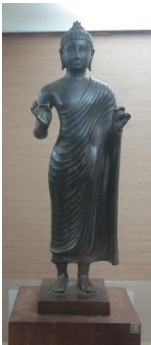
ภาพที่ 2.5 พระพุทธรูปแสดงปางประทานธรรม สมัยคุปตะ

5. ปางปรินิพพาน หรือ ปางไสยาสน์ เป็นพระพุทธรูปนอนตะแคงขวา หลังพระเนตร พระเศียรหนุนบนเขนย พระหัตถ์ขวารองรับพระเศียร พระกรซ้ายทอดยาวแนบองค์ พระบาทเหยียดปลายเสมอกันทั้งสองข้าง