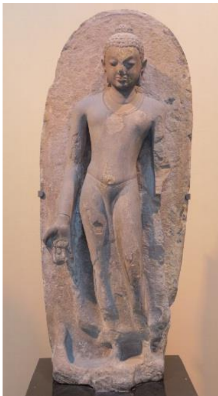
ภาพที่ 2.12 พระพุทธรูปแบบคุปตะ

เชษฐ ติงส์ญชลี (2554: 25) กล่าวว่า “ลักษณะร่วมของศิลปะแบบคุปตะ สกุลช่างมอญรา และสกุลช่างสาร์นาถ คือ รอบพระเศียรมีประภามณฑลขนาดใหญ่ประดับด้วยลายพันธุ์พฤกษา ถือเป็นรูปแบบเฉพาะของศิลปะคุปตะ” ศิลปะคุปตะสกุลช่างสาร์นาถ มีความเจริญขึ้นแถบเมืองสาร์นาถ รัฐอุตตรประเทศ ใกล้เมืองพาราณสี ประเทศอินเดีย มีลักษณะแตกต่างจากศิลปะคุปตะสกุลช่างมอญรา มีพระพักตร์สงบและ มีการออกแบบให้พระเนตรเหลือบลงต่ำทำให้ดูสงบมากขึ้นส่วนการครองจีวรบางเหมือนผ้าเปียกน้ำทำให้เป็นจีวรเรียบไม่มีริ้ว ดูบางแนบเนื้อยิ่งขึ้น พระพุทธรูปยืนแสดงปางประทานอภัยโดยพระหัตถ์ซ้ายจับชายจีวรลง และปางประทานพร ( วรทมุทรา ) ส่วนพระพุทธรูปนั่งนิยมปางปฐมเทศนา หรือธรรมจักรมุทรา ซึ่งเป็นมุทราที่ได้รับความนิยมอย่างมาก ส่วนที่เพิ่มเติมคือ ศิลปะคุปตะสกุลช่างสาร์นาถ มีประภาลีหรือประภามณฑล รอบพระวรกายเป็นรูปวงรี