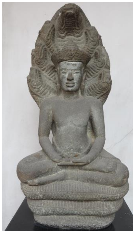
ภาพที่ 2.17 พระพุทธรูปขนาดปรกแบบลพบุรี ที่มา: พิพิธภัณฑ์สถานแห่งชาติ พระนคร

4. ศิลปะหริภุญชัย (ราวพุทธศตวรรษที่ 13 – 18) มีศูนย์กลางแถบจังหวัดลำพูน มีตำนานจามเทวีวงศ์ กล่าวถึงประวัติการสร้างอาณาจักรโดยฤาษีวาสุเทพสร้างเมืองหริภุญชัย และอัญเชิญพระนางจามเทวีธิดาจากเมืองละโว้ (ลพบุรี) ขึ้นปกครองอาณาจักร พระพุทธรูปได้รับอิทธิพลศิลปะพุกาม มีพระพักตร์เคร่งขรึม พระนลาฏกว้าง มีขอบพระเกศา (ขอบไรพระศก) พระเนตรโปน พระขนงต่อกันและยกเป็นสัน พระโอษฐ์หนาและกว้าง พระนาสิกแบนใหญ่ ขมวดพระเกศาเป็นเกลียวแหลม มีอุษณีษะทรงกรวยขนาดใหญ่ แสดงปางมารวิชัย นั่งขัดสมาธิเพชร มีชายผ้าที่หน้าตักตกลงมาเป็นริ้วซ้อนกันคล้ายพัด วัสดุที่ใช้ ทำด้วยศิลาแลงหุ้มปูน และทำจากดินเผา