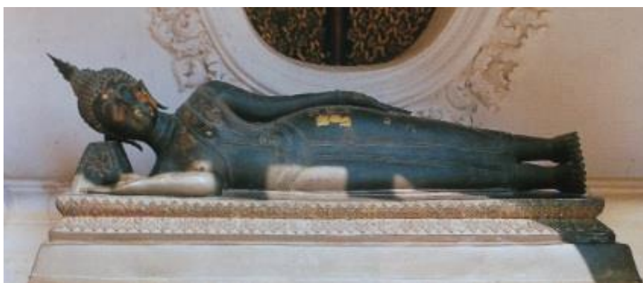
ภาพที่ 2.6 พระพุทธรูปปางปรินิพพาน

5. ปางปรินิพพาน หรือ ปางไสยาสน์ เป็นพระพุทธรูปนอนตะแคงขวา หลังพระเนตร พระเศียรหนุนบนเขนย พระหัตถ์ขวารองรับพระเศียร พระกรซ้ายทอดยาวแนบองค์ พระบาทเหยียดปลายเสมอกันทั้งสองข้าง