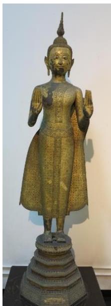
ภาพที่ 2.9 พระพุทธรูปแสดงปางประทานอภัย สมัยรัตนโกสินทร์