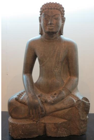
ภาพที่ 2.15 พระพุทธรูปปางมารวิชัยแบบทวารวดี

ลักษณะเฉพาะของทวารวดี ได้แก่พระพุทธรูปนั่งห้อยพระบาทแบบตะวันตก พบลักษณะพระพุทธรูปแบบนี้ในศิลปะแบบวาฏกะ-จาตุยกะตะวันตก ของอินเดียที่ถ้ำอชันตาลักษณะเด่นของพระพุทธรูปสมัยทวารวดี พระพุทธรูปมีพระพักตร์กลมแป้น พระขนงต่อกันเป็นรูปปีกกา พระนาสิกแบน พระโอษฐ์หนาแบน ขมวดพระเกศาใหญ่ อุษณิษะเตี้ย นิยมปางแสดงธรรม (วิตรรก มุทรา) (ศักดิ์ชัย สายสิงห์. 2554: 116)