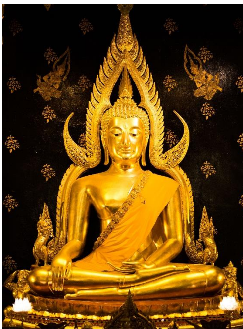
ภาพที่ 2.23 พระพุทธชินราช จังหวัดพิษณุโลก

การสร้างพระพุทธรูป ถือเป็นสิ่งสะท้อนว่าประเทศไทยรับเอาพระพุทธศาสนาจากประเทศอินเดียเข้ามายังประเทศไทย พระพุทธรูปที่สร้างขึ้นจึงมีพุทธลักษณะบางอย่างที่แสดงให้เห็นว่าเราได้นำลักษณะบางอย่างมาจากพระพุทธรูปของอินเดีย โดยเฉพาะคติความเชื่อ เรื่องมหาบุรุษลักษณะ 32 ประการ ในแต่ละยุคสมัยก็มีพุทธลักษณะที่ตรงตามเป็นเอกลักษณ์เฉพาะตัวที่บ่งบอกได้ว่าอยู่ในยุคสมัยใด โดยพระพุทธรูปในสมัยสุโขทัย มักจะได้รับการยอมรับว่ามีพุทธลักษณะตรงตามที่สุด ดังเช่น พระพุทธชินราช จังหวัดพิษณุโลก (ภาพที่ 2.23)