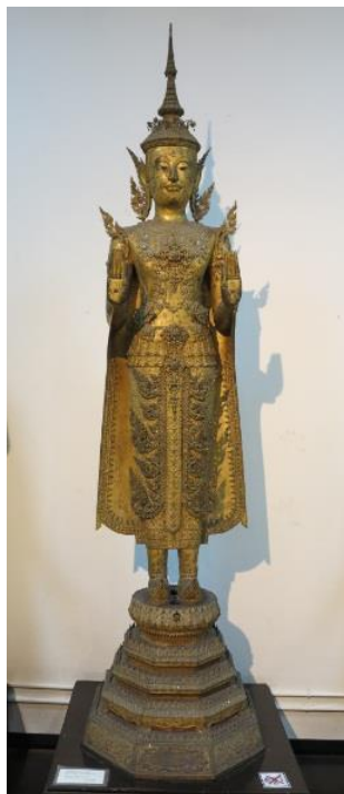
ภาพที่ 2.22 พระพุทธรูปทรงเครื่องจักรพรรดิ ศิลปะรัตนโกสินทร์ตอนต้น