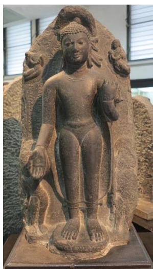
ภาพที่ 2.8 พระพุทธรูปแสดงปางประทานพร ศิลปะปาละ อินเดีย

6. ปางประทานอภัย หรือ อภัยมุทรา เป็นพระพุทธรูปยืนยกพระหัตถ์ป้องไปข้างหน้าจะเป็นข้างซ้าย ข้างขวา หรือทั้งสองข้าง โดยหันฝ่าพระหัตถ์ออกมาแสดงท่าอภัย