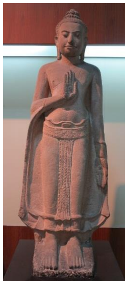
ภาพที่ 2.7 พระพุทธรูปแสดงปางประทานอภัย ศิลปะลพบุรี

6. ปางประทานอภัย หรือ อภัยมุทรา เป็นพระพุทธรูปยืนยกพระหัตถ์ป้องไปข้างหน้าจะเป็นข้างซ้าย ข้างขวา หรือทั้งสองข้าง โดยหันฝ่าพระหัตถ์ออกมาแสดงท่าอภัย