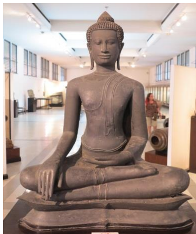
ภาพที่ 2.20 พระพุทธรูปอุ้มทอง

6. ศิลปะแบบสุโขทัย (ราวพุทธศตวรรษที่ 19–20) มีศูนย์กลางแถบลุ่มแม่น้ำยม ช่วงก่อนสถาปนาอาณาจักรสุโขทัย บริเวณส่วนนี้ตกอยู่ภายใต้การปกครองของอาณาจักรเขมร และในช่วงตอนปลายของอาณาจักรสุโขทัย ตกเป็นประเทศราชของอาณาจักรอยุธยา และภายหลังได้ผนวกเข้ากับอาณาจักรอยุธยา ถือได้ว่าเป็นยุคสมัยที่มีพุทธลักษณะงดงามที่สุด และมีการสร้างพระพุทธรูปทั้ง 4 อริยาบถ คือ ยืน เดิน (ลีลา) นั่ง นอน ลักษณะสำคัญ คือ นิยมแสดงปางมารวิชัย หล่อสำริด นั่งขัดสมาธิราบบนฐานกระดานเกลี้ยงพระวรกายเพรียวบาง พระอঙ্গสาใหญ่ บั้นพระองค์เล็ก พระพักตร์รูปไข่ ขมวดพระเกศาขนาดปานกลาง รัศมีรูป เปลวเพลิง พระเนตรเหลือบลงต่ำ พระนาสิกโด่ง พระขนงโก่ง แยมพระโอษฐ์เล็กน้อย ชายสังฆาฎิยาวจรดพระนาภีมีลักษณะเป็นเขี้ยวตะขาบ ครอบจีวรเรียบบางคล้ายผ้าเปียกน้ำ ปลายนิ้วพระหัตถ์ไม่เสมอกัน ส่วนพระพุทธรูปยืน (ลีลา) หล่อสำริด