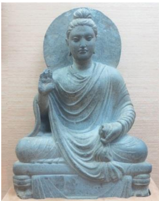
ภาพที่ 2.10 พระพุทธรูปแบบคันธาระ