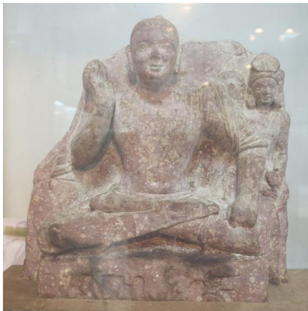
ภาพที่ 2.11 พระพุทธรูปแบบมถุรา

3. ศิลปะอมราวตี (พุทธศตวรรษที่ 7-10) อมราวตีเป็นชื่อเมือง ในรัฐอานธรประเทศทางตอนใต้ของอินเดีย ซึ่งมีการขุดค้นพบซากปรักหักพัง สร้างความเจริญที่เมืองอมราวตี นาคารชุนโกณฑะ (Nagarjunakonda) และโกลิ (Goli) พระพุทธรูปในสมัยนี้ นิยมสร้างขึ้นจากหินโดโลไมต์ (Dolomite) ซึ่งมีส่วนประกอบของคาร์บอเนตมากจึงทำให้มีสีขาวหรือสีครีม นิยมพระพุทธรูปนาคปรก นิยมแสดงปางประทานอภัย มีทั้งอริยาบถนั่งและยืน ลักษณะสำคัญ คือ พระพุทธรูปยืนมีการจับชายจีวรยกขึ้นมาพาดพระกรซ้ายขวานานกัน พระเศียรมีลักษณะยาวรี พระเกศาขมวดเป็นก้อนหอย ตามลักษณะของคนพื้นเมืองในอินเดียตอนใต้ อุษณีษะตำการครองจีวรห่มเฉียงเป็นริ้วธรรมชาติทั้งองค์