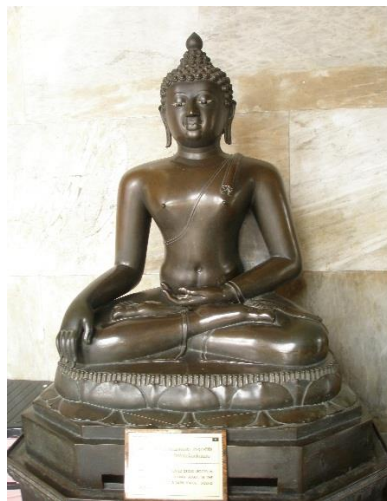
ภาพที่ 2.18 พระศากยสิงห์ นั่งขัดสมาธิเพชร ปางมารวิชัย สมัยเชียงแสน

5. ศิลปะเชียงแสน - ล้านนา (ราวพุทธศตวรรษที่ 19 – 23 ) อาณาจักรล้านนาเป็นการรวบรวมแว่นแคว้นและอาณาจักรทางภาคเหนือให้มีศูนย์กลางที่จังหวัดเชียงใหม่ โดยเป็นอาณาจักรร่วมสมัยกับอาณาจักรสุโขทัย ช่วงแรกราวพุทธศตวรรษที่ 19 พบทั้งพระพุทธรูปปางมารวิชัยนั่งขัดสมาธิเพชร และนั่งขัดสมาธิราบพระวรกายอวบอ้วน ชายสังฆาฏิสั้นเป็นเขี้ยวตะขาบเหนือพระถัน นิยมหล่อด้วยสำริด พระพักตร์กลม แยมพระโอษฐ์เล็กน้อย รัศมีเป็นดอกบัวตูม ขมวดพระเกศาใหญ่ นิยมเรียกว่า “พระพุทธรูปเชียงแสน” แสดงอิทธิพลของศิลปะพุกาม ช่วงหลังราวพุทธศตวรรษที่ 20–21มีการติดต่อกับอาณาจักรสุโขทัย แสดงอิทธิพลของศิลปะสุโขทัย คือนิยมแสดงพระหัตถ์แบบปางมารวิชัยนั่งขัดสมาธิราบ มีพระพักตร์รูปไข่ เหนืออุษณีษะมีพระรัศมีเปลวเพลิง ชายสังฆาฏิทอดยาวมาจรด พระนาภี มีขมวดพระเกศาเล็ก