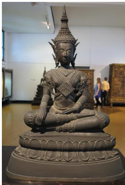
ภาพที่ 2.21 พระพุทธรูปทรงเครื่อง สมัยอยุธยา

ภายหลังในสมัยอยุธยาตอนต้น พบว่าได้รับอิทธิพลจากสุโขทัย คือมีพระพักตร์รูปไข่ พระขนงโก่ง ชายสังฆาฏิเป็นเขี้ยวตะขาบจรดพระนาภี รัศมีเป็นเปลวสูง ช่วงสมัยอยุธยาตอนกลาง ได้รับอิทธิพลจากสุโขทัย มีพระเกศาเล็กมาก เรียกว่า “แบบหนามขนุน” พระโอษฐ์แบะกว้างเกือบเป็นเส้นตรง ชายสังฆาฏิเป็นแผ่นปลาย คล้ายเขี้ยวตะขาบ พระเนตรเรียว พระนาสิกยาว รัศมีเป็นเปลว พบพระพุทธรูปที่มีลักษณะเด่น คือ พระพุทธรูปทรงเครื่องน้อย หมายถึงมีเครื่องทรง เช่น มงกุฎ กรรเจียกจร กุณฑล กรองคอ สังวาล ทับทรวง ทองพระกร ส่วนช่วงสมัยตอนปลาย นิยมสร้างพระพุทธรูปทรงเครื่องใหญ่อย่างพระมหาจักรพรรดิ คือมีเครื่องทรง มาก เช่น มหามงกุฎ พาหุรัต พระพักตร์ยาวและใหญ่ พระขนงโก่งและตั้งขึ้น ปลายพระเนตรตวัดขึ้นพระนาสิกใหญ่และโด่ง พระโอษฐ์ใหญ่และกว้าง หยักคล้ายกระจับลักษณะแยมพระโอษฐ์