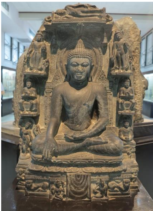
ภาพที่ 2.13 พระพุทธรูปแบบปาละ

9. ศิลปะกัมพูชา ( พุทธศตวรรษที่ 14-18 ) เป็นศิลปะสกุลช่างฝ่ายเหนือของอินเดียใกล้แคว้นคันธาระ มีศูนย์กลางที่รัฐกัมพูชา ได้รับการอุปถัมภ์โดยราชวงศ์การโกฏและอูตปาละ ได้รับอิทธิพลศิลปะคุปตะและศิลปะปาละ มีลักษณะสำคัญ คือ มีพระเศวตขมวดก้นหอย พระพุทธรูปยืนมีจีวรริ้วประดิษฐ์รูปตัว U พระเพลาเป็นจีวรเรียบ การตกแต่งคล้ายรูปพระโพธิสัตว์ คือ สวมมงกุฏ จีวรเป็นริ้วมีขอบหนารอบพระศอก พระพุทธรูปนั่งมีจีวรเป็นริ้วทั้งองค์คล้ายศิลปะคันธาระ