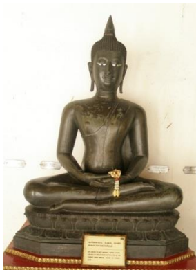
ภาพที่ 2.2 พระพุทธรูปปางสมาธิ นั่งขัดสมาธิราบ สมัยเชียงแสน

2. วีราสนะ (ขัดสมาธิราบ) คือการนั่งโดยใช้พระบาทขวาทับพระเพลาซ้าย จึงเห็นฝ่าพระบาทเพียงข้างเดียว