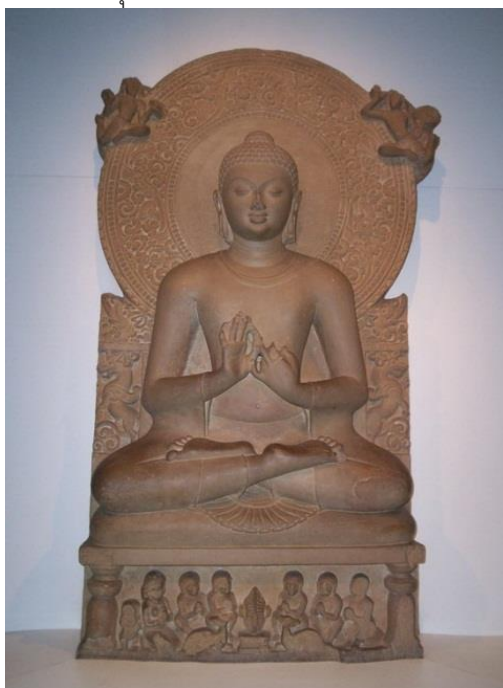
ภาพที่ 2.14 พระพุทธรูปปางปฐมเทศนา สมัยคุปตะ ในพิพิธภัณฑสถานเมืองสารนาถ

นอกจากนี้ในศิลปะสกุลช่างมอราและสกุลช่างสารนาถในสมัยคุปตะ เกี่ยวกับเรื่องนี้ (เชษฐ ติงส์ณูชลี , 2554 , น.17 ) ได้แสดงความเห็นว่า ทำนั้งขัดสมาธิเกี่ยวข้องกับนักบวช ซึ่งขัดสมาธิราบนิยมในอินเดียใต้ และขัดสมาธิเพชรนิยมในอินเดียตอนเหนือ ส่วนทำนั้งห้อยพระบาทกลับเป็นอิริยาบถของกษัตริย์ ซึ่งนิยมกันในอินเดียเหนือ เริ่มตั้งแต่สมัยคุปตะลงมา นอกจากนี้อินเดียตอนเหนือยังนิยมแสดง ภูมิสถาปัตยกรรมและธรรมจักรมูทรา