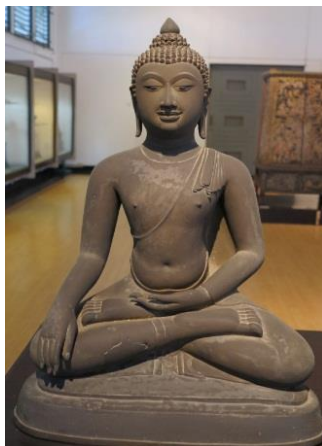
ภาพที่ 2.1 พระพุทธรูปปางมารวิชัย นั่งขัดสมาธิเพชร สมัยอยุธยา

อิริยาบถประทับนั่ง แบ่งออกเป็น 3 ลักษณะ คือ