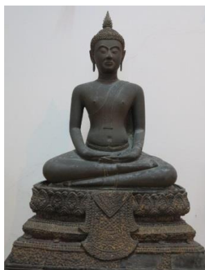
ภาพที่ 2.4 พระพุทธรูปแสดงปางสมาธิ หรือ ฌยานมุทรา สมัยรัตนโกสินทร์

2. ปางสมาธิ หรือ ฌยานมุทรา เป็นพระพุทธรูปนั่งขัดสมาธิ หงายพระหัตถ์ทั้งสอง พระหัตถ์ขวาซ้อนพระหัตถ์ซ้ายอยู่บนพระเพลา แสดงพระอิริยาบถบำเพ็ญสมาธิจิต