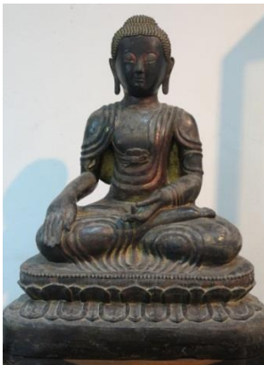
ภาพที่ 2.3 พระพุทธรูปแสดงปางมารวิชัยภูมิสปรมุทรา

1. ปางมารวิชัย ปางผจญมาร หรือ ภูมิสปรมุทรา เป็นพระพุทธรูปนั่งขัดสมาธิ พระหัตถ์ซ้ายหงายบนพระเพลา พระหัตถ์ขวาวางคว่ำลงบนพระชานุ นิ้วพระหัตถ์ชี้ลงธรณี