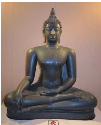
ภาพที่ 2.19 พระพุทธรูปปางมารวิชัยแบบสุโขทัย

5. ศิลปะเชียงแสน - ล้านนา (ราวพุทธศตวรรษที่ 19 – 23 ) อาณาจักรล้านนาเป็นการรวบรวมแว่นแคว้นและอาณาจักรทางภาคเหนือให้มีศูนย์กลางที่จังหวัดเชียงใหม่ โดยเป็นอาณาจักรร่วมสมัยกับอาณาจักรสุโขทัย ช่วงแรกราวพุทธศตวรรษที่ 19 พบทั้งพระพุทธรูปปางมารวิชัยนั่งขัดสมาธิเพชร และนั่งขัดสมาธิราบพระวรกายอวบอ้วน ชายสังฆาฏิสั้นเป็นเขี้ยวตะขาบเหนือพระถัน นิยมหล่อด้วยสำริด พระพักตร์กลม แยมพระโอษฐ์เล็กน้อย รัศมีเป็นดอกบัวตูม ขมวดพระเกศาใหญ่ นิยมเรียกว่า “พระพุทธรูปเชียงแสน” แสดงอิทธิพลของศิลปะพุกาม ช่วงหลังราวพุทธศตวรรษที่ 20–21มีการติดต่อกับอาณาจักรสุโขทัย แสดงอิทธิพลของศิลปะสุโขทัย คือนิยมแสดงพระหัตถ์แบบปางมารวิชัยนั่งขัดสมาธิราบ มีพระพักตร์รูปไข่ เหนืออุษณีษะมีพระรัศมีเปลวเพลิง ชายสังฆาฏิทอดยาวมาจรด พระนาภี มีขมวดพระเกศาเล็ก