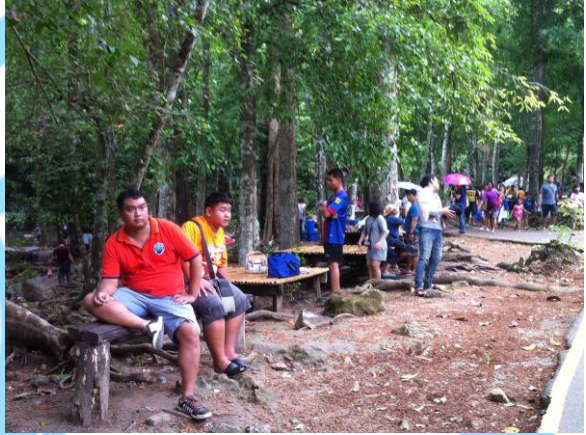
รูปภาพ 1 การสัมภาษณ์การเก็บข้อมูลงานวิจัยเชิงคุณภาพ (In - depth interview)