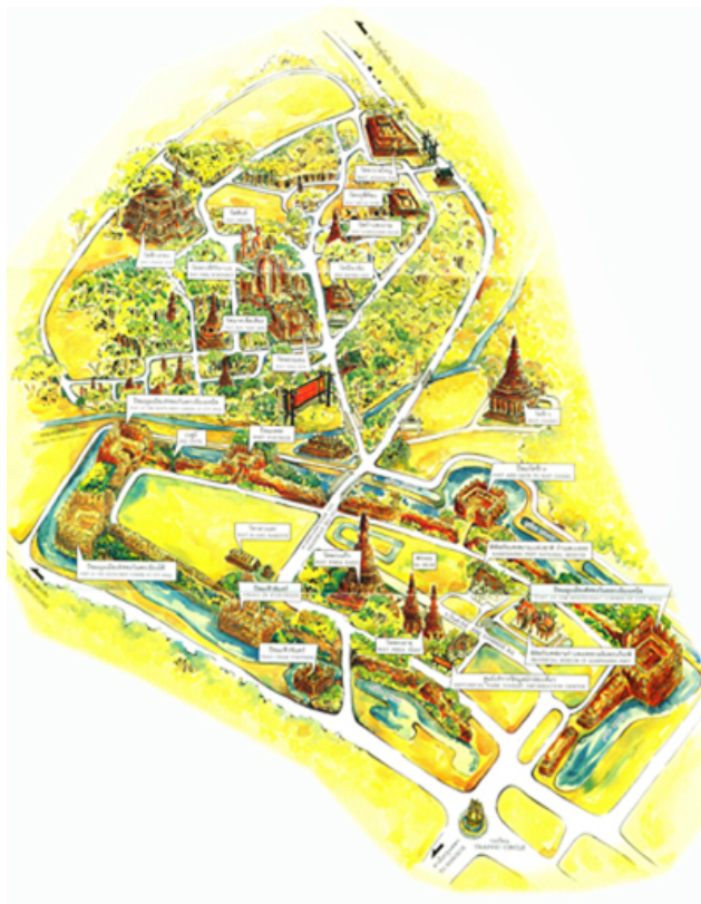
ภาพที่ 1.2 อุทยานประวัติศาสตร์กำแพงเพชร

อาณาจักรล้านนา คือ ราชอาณาจักรของชาวไทยวนในอดีตที่ตั้งอยู่บริเวณภาคเหนือตอนบนของประเทศไทย ตลอดจนถึงสองปีนนา เช่น เมืองเชียงใหม่ (จังหวัด) มณฑลยูนนาน ภาคตะวันออกเฉียงเหนือของพม่า ฝั่งตะวันออกเฉียงเหนือของแม่น้ำสาละวิน ซึ่งมีเมืองเชียงตุงเป็นเมืองเอก ฝั่งตะวันตกแม่น้ำสาละวิน มีเมืองน่านเป็นเมืองเอก และ 8 จังหวัด ได้แก่ จังหวัดเชียงใหม่ ลำพูน ลำปาง เชียงราย พะเยา แพร่ น่านและแม่ฮ่องสอน โดยมีเมืองเชียงใหม่เป็นราชธานี มีภาษา ตัวหนังสือ วัฒนธรรม และประเพณีเป็นของตนเอง ต่อมาถูกปกครองในฐานะรัฐบรรณาการของอาณาจักรตองอู อาณาจักรอยุธยาและอาณาจักรอังวะ จนสิ้นฐานะอาณาจักร กลายเป็นเมืองส่วนหนึ่งของอาณาจักรอังวะในราชวงศ์นยองยานไปในที่สุด