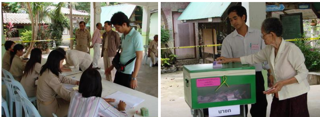
ภาพที่ 2.2 ตัวอย่างการเลือกตั้งนายกเทศมนตรีและสมาชิกสภาเทศบาลตำบลบ้านนา อำเภอบ้านนา จังหวัดนครนายก

องค์กรปกครองส่วนท้องถิ่นย่อมได้รับการส่งเสริมและสนับสนุนให้มีความเข้มแข็งในการบริหารงานได้โดยอิสระและตอบสนองต่อความต้องการของประชาชนในท้องถิ่นได้อย่างมีประสิทธิภาพ สามารถพัฒนาระบบการคลังท้องถิ่นให้จัดบริการสาธารณะได้โดยครบถ้วนตามอำนาจหน้าที่ จัดตั้งหรือร่วมกันจัดตั้งองค์การเพื่อการจัดทำบริการสาธารณะตามอำนาจหน้าที่ เพื่อให้เกิดความคุ้มค่าเป็นประโยชน์ และให้บริการประชาชนอย่างทั่วถึงให้มีกฎหมายกำหนดแผนและขั้นตอนการกระจายอำนาจเพื่อกำหนดการแบ่งอำนาจหน้าที่และจัดสรรรายได้ระหว่างราชการส่วนกลางและราชการส่วนภูมิภาคกับองค์กรปกครองส่วนท้องถิ่นและระหว่างองค์กรปกครองส่วนท้องถิ่นด้วยกันเองโดยคำนึงถึงการกระจายอำนาจเพิ่มขึ้นตามระดับความสามารถขององค์กรปกครองส่วนท้องถิ่นแต่ละรูปแบบรวมทั้งกำหนดระบบตรวจสอบและประเมินผลโดยมีคณะกรรมการประกอบด้วยผู้แทนหน่วยราชการที่เกี่ยวข้องกับผู้แทนองค์กรปกครองส่วนท้องถิ่นและผู้ทรงคุณวุฒิโดยมีจำนวนเท่ากันเป็นผู้ดำเนินการให้เป็นไปตามกฎหมาย