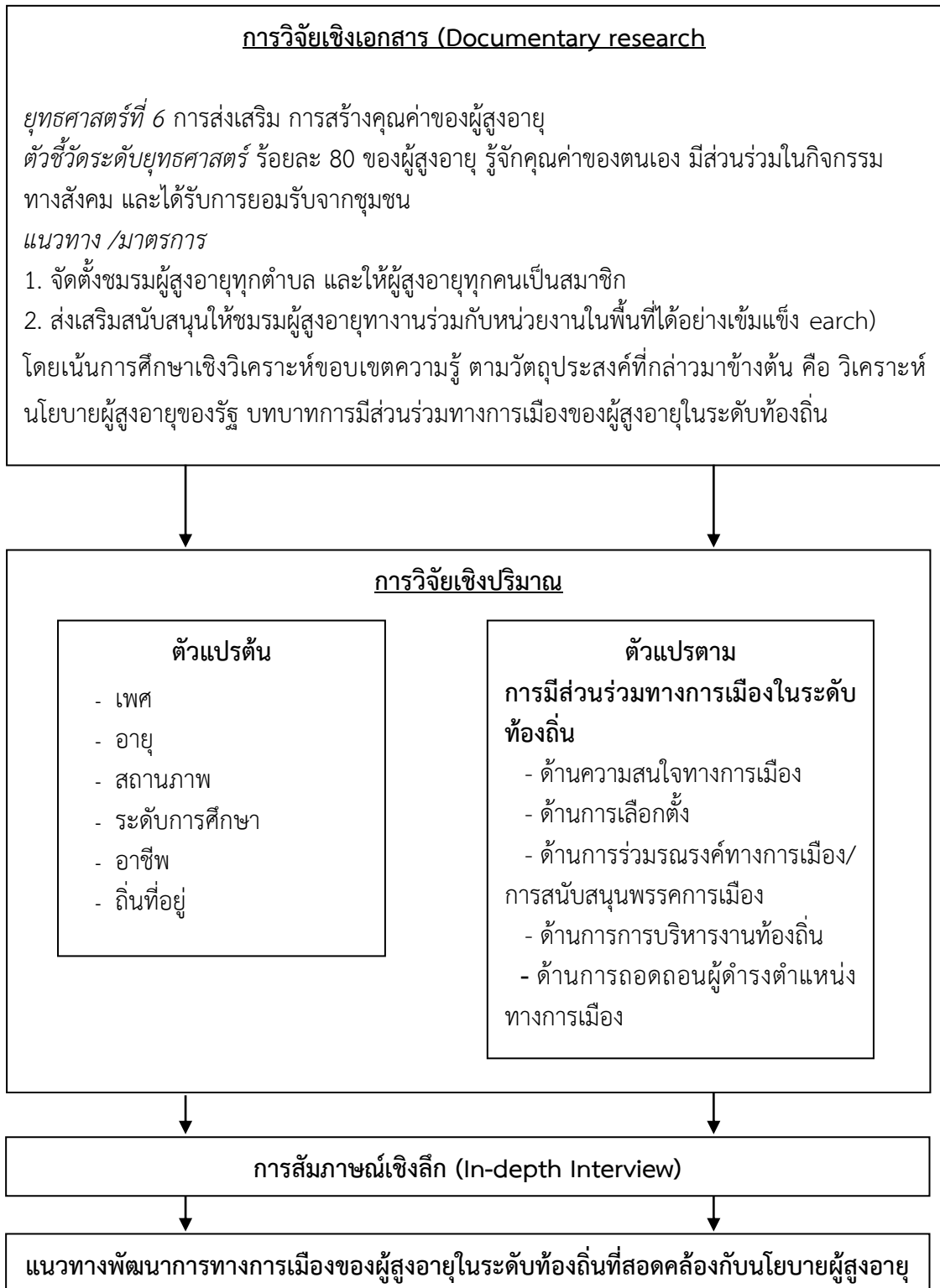
ภาพที่ 2.3 กรอบแนวคิดในการวิจัย

กรอบแนวคิดของการดำเนินโครงการวิจัยดังมีรายละเอียดดังนี้