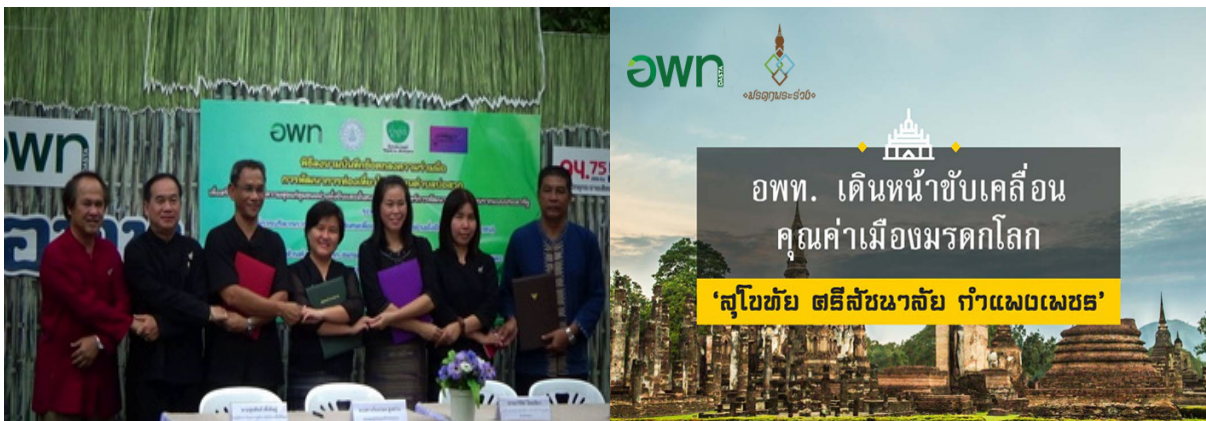
ภาพที่ 2 กลุ่มเป้าหมายการนำผลการวิจัยไปใช้ประโยชน์

1. องค์กรบริหารการพัฒนาพื้นที่พิเศษเพื่อการท่องเที่ยวอย่างยั่งยืน (องค์การมหาชน) (อพท.) ในส่วนกลาง และในสำนักงานพื้นที่พิเศษต่างๆ ได้แก่ อพท. พื้นที่พิเศษเมืองเก่าชาน และ อพท. พื้นที่พิเศษเพื่อ การท่องเที่ยวอย่างยั่งยืนอุทยานประวัติศาสตร์สุโขทัย - ศรีสัชนาลัย - กำแพงเพชร นำองค์ความรู้ที่ได้จากการวิจัยไปใช้ในการกำหนดนโยบายในการพัฒนาพื้นที่พิเศษเพื่อการท่องเที่ยวอย่างยั่งยืนให้มีประสิทธิภาพ สามารถสร้างคุณค่าเมืองมรดกโลกได้แท้จริง