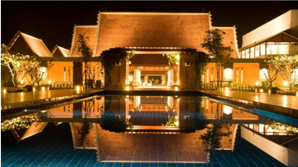
ภาพที่ 3 สถานที่แสดงผลงานวิจัย

1. จัดงานประชุมแสดงผลการวิจัย “การศึกษาศักยภาพของแหล่งท่องเที่ยวเชิงประวัติศาสตร์และเชิงวัฒนธรรมของอารยธรรมล้านนา (พะเยา แพร่ น่าน) และสุโขทัย (กำแพงเพชร สุโขทัย)” ภายใต้แผนงานวิจัย เรื่อง “การพัฒนาศักยภาพการท่องเที่ยวเพื่อเชื่อมโยงประวัติศาสตร์อารยธรรมล้านนาและสุโขทัยกับประเทศเพื่อนบ้านในภูมิภาคอาเซียน” ณ จังหวัดสุโขทัย โดยมีผู้เข้าร่วมงานซึ่งเป็นกลุ่มเป้าหมายทั้งสิ้นจำนวน 100 คน จัดขึ้นเป็นเวลา 1 วัน ณ โรงแรม สุโขทัย เฮริเทจ โดยมีหัวข้อในการบรรยายและเสวนา ดังนี้