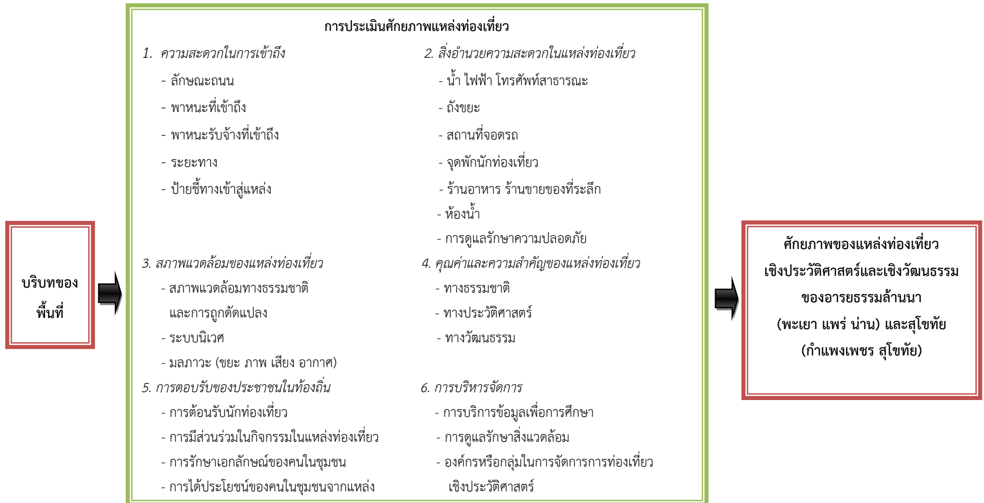
ภาพที่ 2.3 กรอบแนวคิดในการวิจัย