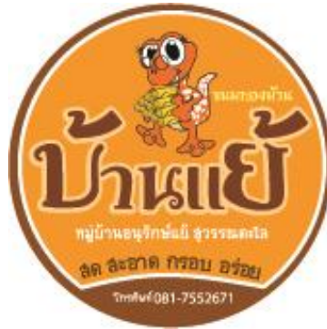
ภาพที่ 3.3 แบบ A ถุงใส่ติดสติ๊กเกอร์ขนาดเล็ก

3. ขั้นตอนการออกแบบ 2 มิติ บรรจุภัณฑ์และตราสัญลักษณ์ ขนมทองม้วนหมูบ้านแย์ โดยการสร้างตัวอย่างบรรจุภัณฑ์ขนมทองม้วน 4 แบบทางเลือก ดังนี้ แบบ A ถุงใส่ติดสติ๊กเกอร์ขนาดเล็ก แบบ B ถุงใส่ติดสติ๊กเกอร์ขนาดใหญ่ แบบ C ถุงใส่ คัดแถบกระดาษ และแบบ D ถุงใส่ในกล่องกระดาษหุ้มหี