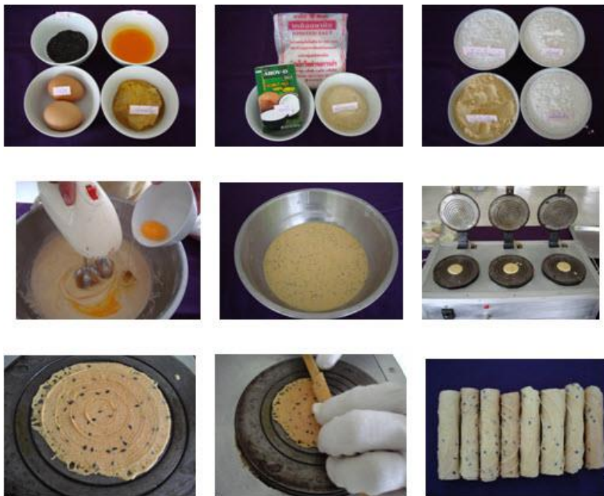
ภาพที่ 3.2 วัตถุดิบ วัสดุ และอุปกรณ์ทำทองม้วน