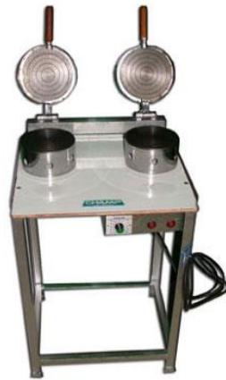
ภาพที่ 3.1 เครื่องทำทองม้วนไฟฟ้า