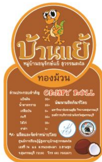
ภาพที่ 3.4 แบบ B ถุงใส่ติดสติ๊กเกอร์ขนาดใหญ่