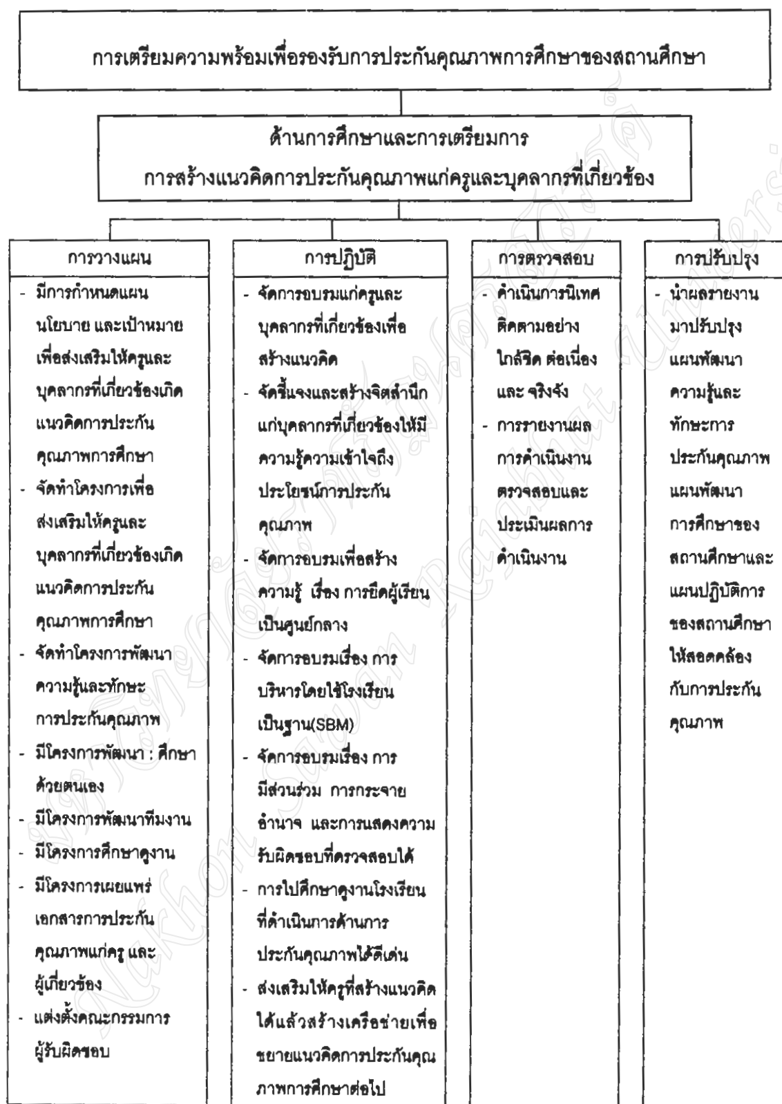
ภาพที่ 4.1 รูปแบบการเตรียมความพร้อมเพื่อรองรับการประกันคุณภาพการศึกษาของสถานศึกษา ด้านการศึกษาและการเตรียมการ