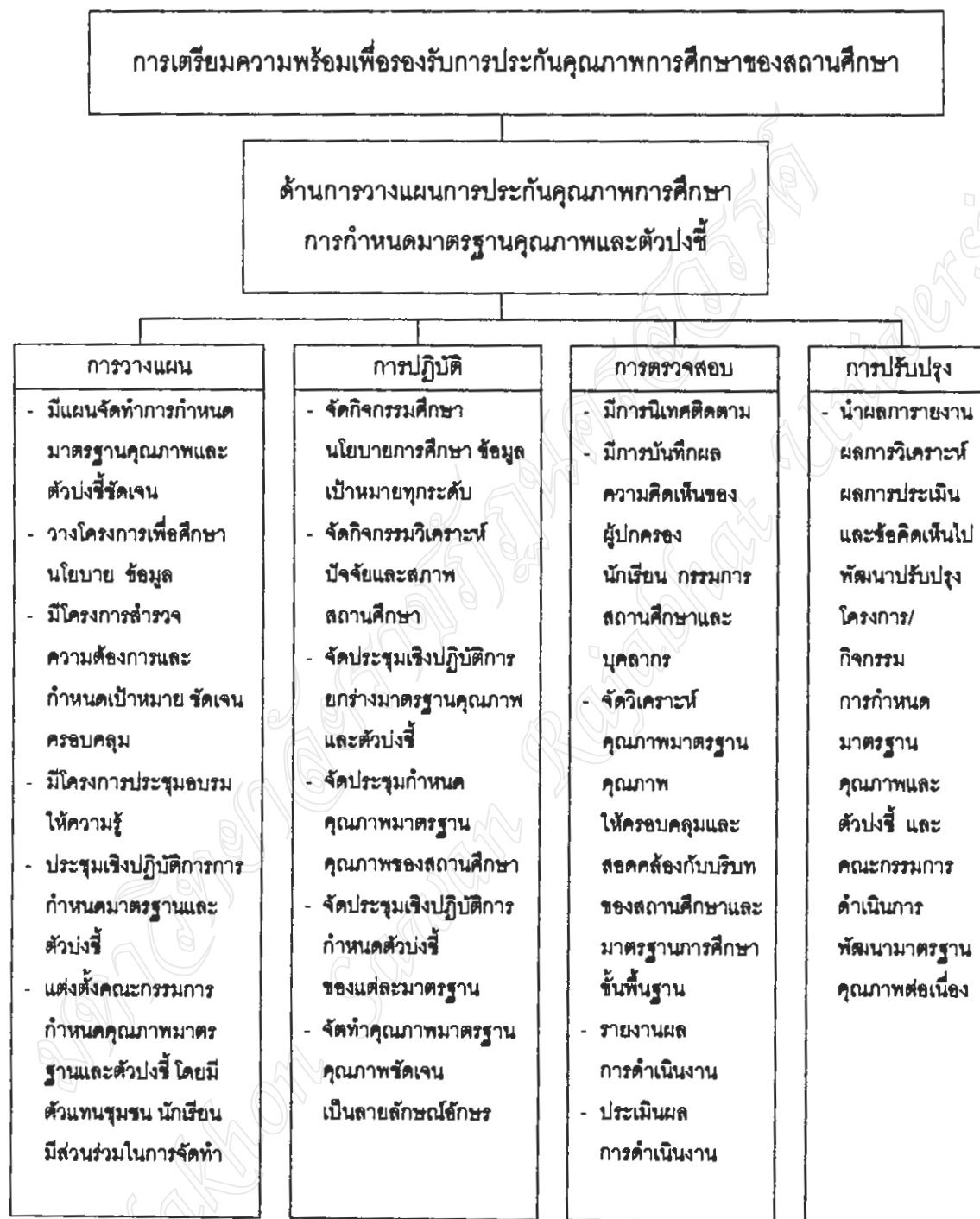
ภาพที่ 4.2 รูปแบบการเตรียมความพร้อมเพื่อรองรับการประกันคุณภาพการศึกษาของสถานศึกษา ด้านการวางแผนการประกันคุณภาพการศึกษา