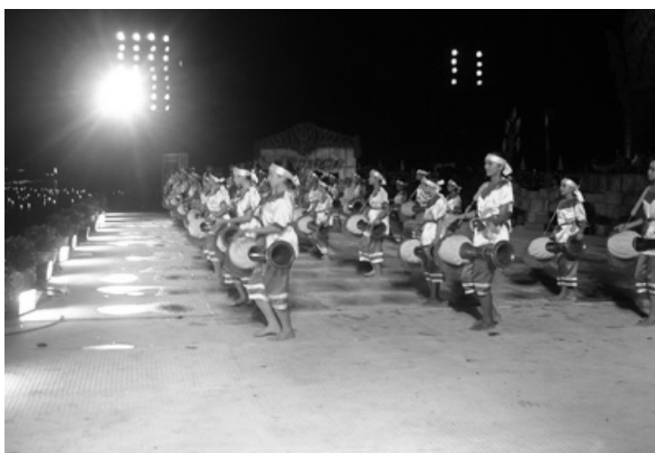
ภาพที่ 4.18 การแสดงกลองยาวในพิธีเปิดการแข่งขันกีฬา (ภาพโดย พิเศษ ภัทรพงษ์ ณ โรงยิมเนเซียมสนามกีฬาากลางจังหวัดนครสวรรค์ อ.เมืองนครสวรรค์ จ.นครสวรรค์ เมื่อวันที่ 2 พฤษภาคม 2550)

การแสดงกลองยาวในจังหวัดนครสวรรค์ ประสบกับความเปลี่ยนแปลงมาโดยตลอด จากเคยได้รับความนิยมสูงสุดแล้วกลับเสื่อมความนิยมไปตามกาลเวลา อย่างไรก็ตามนับเป็นโอกาสดีของชาวนครสวรรค์ เมื่อรัฐบาลได้จัดตั้งศูนย์วัฒนธรรมจังหวัดนครสวรรค์ขึ้นเมื่อ พ.ศ.2535 และมีการจัดตั้งหน่วยงานต่าง ๆ ที่มีหน้าที่หรือมีภารกิจงานเกี่ยวข้องกับการอนุรักษ์ และส่งเสริมศิลปวัฒนธรรมของไทยเพิ่มขึ้นมา เช่น สำนักงานวัฒนธรรมจังหวัดนครสวรรค์ สภาวัฒนธรรมจังหวัดนครสวรรค์ ศูนย์วัฒนธรรมตำบลเขาทอง องค์การบริหารส่วนจังหวัดนครสวรรค์ องค์การบริหารส่วนตำบล (อบต.) และเทศบาลต่าง ๆ ที่ได้จัดตั้งขึ้นมาภายหลัง หน่วยงานทั้งภาครัฐบาลและเอกชนได้ร่วมมือกันฟื้นฟูศิลปวัฒนธรรมพื้นบ้านนครสวรรค์ โดยเฉพาะสถานศึกษาหลายสถาบันได้จัดให้มีการแสดงพื้นบ้านจังหวัดนครสวรรค์ ในหลักสูตรการเรียนการสอนทั้งในระดับประถมศึกษา มัธยมศึกษา และอุดมศึกษา มีการจัดให้การแสดงพื้นบ้านเป็นส่วนหนึ่งของกิจกรรมต่าง ๆ ในสังคม เช่น ใช้เป็นการแสดงในพิธีเปิดหรือปิดการแข่งขันกีฬาของหน่วยงานต่าง ๆ (ภาพที่ 4.18) ใช้เป็นการแสดงในการต้อนรับหัวหน้าหน่วยงานราชการ บุคคลหรือคณะบุคคลสำคัญที่มาเยือน ใช้แสดงในพิธีเปิดงานหรือแสดงค่านายการในการประกวดเทพีหรือประกวดสาวงามในระดับต่าง ๆ ของจังหวัดนครสวรรค์และระดับประเทศ นอกจากนี้ยังได้ร่วมมือกันจัดให้มีการประกวดการแสดงพื้นบ้าน ทำให้เยาวชนรุ่นหลังตลอดจนชุมชนมีโอกาสได้รับรู้และร่วมมือในการส่งเสริม อนุรักษ์ และเผยแพร่ศิลปวัฒนธรรมท้องถิ่นให้ดำรงอยู่คู่กับชุมชนนครสวรรค์และเป็นมรดกของชาติสืบไป