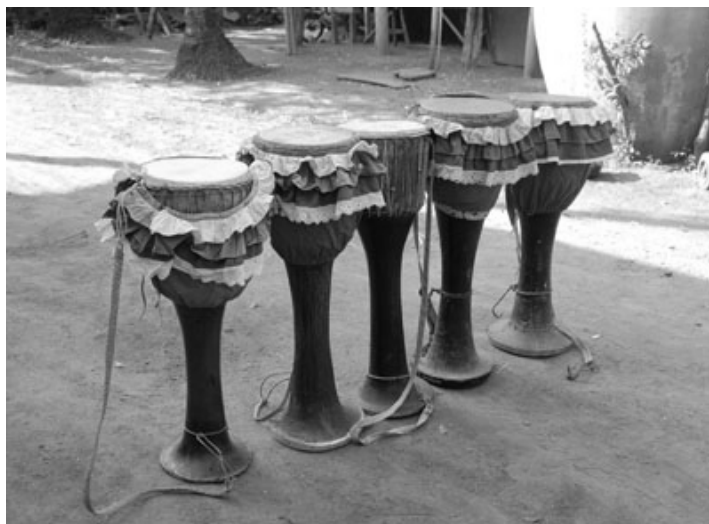
ภาพที่ 4.20 กลองยาวของคณะนายล้วน จิวสุข

กลองยาวที่ใช้ดีให้จังหวะของคณะนายล้วน จิวสุข ใช้กลองจำนวน 5 ลูก (ภาพที่ 4.20)