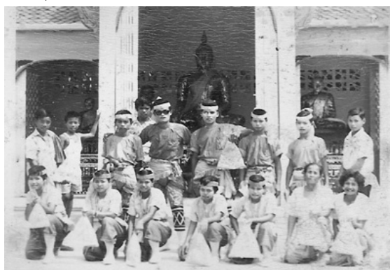
ภาพที่ 4.15 ผู้แสดงกลองยาวคณะบุญมาศิลป์ในอดีต