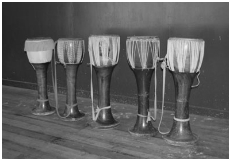
ภาพที่ 4.23 กลองยาวของคณะเขาทอง

กลองยาวที่ใช้ตีให้จังหวะของคณะเขาทอง ใช้กลองจำนวน 5 ลูก (ภาพที่ 4.23) กลองทั้งหมดเป็นกลองใหม่ที่ซื้อมาจากอำเภอป่าโมก จังหวัดอ่างทอง ประมาณ พ.ศ.2535 ไม้ที่ใช้ทำกลองเป็นไม้ขนุน รายละเอียดลักษณะทางกายภาพของกลองยาวคณะเขาทอง แสดงในตารางที่ 4.4