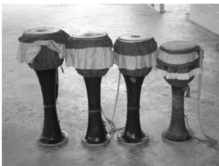
ภาพที่ 4.22 กลองยาวของคณะประพิษ รุ่งเรืองศิลป์

กลองยาวที่ใช้ตีให้จังหวะของคณะประพิษ รุ่งเรืองศิลป์ ใช้กลองจำนวน 4 ลูก (ภาพที่ 4.22) กลองยาวทั้งหมดสร้างโดยนายบุญ เอี่ยมเวช อดีตหัวหน้าคณะกลองยาว คณะ บ.รุ่งเรืองศิลป์ ซึ่งปัจจุบันได้เสียชีวิตแล้ว เป็นกลองเก่าที่สร้างประมาณปี พ.ศ.2507 มีการบำรุงรักษาเป็นอย่างดี สภาพใช้งานได้ ไม่ที่ใช้ทำกลองเป็นไม้ขนุน รายละเอียดลักษณะทางกายภาพของกลองยาวคณะประพิษ รุ่งเรืองศิลป์ แสดงในตารางที่ 4.3