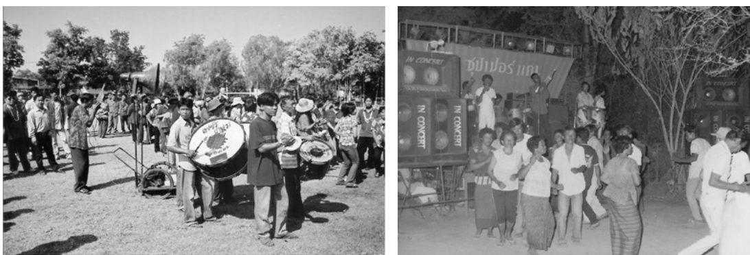
ภาพที่ 4.17 การแสดงแคนวงประยุกต์

ตั้งแต่ พ.ศ.2524 เป็นต้นมาได้เกิดสภาวะการยุบเลิกคณะกลองยาวอาชีพหลายคณะ ในจังหวัดนครสวรรค์ ปัจจัยที่สำคัญมาจากการเสื่อมความนิยมในศิลปวัฒนธรรมดั้งเดิมของไทย อันเป็นผลมาจากจากแผนพัฒนาประเทศไปสู่ความทันสมัย ความเจริญของสาธารณูปโภคและเทคโนโลยี เช่น ถนน ไฟฟ้า เครื่องรับโทรทัศน์ ตู้เย็น รถไถนา ได้เข้าสู่ชุมชนต่าง ๆ ทำให้วัฒนธรรมของชาติตะวันตกได้แพร่หลายเข้าสู่ชุมชนอย่างรวดเร็ว เกิดผลกระทบต่องานทำให้คนรุ่นใหม่หันมานิยมวัฒนธรรมของต่างชาติ ศิลปะพื้นบ้านขาดเวทีสนับสนุน มีงานการแสดงน้อยลงมาก จนไม่สามารถที่จะยึดเป็นอาชีพหลักในการดำรงตนได้ มีคนสนใจสืบทอดศิลปะกลองยาวน้อยมาก กอปรกับเจ้าของคณะกลองยาวได้เสียชีวิตลงในช่วงเวลาไล่เลี่ยกันและไม่มีผู้สืบทอดการแสดงต่อ ผู้ที่เป็นนักแสดงเดิมมีอายุมากขึ้นและเมื่อแต่งงานมีครอบครัวแล้วได้หยุดแสดง เหตุเพราะเปลี่ยนอาชีพ ย้ายถิ่น หรือติดภารกิจในการดูแลครอบครัว นอกจากนี้ยังเกิดความนิยมการแสดงแคนวงประยุกต์ (ภาพที่ 4.17) ที่เข้ามาแทนที่การแสดงกลองยาว เนื่องจากสามารถเล่นเพลงได้หลายประเภทและมีจังหวะดนตรีทันสมัยถูกใจผู้ฟัง มีเสียงดนตรีดังกว่ากลองยาวเนื่องจากใช้เครื่องขยายเสียงช่วย และค่าจ้างการแสดงถูกกว่าการจ้างกลองยาวแสดงเนื่องจากใช้จำนวนผู้แสดงน้อยกว่า ปัจจัยเหล่านี้เป็นสาเหตุให้คณะกลองยาวต่าง ๆ ทอยยกกันยุบเลิกคณะของตนไป ในที่สุด ปัจจุบันคงเหลือคณะกลองยาวอาชีพที่ยังดำเนินการแสดงกลองยาวเป็นอาชีพเพียง 2 คณะ คือ คณะนายถ้วน จิวสุข ที่ตำบลสระทะเล และคณะประพิช รุ่งเรืองศิลป์ ที่ตำบลพยุหะ อำเภอพยุหะคีรี จังหวัดนครสวรรค์ โดยทั้งสองคณะนี้มีการแสดงเต็มรูปแบบทั้งกลองยืนและกลองรำ