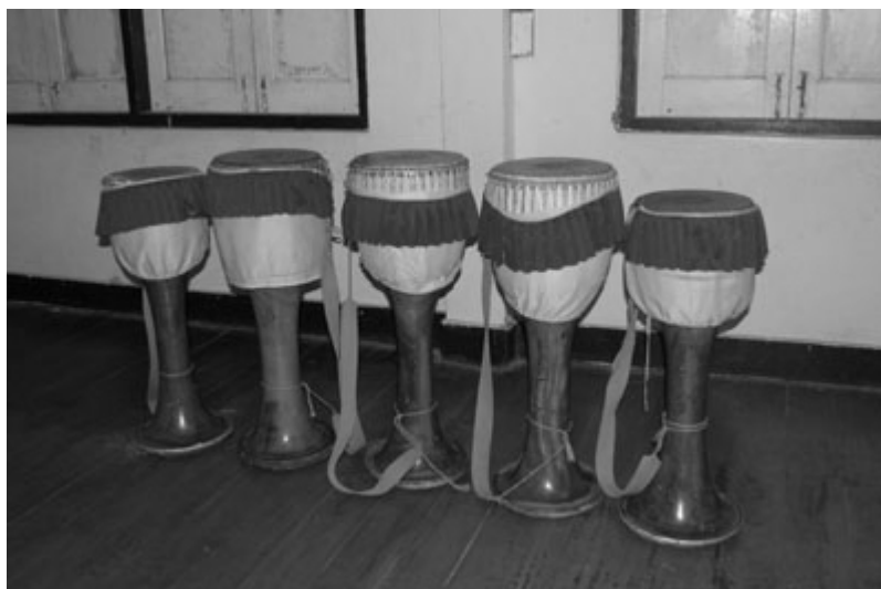
ภาพที่ 4.21 กลองยาวของคณะบุญมาศิลป์

กลองยาวที่ใช้ตีให้จังหวะของคณะบุญมาศิลป์ใช้กลองจำนวน 5 ลูก (ภาพที่ 4.21) กลองทั้งหมดเป็นกลองใหม่ที่ซื้อมาจากอำเภอป่าโมก จังหวัดอ่างทอง ประมาณ พ.ศ.2545 ไม้ที่ใช้ทำกลองเป็นไม้ขนุน รายละเอียดลักษณะทางกายภาพของกลองยาวคณะบุญมาศิลป์ แสดงในตารางที่ 4.2