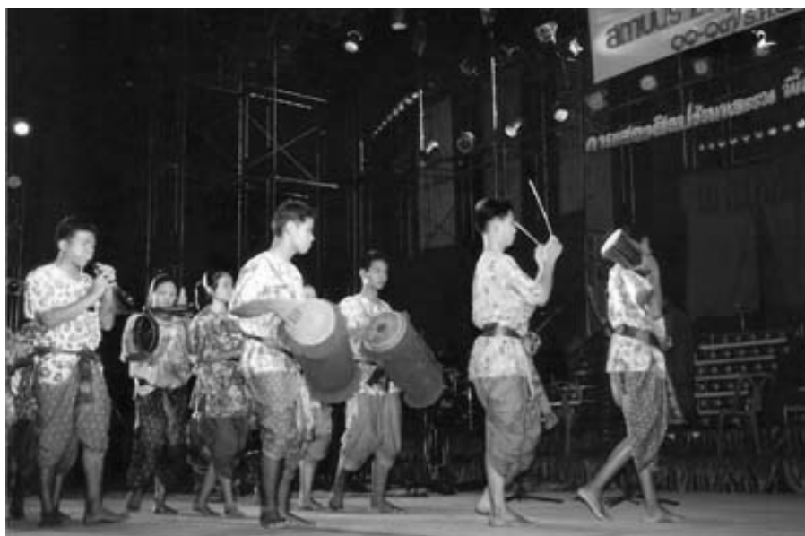
ภาพที่ 4.13 การตีกลองม้งคละในขบวนแห่

(ภาพโดย พิเศษ ภัทรพงษ์ ณ สถาบันราชภัฏนครสวรรค์ ต.นครสวรรค์ตก อ.เมืองนครสวรรค์ จ. นครสวรรค์ เมื่อวันที่ 13 ธันวาคม 2545)