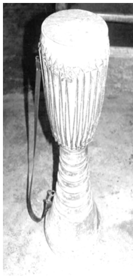
ภาพที่ 4.7 กลองสี่หม้อง

เช่น ไม้ขนุน ไม้มะม่วง และไม้เนื้ออ่อน เช่น ไม้ฉำฉา หน้ากลองมีขนาดเส้นผ่าศูนย์กลางประมาณ 10-12 นิ้ว มีความยาวของหุ่นกลองทั้งหมดประมาณ 30 นิ้ว การตีกลองชนิดนี้ผู้ตีจะยืนตีโดย คล้องสายสะพายกลองที่ป่าและตีกลองจังหวะต่าง ๆ โดยใช้ฝ่ามือ นิ้วมือ หรืออุ้งมือ ตีหนังหน้ากลอง ในตำแหน่งต่าง ๆ ให้เกิดเสียงตามที่ต้องการ กลองสี่หม้องใช้ตีประสมในวงกลองสี่หม้องซึ่งใช้ตี ประกอบการฟ้อนเชิง ฟ้อนดาบ และใช้ตีในขบวนแห่ทั่วไปในเขตภาคเหนือ (ภาพที่ 4.8)