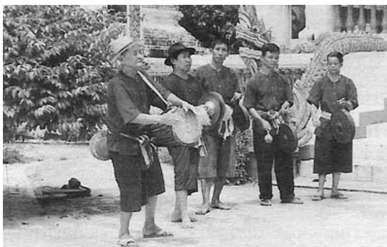
ภาพที่ 4.8 การบรรเลงวงกลองสี่หม้อง ที่มา (สนั่น ธรรมธิ, 2542: 82)