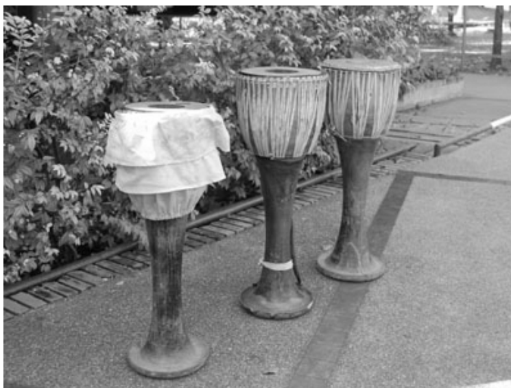
ภาพที่ 4.9 กลองยาว

5. กลองยาว เป็นกลองที่ซึ่งหน้าเดียว มีรูปร่างลักษณะคล้ายกับกลองยาวของภาคเหนือที่เรียกว่า "กลองสี่หม้อง" แตกต่างตรงที่หูของกลองยาวนั้นมีความยาวมากกว่า กลองสี่หม้องเล็กน้อย และไม่มีการกลึงลูกหมากที่เอวกลองและหางกลอง (ภาพที่ 4.9) หุ่นกลองนิยมทำจากไม้เนื้อแข็งปานกลาง เช่น ไม้ขนุน ไม้มะม่วง และไม้เนื้ออ่อน เช่น ไม้จำฉา ไม้มะขามเทศ นิยมหุ้มหน้ากลองด้วยหนังวัว มีสายสะพายกลองสำหรับคล้องไหล่เพื่อความสะดวกในการตี หน้ากลองมีขนาดเส้นผ่าศูนย์กลางประมาณ 8-11 นิ้ว มีความยาวของหุ่นกลองทั้งหมดประมาณ 32 นิ้ว ไทกลองนิยมตกแต่งให้สวยงามโดยการหุ้มผ้าสี เย็บเป็นจีบย่น ๆ รอบตัวกลองเรียกว่า "เสื้อกลอง หรือ กระโปรงกลอง" การตีกลองชนิดนี้ผู้ตีจะยืนตีโดยคล้องสายสะพายกลองที่ป่าและตีกลองจังหวะต่าง ๆ โดยใช้ฝ่ามือ นิ้วมือ หรืออุ้งมือ ตีหน้าหน้ากลองในตำแหน่งต่าง ๆ ให้เกิดเสียงตามที่ต้องการ กลองยาวใช้ตีประสมในวงกลองยาว (ภาพที่ 4.10) ซึ่งใช้กลองยาวประมาณ 3-8 ใบ นิยมใช้ตีในงานมงคลต่าง ๆ ของคนไทยภาคกลาง เช่น งานแห่ขันหมาก งานกฐิน งานผ้าป่า งานโกนจุก งานบวช และงานบุญประเพณีต่าง ๆ นอกจากนี้ยังมี การนำเอากลองยาวมาใช้ตีประกอบการแสดงรำกลองยาว และเกิดเพลง รวมทั้งใช้ตีประสมกับวงมโหรีปี่พาทย์ เมื่อบรรเลงเพลงสำเนียงพม่าบางเพลง