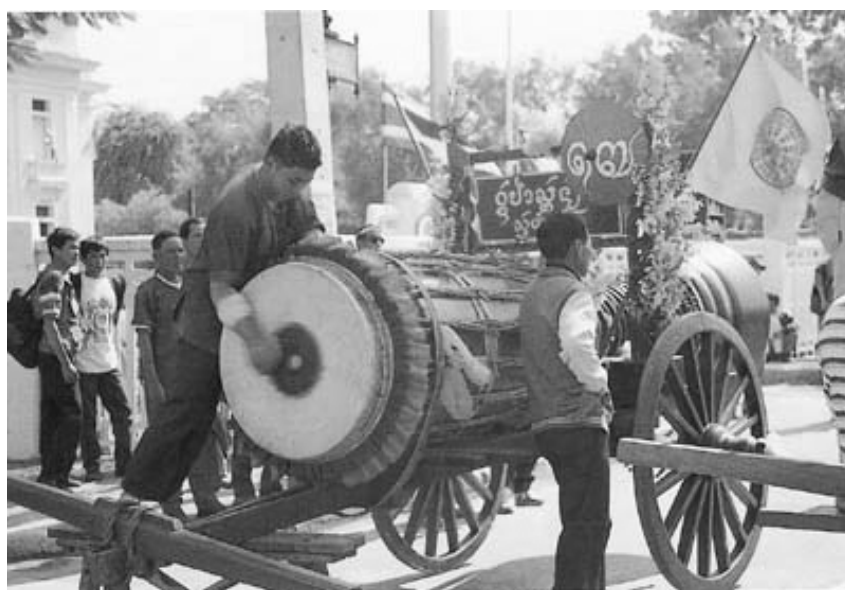
ภาพที่ 4.4 การตีกลองหลวง

(ภาพโดย พิเศษ ภัทรพงษ์ ณ วัดสันมะกรูด ต.บ้านแป้น อ.เมืองลำพูน จ.ลำพูน เมื่อวันที่ 22 มิถุนายน 2548)