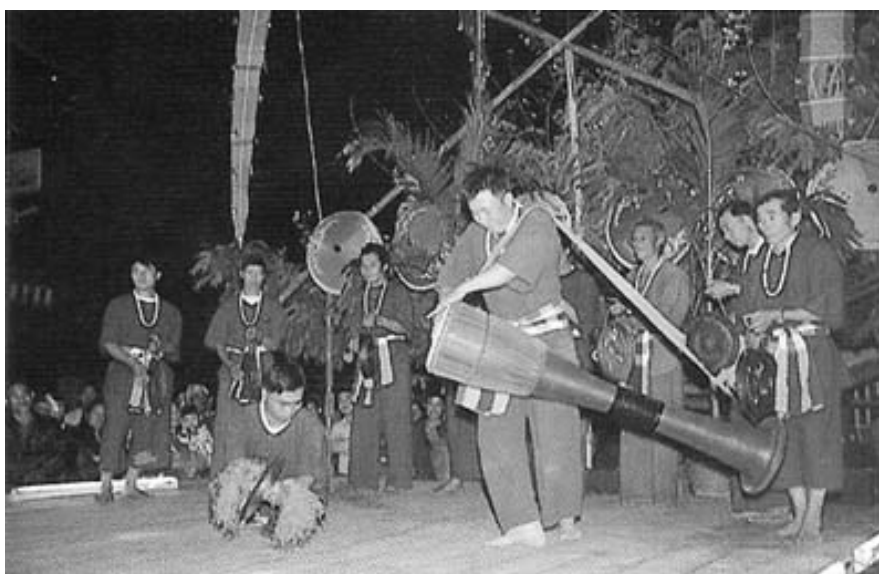
ภาพที่ 4.6 การบรรเลงวงกลองปู้เจ้

กลองปู้เจ้เป็นกลองที่ชาวไทยใหญ่เชื่อว่าเป็นกลองของชาติพันธุ์ตน ชาวไทยใหญ่เรียกกลองชนิดนี้ว่า “ก่องกุ่นยาว” หรือ กลองกั้นยาว ใช้ตีประกอบก้า (ฟ้อน) ของชาวไทยใหญ่หลายชนิด เช่น ก้ากึ่งกะหล่ำ (ฟ้อนนก) ก้าก้าเบ้อ (ฟ้อนผีเสื้อ) และเต็นโต ส่วนชาวไทยลื้อเรียกกลองชนิดนี้ว่า “ก่องตื้นจ้าง” (กลองตื้นข้าง) นอกจากนี้ยังมีชื่อเรียกต่างกันไปตามท้องถิ่น เช่น กลองคู่เจ้ กลองอุเจ้ กลองปู้เจ้ กลองปู้ดเจ้ กลองปู้ดเจ้ ชาวล้านนาได้รับกลองปู้เจ้เข้ามาใช้ในโอกาสต่าง ๆ โดยกลองปู้เจ้ใช้ตีประสมในวงกลองปู้เจ้ ซึ่งใช้ตีประกอบการฟ้อนเชิง ฟ้อนดาบ และใช้ตีในขบวนแห่โดยทั่วไป