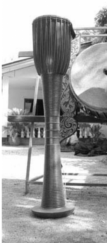
ภาพที่ 4.5 กลองปู้เจ้

3. กลองปู้เจ้ เป็นกลองที่ซึ่งหน้าเดียว มีรูปร่างลักษณะคล้ายกับกลองตั้งหม้อง แต่มีความยาวมากกว่าและมีลวดลายที่ประณีตกว่ากลองตั้งหม้อง (ภาพที่ 4.5) นิยมหุ้มหน้ากลองด้วยหนังวัวตัวเมีย มีสายสะพายกลองเพื่อคล้องไหล่เวลาตี หุ่นกลองปู้เจ้อาจทำด้วยไม้เนื้อแข็ง ไม้เนื้อแข็งปานกลาง หรือไม้เนื้ออ่อนก็ได้ ไม้เนื้อแข็งปานกลางที่นิยมนำมาใช้ทำหุ่นกลองชนิดนี้ ได้แก่ ไม้ซ้อ ไม้ขนุน และไม้มะม่วง ไม้เนื้ออ่อน ได้แก่ ไม้ฉำฉา ส่วนไม้เนื้อแข็ง ได้แก่ ไม้ประดู่ ไม้มะค่า และไม้ชะเง้อะ ปัจจุบันนิยมใช้ไม้ซ้อ และไม้ขนุน เนื่องจากมีเนื้อไม้แน่นและน้ำหนักไม่มากทำให้สะดวกต่อการสะพายกลองเพื่อตี