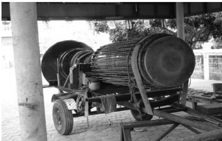
ภาพที่ 4.3 กลองหลวง

ใกล้ ๆ วงรอบที่ติดดวงหน้ากลอง (ซี่จ่า) กลองหลวงเป็นเครื่องดนตรีที่ใช้บรรเลงในขบวนแห่ งานบุญของชาวล้านนา เช่น งานสงน้ำพระธาตุ แห่งพระพุทธรูปสำคัญ ฉลองพื้ดเปรียญ และงาน ปอยหลวง นอกจากนี้ยังใช้ดีเพื่อการแข่งขัน (รณชิต แม้นมาลัย, 2536: 61-66)