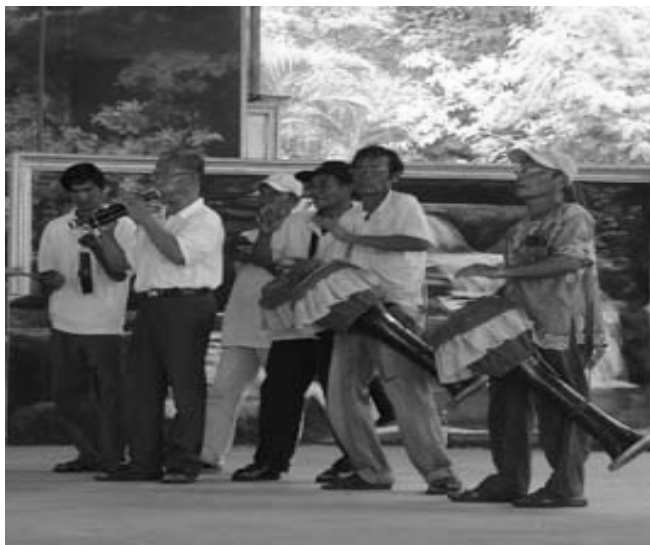
ภาพที่ 4.10 การประสมเครื่องดนตรีในการบรรเลงวงกลองยาว

(ภาพโดย พิเศษ ภัทรพงษ์ ณ หอประชุมโรงเรียนพยุหะวิทยา ต.พยุหะ อ.พยุหะคีรี จ.นครสวรรค์ เมื่อวันที่ 22 ตุลาคม 2549)