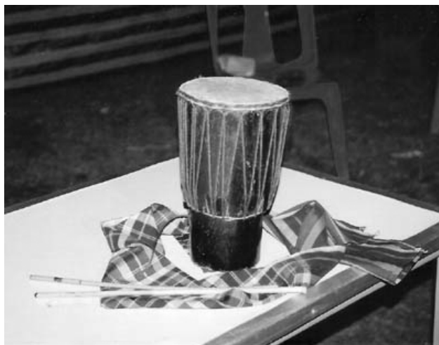
ภาพที่ 4.12 กลองม้งคละ

(ภาพโดย พิเศษ ภัทรพงษ์ ณ สถาบันราชภัฏนครสวรรค์ ต.นครสวรรค์ตก อ.เมืองนครสวรรค์ จ. นครสวรรค์ เมื่อวันที่ 13 ธันวาคม 2545)