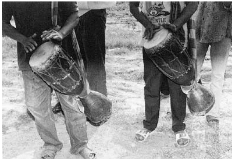
ภาพที่ 4.11 กลองหาง ที่มา (สำเร็จ คำโหมง, 2542: 90)

แห่ดอกไม้ แห่บั้งไฟ และงานบุญประเพณีต่าง ๆ นอกจากนี้ยังมีการนำเอากลองหางเข้ามาบรรเลงร่วมกับวงดนตรีพื้นบ้านต่าง ๆ เช่น วงโปงลาง วงโหวดซอพิณแคน และใช้บรรเลงประกอบการรำผู้ไทย เป็นต้น