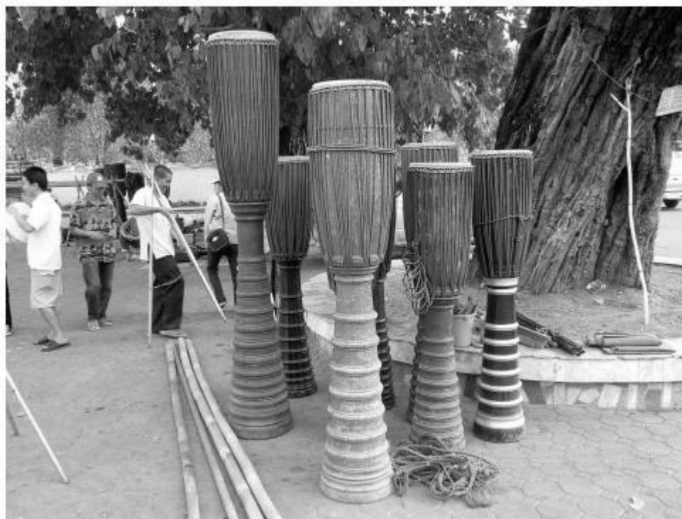
ภาพที่ 4.1 กลองแหวและลักษณะลูกหมาก

(ภาพโดย พิเศษ ภัทรพงษ์ ณ วัดสวนดอก ต.สุเทพ อ.เมือง จ.เชียงใหม่ เมื่อวันที่ 14 เมษายน 2550)