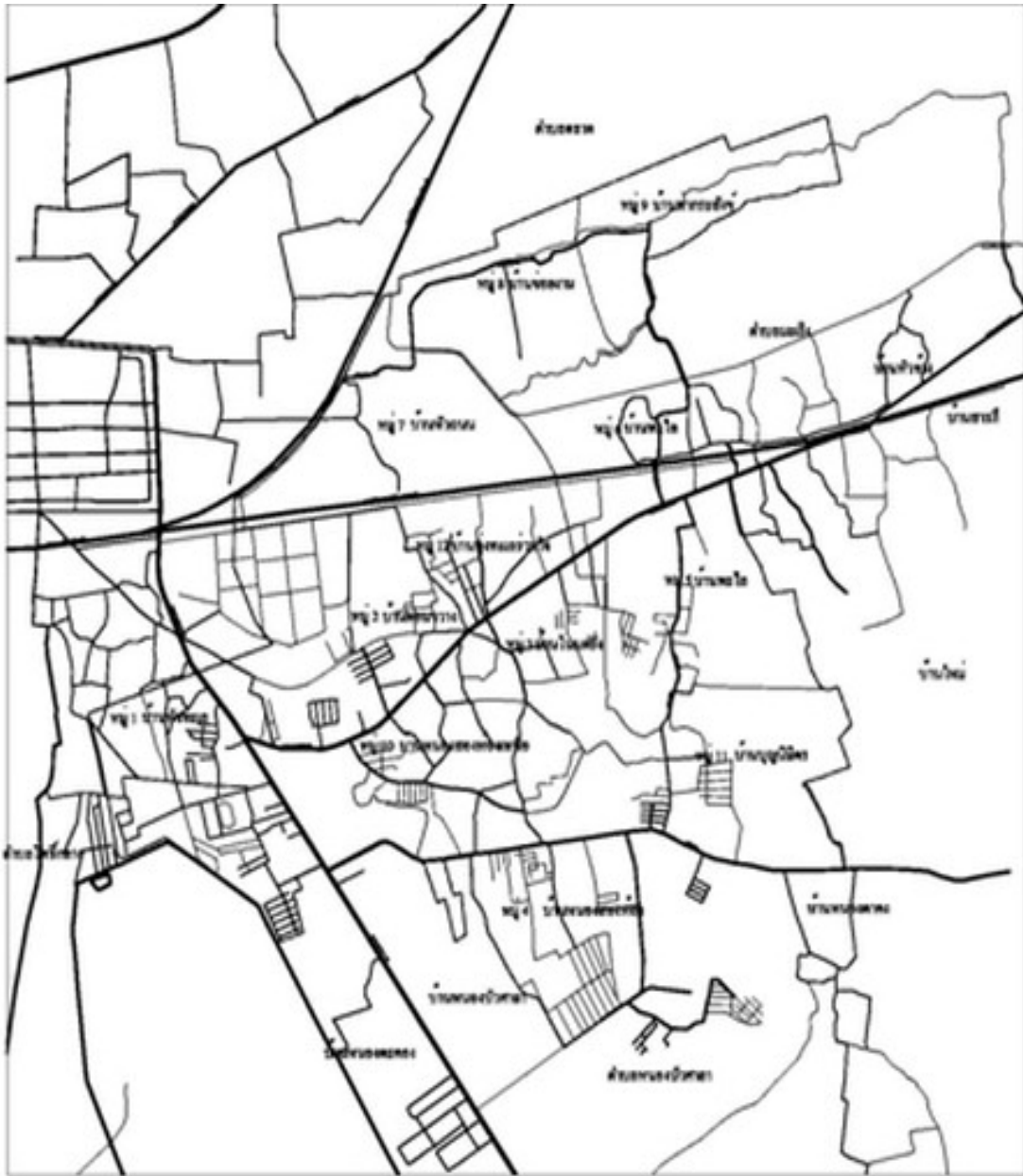
ภาพที่ 4.2 ที่ตั้งเขตหมู่บ้านในเทศบาลตำบลห้วยทะเล