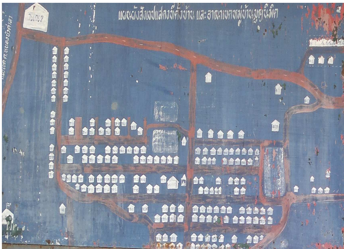
ภาพที่ 4.4 แผนผังหมู่ 11 บ้านบุญนิมิต

นครราชสีมา มีเส้นทางเข้าได้ 2 ทาง คือ ถนนเพชรพระมาตุลา ทางทิศเหนือ และถนนนครราชสีมา ถึงโชคชัย ทางทิศตะวันออก อยู่ห่างจากอำเภอเมืองนครราชสีมา 6 กิโลเมตร ดังแสดงในภาพ 4.4