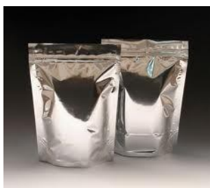
เนื้อตาลผงไปบรรจุในถุงพอยดีในสภาวะสุญญากาศ