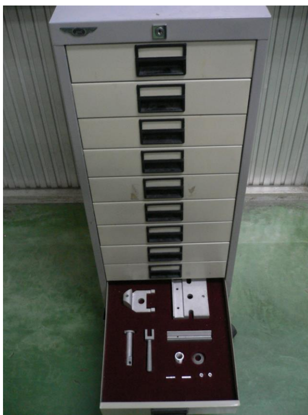
ถอดแยกชิ้นเครื่องมือจับยึดชิ้นงานทรงกระบอกเข้าสู่ตู้เก็บอุปกรณ์เครื่องกล