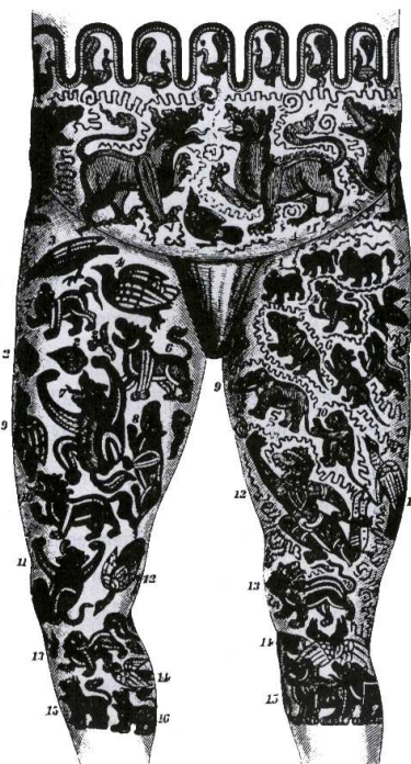
ภาพที่ 2.3 ลายสักของลาวพุงดำ

คำว่า “ลาว” ยังคงเป็นคำที่ฝ่ายสยามใช้เรียกลาวทั้ง 2 กลุ่มอยู่ โดยระยะนี้เริ่มมีการแยกประเภทมากขึ้น โดยลาวล้านนาจะได้รับการเรียกว่า “ลาวพุงดำ” ในขณะที่ลาวล้านช้างจะถูกเรียกว่า “ลาวพุงขาว” อันเนื่องมาจากความนิยมของผู้ชายล้านนาในการสักขาด้วยหมึกดำเป็นลวดลายต่างๆ ตั้งแต่บนเอวคลุมหัวเข่าทั้ง 2 ข้าง (ภาพที่ 2.3)