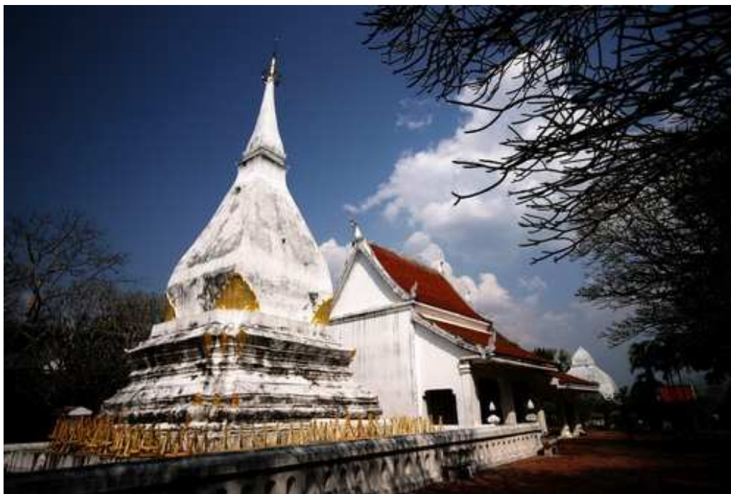
ภาพที่ 2.1 พระธาตุศรีสองรัก อำเภอด่านซ้าย จังหวัดเลย

สมัยสมเด็จพระนเรศวร (พ.ศ. 2133 – 2148) ตรงกับสมัยพระเจ้าวรวงศา- ธรรมิกราช (พ.ศ. 2141 – 2165) อาณาจักรล้านช้างเป็นอิสระจากพม่าและเริ่มมีไมตรีกับ อาณาจักรอยุธยาอีกครั้ง จนกระทั่งสมัยอยุธยาตอนปลายสมัยสมเด็จพระนารายณ์ (พ.ศ. 2199 – 2231) มีการขยายอำนาจเข้าไปยังหัวเมืองนครราชสีมาโดยพระองค์โปรดฯ ให้นายช่างฝรั่งย้าย เมืองโคราชเก่า (อำเภอสูงเนิน) มาอยู่เมืองใหม่ (เดิม วิชาคย์พจนกิจ, 2530, หน้า 5) แต่ไม่ปรากฏ ว่าอาณาจักรล้านช้างมีปฏิสัมพันธ์กับเรื่องนี้แต่อย่างใด