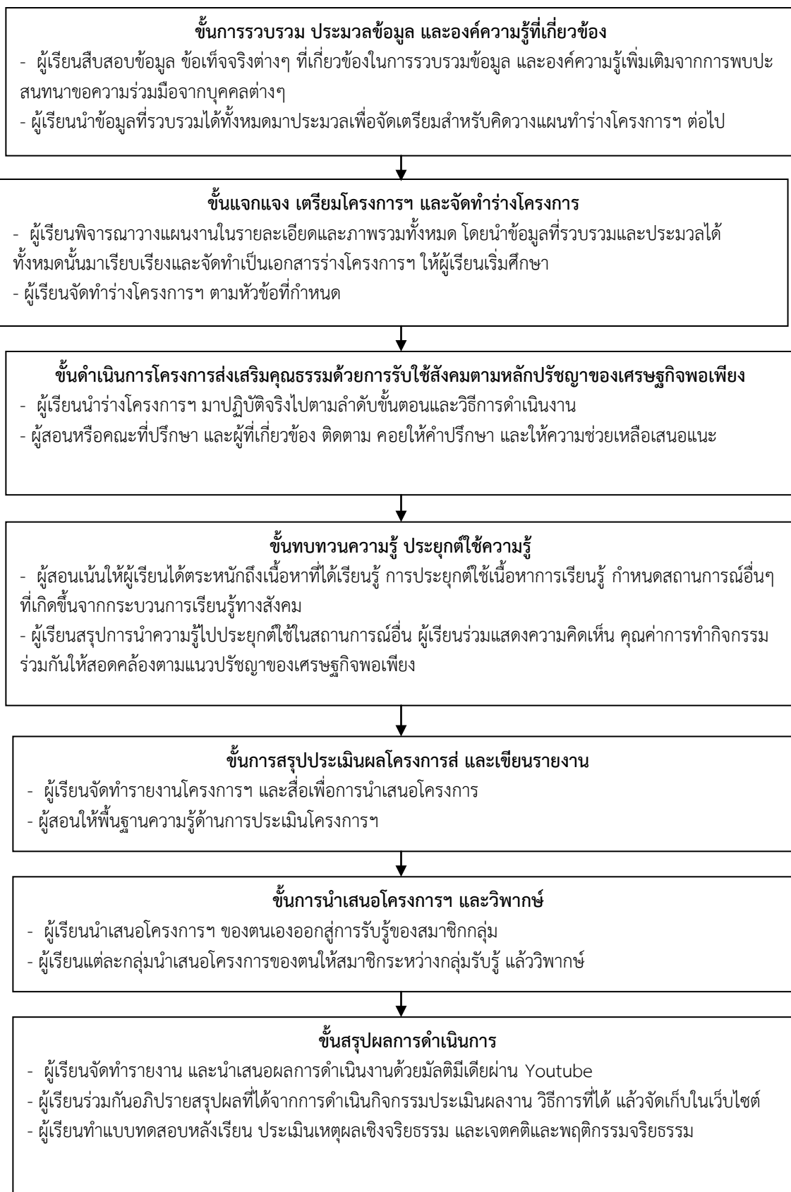
ภาพที่ 5.1 ขั้นตอนการจัดการเรียนการสอน