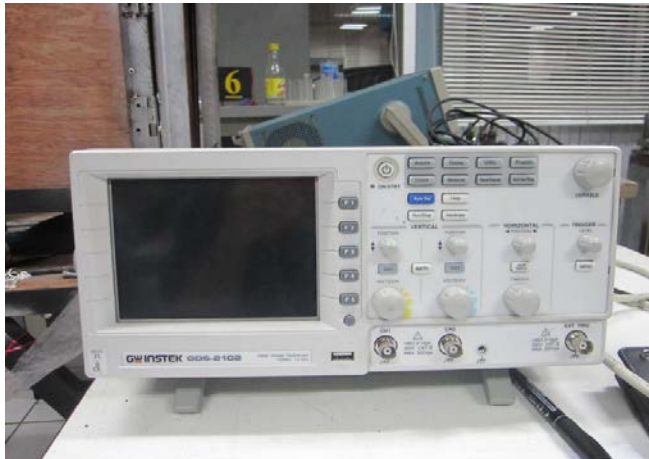
รูปที่ ข.5 ออสซิลโลสโคป รุ่น GWINSTER GDS 2102