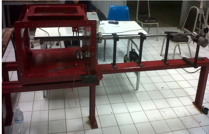
รูปที่ ข.1 Horizontal single stage gas gun