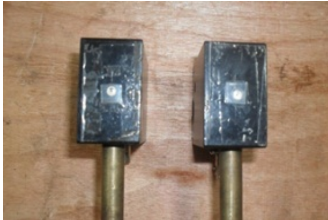
รูปที่ ข.4 ตัวรับสัญญาณเลเซอร์