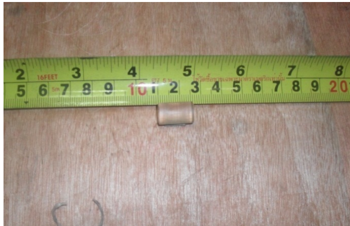
รูปที่ ข.2 กระสุนปืน