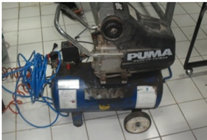
รูปที่ ข.6 ปั๊มลมโรตารี PUMA รุ่น XM-2525 Puma 3Hp ขนาดถังลม 260x700 แรงอัด 8 bar แรงลม 260 L/min