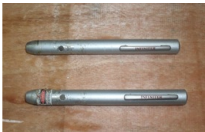
รูปที่ ข.3 เลเซอร์