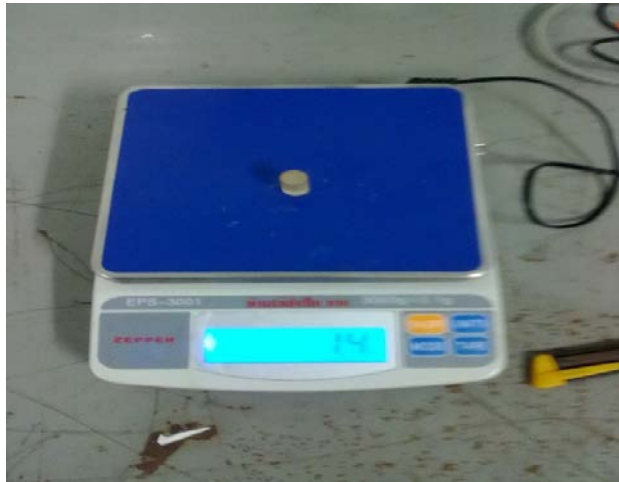
รูปที่ ข.7 เครื่องชั่งดิจิตอล รุ่น GPS-3001 พิกัดกำลัง 3000 g ความละเอียด 0.1 g