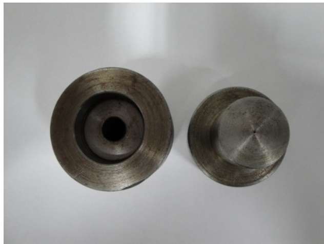
รูปที่ ข.8 หัวฉีด