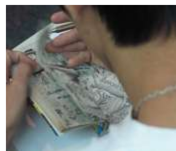
ภาพที่ 1-3 บรรยากาศในห้องเรียนของวิทยาลัยสหวิทยาการปี พ.ศ. 2547

เมื่ออาจารย์มอบหมายงานให้นักศึกษาไปค้นคว้า ให้อ่านหนังสือก่อนเข้าห้องเรียนเพื่อนำประเด็นที่ได้จากการค้นคว้า/อ่านมาถกเถียงกันในห้องเรียน หรือทำรายงานเสมือนการเรียนการสอนทางสังคมศาสตร์ที่อาจารย์คุ้นเคยเมื่อตอนที่ตนเรียนอยู่ในระดับปริญญาตรีบางแห่ง และระดับบัณฑิตศึกษา ก็พบว่า มีนักศึกษาไม่กี่คนที่ค้นคว้ามา