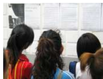
ภาพที่ 8-10 : เรียนรู้ที่มาของแนวคิดการจัดการเขตอนุรักษ์ และข้อคิดเห็นอื่นๆ บนผนังห้องเรียน