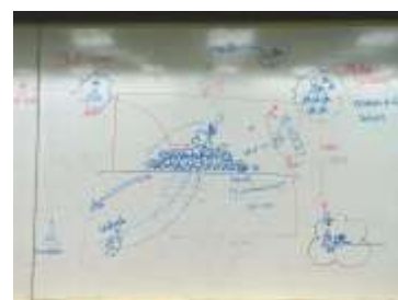
ภาพที่ 5-7 : นักศึกษาช่วยกันสร้างการเรียนรู้จากประสบการณ์การเรียนรู้เดิม