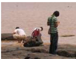
ภาพที่ 14-23: การแลกเปลี่ยนเรียนรู้ระหว่างสถาบัน ระหว่างวันที่ 19-23 กรกฎาคม 2548 จ.อุบลราชธานี